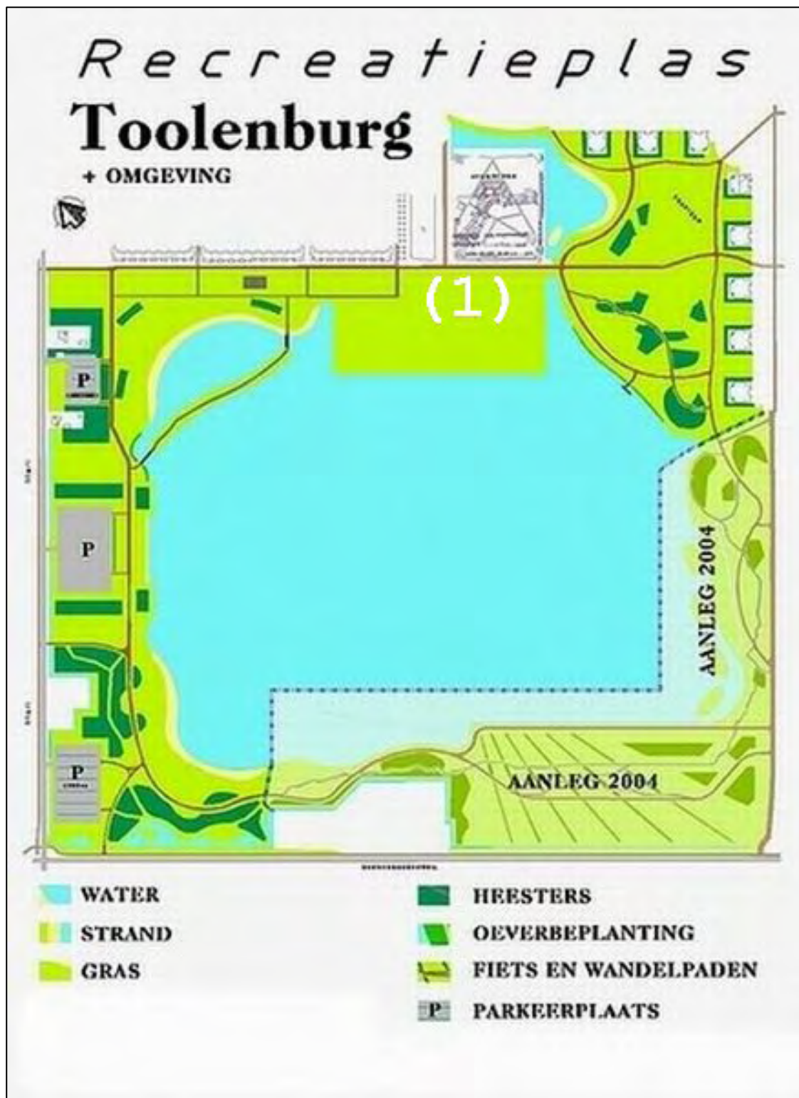
Kaart inrichting oevergebied, april 2003 (website www.rphbv.nl )