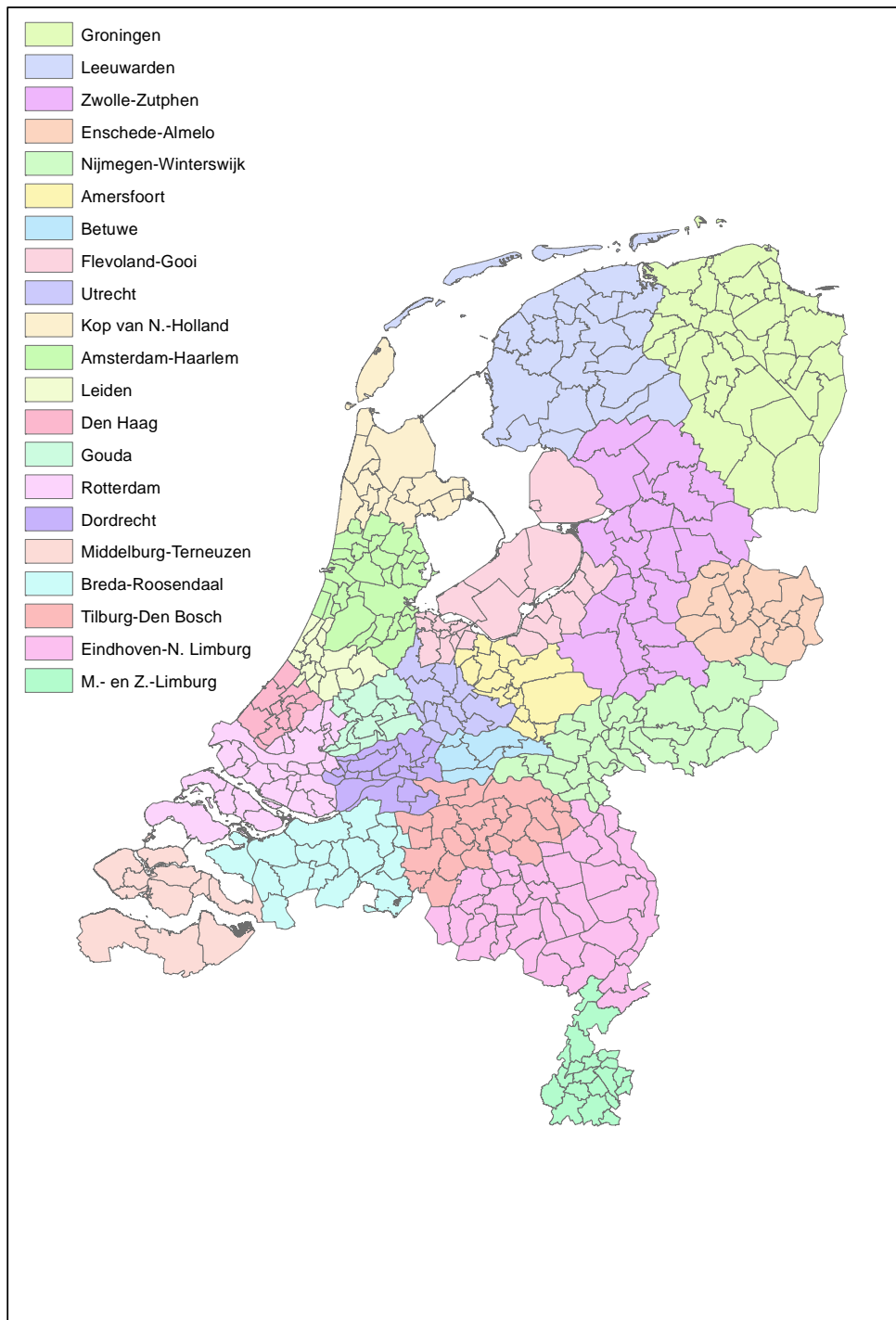
Figuur 1.1: Onderscheiden woningmarktgebieden in de vervolgmetering

Voor het uitvoeren van de vervolgmetering is in overleg met de opdrachtgever gekozen voor het samenstellen van de 21 woningmarktgebieden op basis van de gerealiseerde verhuizingen uit 2005. De regio-indeling die dit opleverde, sluit vrij goed aan bij zowel de in de nulmeting gehanteerde regio-indeling als de regio-indeling die ontstond op basis van de analyse van gerealiseerde verhuizingen in 2011 (zie Bijlage 2). Ongeveer 80% van alle verhuizingen in 2005 vond plaats binnen deze regio's.