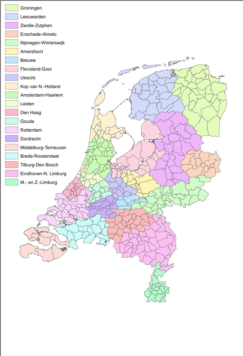
Figuur B2.2: Onderscheiden woningmarktgebieden in de vervolgmeting (intramax 2005)