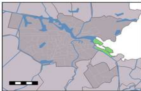
Figuur 1a: IJburg Amsterdam

Het onderzoek had een verkennend karakter met een focus op stedelijke wijken. Want het zijn die wijken waar het debat rondom sociale cohesie zich afspeelt. IJburg Amsterdam is een wijk in aanbouw. Er is in deze nieuwe wijk al onderzoek naar de leefbaarheid verricht (Lupi 2008). Interessant om te weten is of sociale cohesie in zo een nieuwe wijk al voor mensen speelt, of ze daarin willen investeren en onder welke condities. Hoograven Tolsteeg is een wijk in reconstructie. Als zogenoemde Vogelaar-wijk is de daarmee verbonden herstructureringsopgave al begonnen. Bewezen is dat herontwikkeling van wijken de sociale cohesie afbreekt (de Kam and Needham 2003). Extra belangrijk is het daarom te weten wanneer de bewoners in deze wijk op sociale cohesie inzetten, onder welke condities.