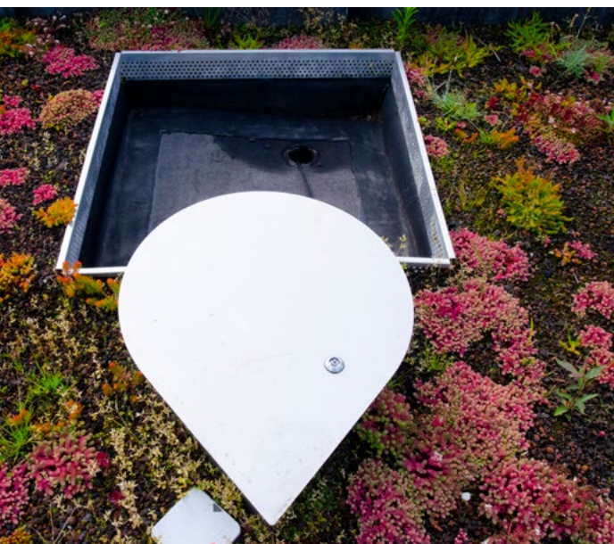
Foto 1 en 2: Een praktisch voorbeeld van de rol van digitale technologieën om te regenereren is het project Resilio in Amsterdam. In dit project worden groen/blauw daken gecreëerd met behulp van het Decision Support System [8].