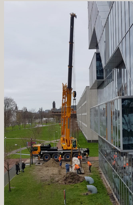
Installing the artwork in front of the faculty of Civil Engineering and Geosciences