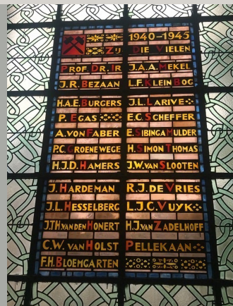
Memorial Window in the stairwell in the former Faculty of Mining at the Mijnbouwstraat 120, Delft

In 2007, the Department of Geoscience and Engineering (or Applied Earth Sciences as it was then called, or Mining and Petroleum Engineering as most alumni still know it), moved from its familiar building at the Mijnbouwstraat to the modern glass-clad Kopgebouw at the heart of the TU Delft campus. Although the new building rapidly became a new home to staff and students, leaving the Mijnbouwstraat also meant losing a lot of things. One of them was the experience of ascending the main staircase and looking up: twenty-one names in black against a bright yellow and red background were calling you. Twenty-one names of twenty-one students and staff who lost their lives in a time and under circumstances that are unimaginable to most of us, a generation that has never experienced war, but that are still dear to those who new knew them. A small Schlägel und Eisen and the words “Zij die vielen 1940-1945” made clear to all who went up or down the stairs what this stained glass window was about.