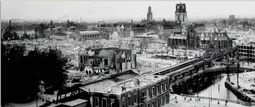
Rotterdam after the bombing