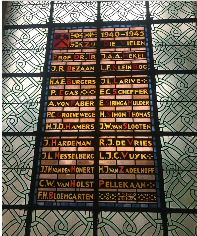
Memorial Window in the stairwell in the former Faculty of Mining at the Mijnbouwstraat 120, Delft