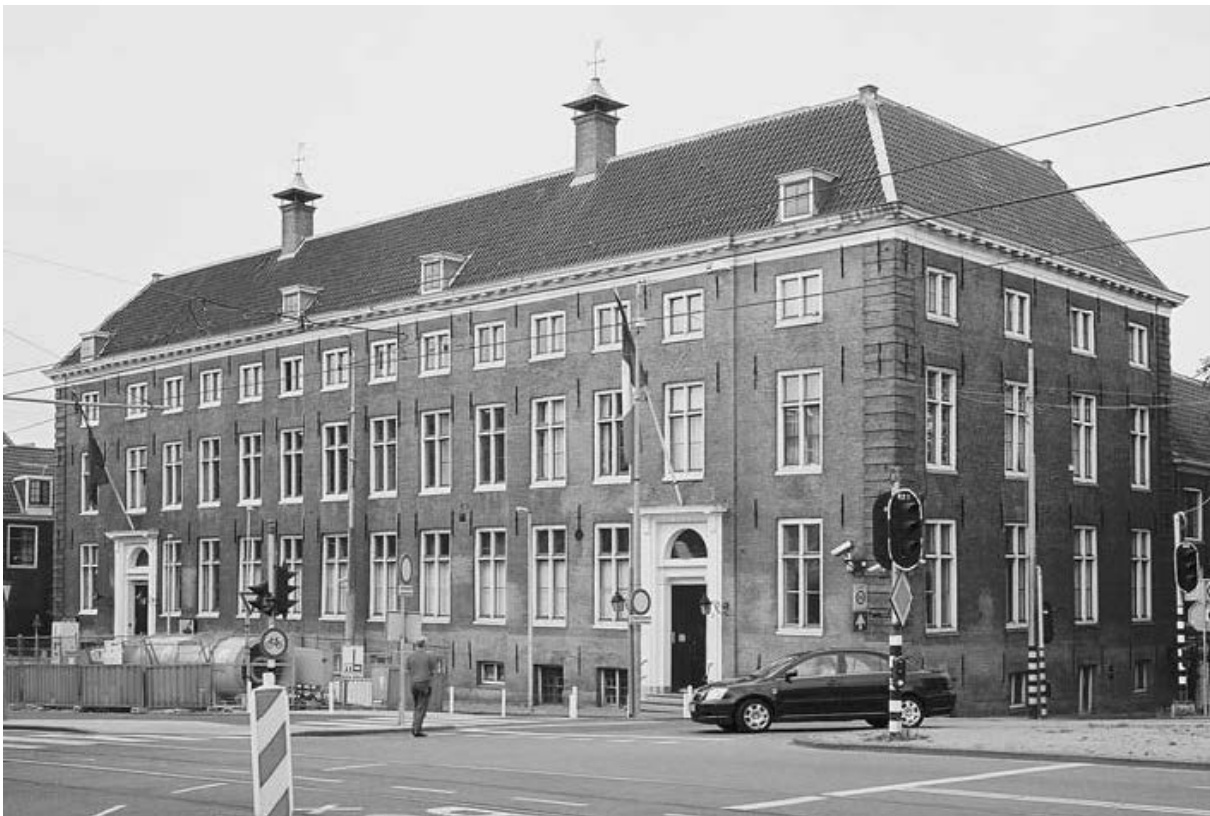
Figuur 1 Voormalig Walen Weeshuis, Vijzelgracht 2 te Amsterdam ( (Bosman, 2010) (pagina 144)