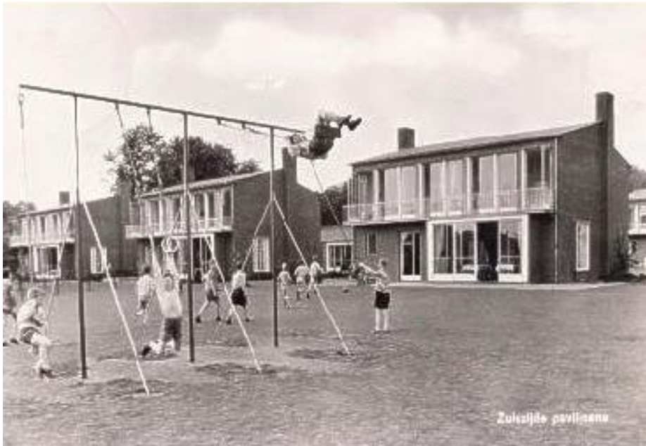
Figuur 7 Oude ansichtkaart van de drie paviljoens van de Zuidgevel, open en licht. (Sint-Godelieve, 2022)

sombere gevel. (Ven, Heer, Bergman, & Doms, 1989) (pagina 59). De 'huisjes' waren ontworpen voor 12 á 13 kinderen en drie verzorgers. De verzorgers hadden een elk een eigen verblijf op de verdieping waardoor er altijd twee verzorgers aanwezig waren in ieder 'huisje'. Naast deze verblijven waren de slaapverblijven van de jongens en van de meisjes op de verdieping. Op de begane grond was de gezamenlijke woonkamer. Daarnaast was er aan de noordzijde een berging met als doeleinde zoals spreekkamer, slaapkamer of berging. (Sint-Godelieve, 2022).