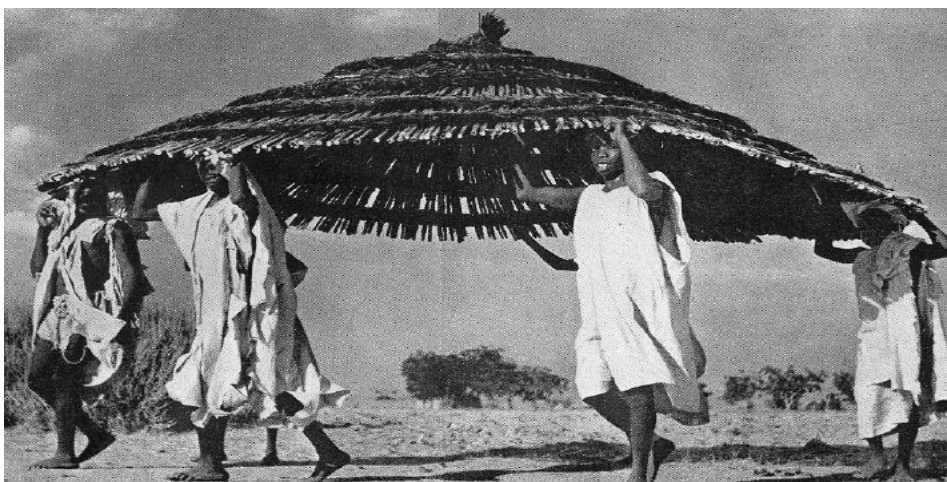
Figuur 4 (van Gastel, 2006) (pagina 1) Een inspiratie voorbeeld voor de Vernaculaire architectuur.