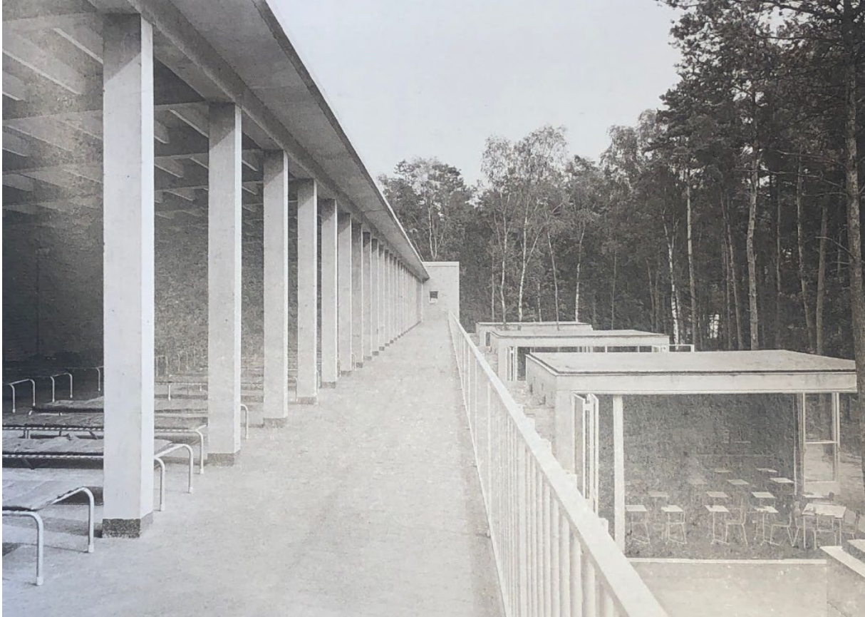
Figuur 6 Open luchtschool (Ven, Heer, Bergman, & Doms, 1989) (pagina 61)

Echter werden veel kenmerken van deze stijl niet tot uiting gebracht in de openluchtschool op het herstellingsoord St. Godelieve maar gaf Jos Bedaux er een compleet eigen draai aan betreft details en opzet. Opvallend is dat het complex een duidelijke horizontale lineariteit heeft. De trappenhuizen op beide kopzijdes van het hoofdgebouw tonen een duidelijke verticale beëindiging van het langgerekte hoofdgebouw (Ven, Heer, Bergman, & Doms, 1989) (pagina 59) .