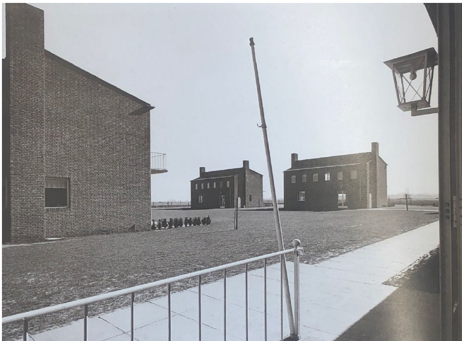
Figuur 8 Aanzicht van gevels van de 'huisjes' voor het verblijf van de kinderen. (Ven, Heer, Bergman, & Doms, 1989) (pagina 62)