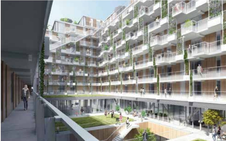
Nog te bouwen Fenixlofts in het Rotterdamse Katendrecht, FOTO: WAX & MEI ARCHITECTS AND PLANNERS

centrum van ons land. Het is daarom van belang dat er een nationale woonvisie komt met betrekking tot krimpregio's die samenvalt met een economische strategie: bouw voor nieuwe impulsen, of geleid de demografische transitie. In beide gevallen hebben lokale overheden richting en steun nodig.