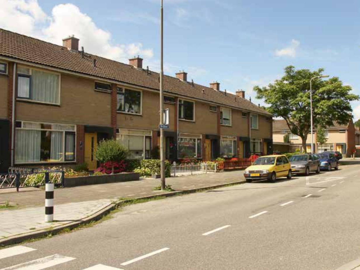
Groekern in Zoetermeer , FOTO: HARALD MOOIJ, TU DELFT

se onderzoeken blijkt echter dat er onvoldoende binnenstedelijke capaciteit is om de geschatte woningbehoefte te realiseren. Zelfs als alle procedures worden versneld, gestroomlijnd en er subsidie op gaat, zal dit slechts in geringe mate (ca. 25-30%) in de woningbehoefte voorzien. Al zien we deels ook een verschuiving in de woningvraag, zeker bij jongeren. 'De' overheid stelt zich op het standpunt dat de markt het moet oplossen, maar de markt kan dus slechts beperkte bijdrage leveren. Het zou jammer zijn als de kansen op deze binnenstedelijke locaties onbenut blijven, onnodig ten koste gaan van 'de groene wei'. Uitbreidingen aan de rand van de stad bieden voor sommige steden een passend alternatief. Hier ligt een