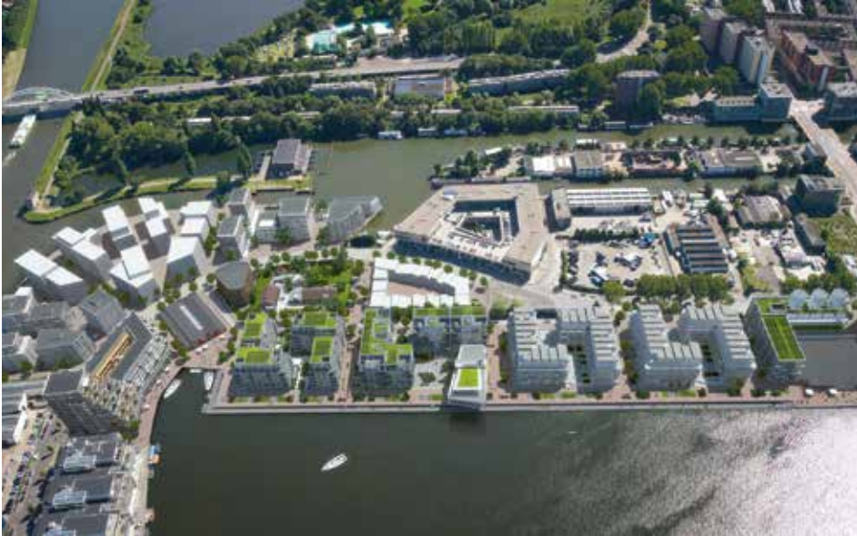
Het Cruquiusgebied in Amsterdam

volg van de groter wordende vraag betekent een stedelijke woningnood waar alle sociale groepen mee te maken hebben. Marktpartijen vinden het aantrekkelijk om te bouwen voor meer vermogende huishoudens op populaire plekken. Ook gemeenten accommoderen dat graag, mede om financiële redenen. De vraag is dan wie de belangen van minder vermogende burgers behartigt. De sociale huursector lijkt de aangewezen actor hiervoor, maar deze sector geeft aan op dit moment onder zware druk te staan in het woonbeleid. Woningcorporaties zijn ooit ontstaan om het marktfalen in de bouw van woningen voor geschoolde arbeiders en lagere middenklasse op te vangen en kunnen deze rol nog steeds vervullen, eventueel samen met nieuwe wooncoöperaties gerund door burgers en bijvoorbeeld zorginstellingen.