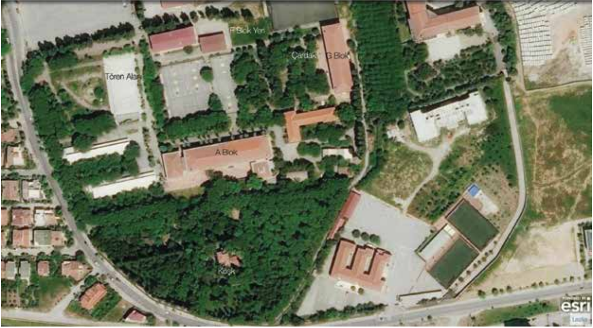
Figür 3 Bornova Anadolu Lisesi içinde yer alan bloklar ve köşk ( https://mapmaker.nationalgeographic.org ).

Kendimi ana bulvar olarak adlandırdığım kilit taşlarla döşeli uzun bir yolda buldum kapıdan geçtikten sonra. Tören alanı sağda yer alıyordu. Dikdörtgen bir planda, her sınıf nizami bir biçimde sıralanmış aynı yöne bakıyordu. Atatürk büstünün yer aldığı yükseltilmiş bir platform üzerinde biraz önce kapıda bekleyen müdürümüz öğrencilere hoş geldiniz konuşması yapmak üzere yerini almıştı. İstiklal Marşı'nın okunmasının ardından sınıflarımızı bulmak üzere tören alanından ayrıldık. Bu alan Cumhuriyet'in kurucusuna saygıyı gösteren bir alan olmasının yanı sıra, Osmanlı İmparatorluğu'nun yıkılmasının ardından kurulan cumhuriyetin ve küllerinden doğan İzmir'in alanlarıyla (Cumhuriyet Meydanı, Gündoğdu Meydanı gibi) eşdeğer nitelikteydi. Bu resmi ve güçlü işlevi, bahar şenliklerinde yerini konserlere bırakıyordu. Bu geçici işlevsel dönüşüm aynı zamanda bizi ve bu alandaki davranışlarımızı da dönüştürüyordu.