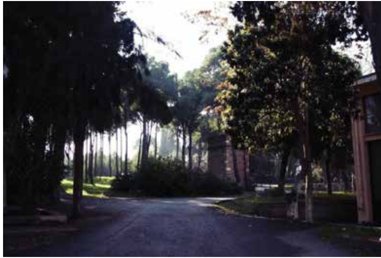
Figür 9 Koru ve Güvercinlik.