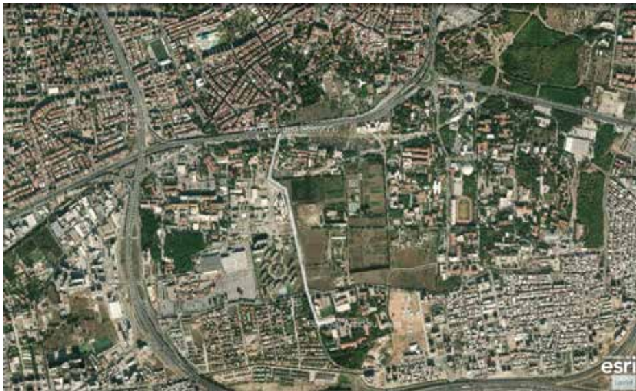
Figür 2 Bornova Tren İstasyonu'ndan Bornova Anadolu Lisesi'ne doğru izlenen yol ( https://mapmaker.nationalgeographic.org ).