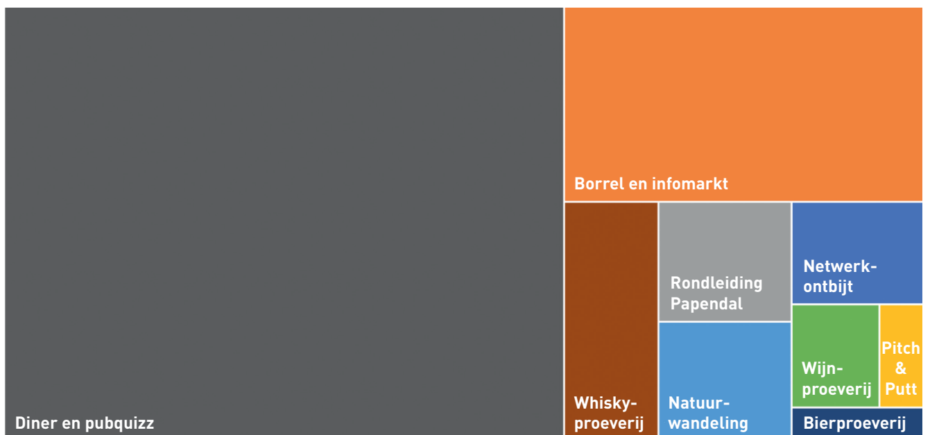
Figuur 1 – Relatieve deelname nevenprogrammaonderdelen

Het thema van het congres betrof ditmaal de nabije toekomst, 2025: wat gaat u anders doen? De congrescommissie gaf hier het goede voorbeeld door naast de vertrouwde denk- en doe-sessies, zeg maar de presentaties en workshops, een nieuwe sessie te lanceren: de droom-sessie. Hierin konden sprekers samen met de deelnemers een blik op de toekomst werpen. In vier ronden van elk tien parallelsessies – die denk-, doe- en droom-sessies dus –