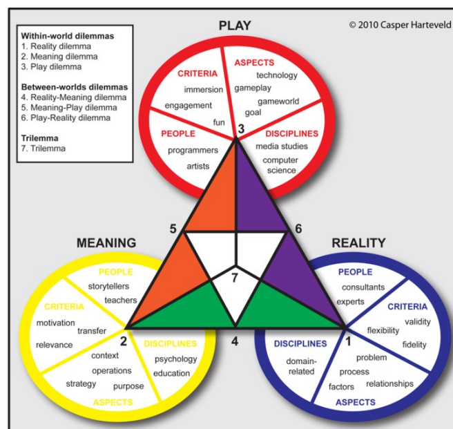
Figuur 1: Triadic Game Design Approach (Harteveld, 2010)

De laatste jaren is 'serious-gaming' steeds meer een onderzoeksthema aan de TU-Delft er was er ook een algemeen keuzevak waarin studenten leerden over game ontwikkeling en ook daadwerkelijk games ontwikkelden. Samen met docenten van dat vak werd het concept van Business Logistics Gaming gebruikt voor een nieuw vak Supply Chain Gaming.