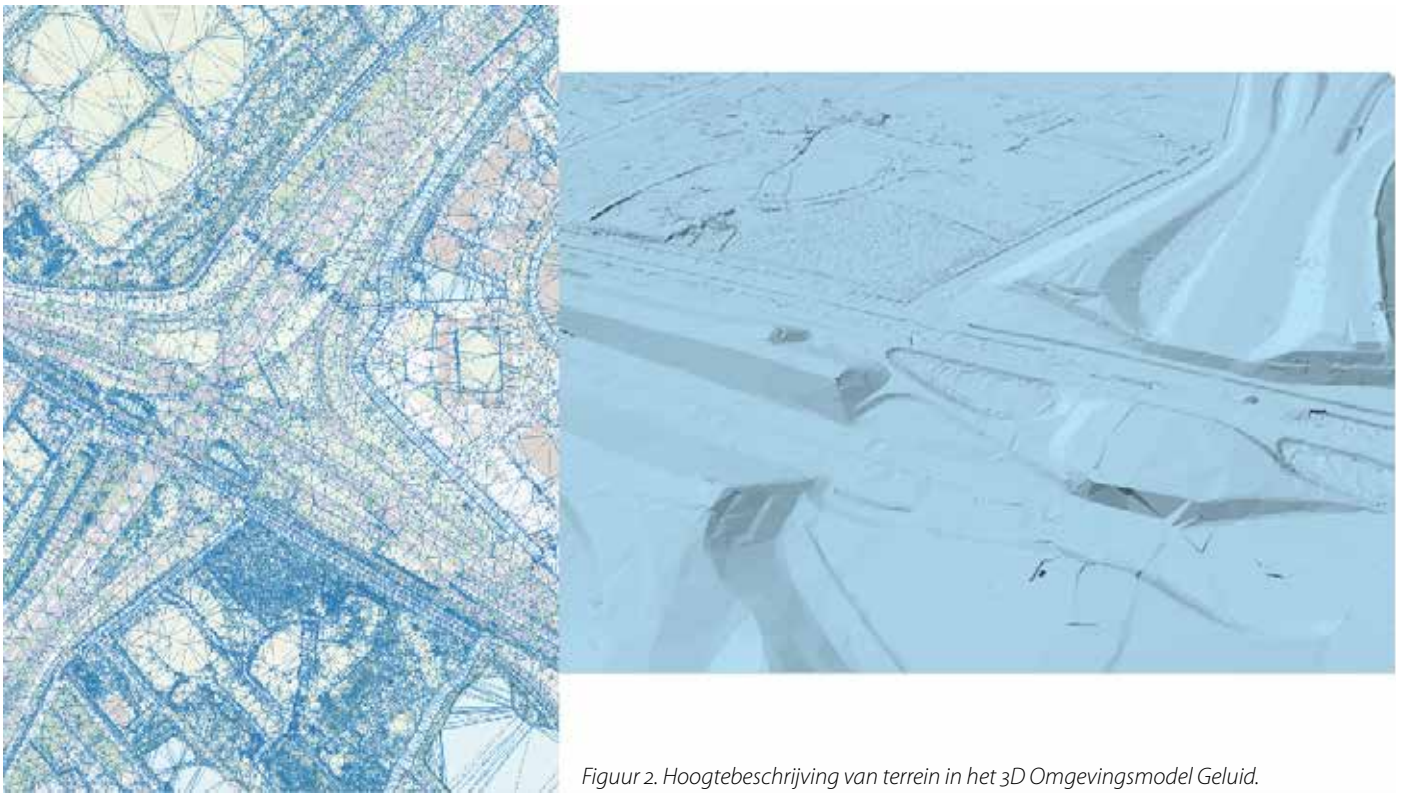
Figuur 2. Hoogtebeschrijving van terrein in het 3D Omgevingsmodel Geluid.