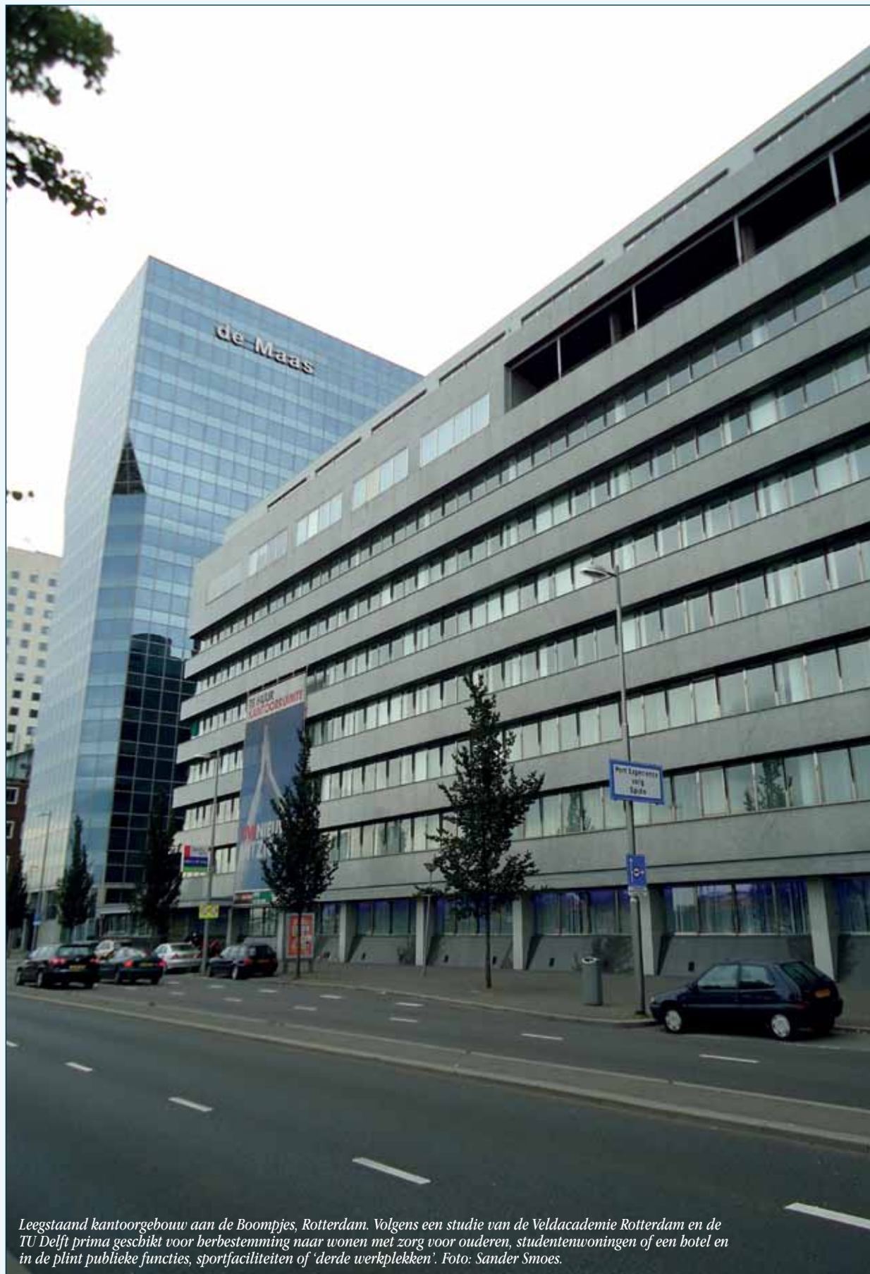
Leegstaand kantoorgebouw aan de Boompjes, Rotterdam. Volgens een studie van de Veldacademie Rotterdam en de TU Delft prima geschikt voor herbestemming naar wonen met zorg voor ouderen, studentuwoningen of een hotel en in de plint publieke functies, sportfaciliteiten of 'derde werkplekken'.