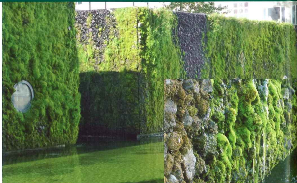
Aanpassing van de betonnen buitenhuid om begroeiing door varens, algen en bijvoorbeeld mossen mogelijk te maken. Hier is ervoor gekozen om de oppervlaktestructuur van het beton aan te passen zoals besproken in jaargang 2 nr.5, 2011. Dit artikel beschrijft een diepgaandere studie naar het materiaal beton zelf en hoe de mengselsamenstelling hierin eventueel een rol speelt. Op deze wijze zou het mogelijk worden om gewone, traditionele betonnen constructies te maken met een groen uiterlijk, zoals het gemeentekantoor in Reykjavik (IJsland), en anderzijds om mos en algengroei definitief uit te sluiten.

Algen en mossen, maar voornamelijk bepaalde kleurige korstmossen kunnen het betonoppervlak verfraaien en bovendien een positieve milieubijdrage leveren door bijvoorbeeld het 'vasthouden' van regenwater, het invangen van fijnstof en stikstofoxiden en het verhogen van de biodiversiteit. In voorgaande studies zijn aanwijzingen gevonden dat algen en vooral korstmossen de oppervlaktelaag van beton kunnen verdichten, wat een gunstig effect kan hebben op de levensduur van constructies. Waarom bepaalde typen beton wel en andere niet spontaan begroeid raken, is echter nog grotendeels onduidelijk. Vele factoren en combinaties hiervan kunnen een rol spelen, zoals de samenstelling van het betonmengsel, de ouderdom en milieuomstandigheden.