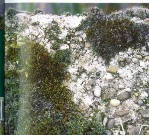
Figuur 2a Verweerd betonoppervlak gekoloniseerd door mossen, een veel voorkomend lokaal verschijnsel op oudere betonconstructies. Door het verweerde oppervlak worden vocht en bodemstofdeeltjes langer vastgehouden door het beton, waardoor een voedingsbodempogecreëerd wordt voor vegetatie.

Onderzoek is hier nodig. We vermoeden eigenlijk al dat het voorkomen van wel of geen uitbundige