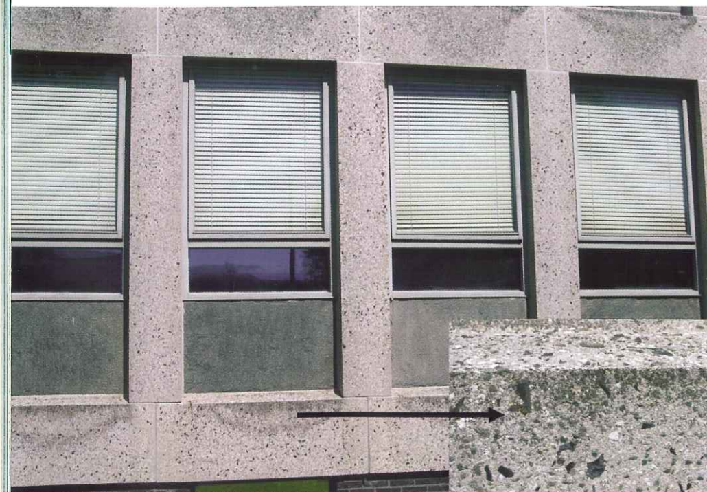
Figuur 5 Een gebouw uitgevoerd in schoonbeton. Een mooi voorbeeld van een plek waar het lokaal ontstaan van algengroei onwenselijk is, zoals is te zien op de foto. Door het beheersen van de materiaaleigenschappen zouden we dus in staat moeten zijn om dergelijke lokale vervuiling van het oppervlak uit te sluiten. Bij andere constructies zouden we dit juist kunnen stimuleren, door het oppervlak volledig te laten begroeien door bijvoorbeeld algen en mossen.

Het kunnen sturen van de mate van spontane vegetatiebegroeiing op betonconstructies is belangrijk, omdat daarmee in het bijzonder op onderhoudskosten veel geld bespaard kan worden. Afhankelijk van de doelstelling en functionaliteit van een constructie kan begroeiing wel of juist niet wenselijk zijn. Zoals eerder gesteld kan vegetatiegroei bijdragen aan het verhogen van de ecologische waarde van constructies, met name door het invangen en daardoor verlagen van het fijnstof- en stikstofoxidegehalte in de lucht, de werking als waterbuffer en het verhogen van de biodiversiteit en de esthetische waarde. Wanneer de relaties tussen de bepalende factoren zoals betonmengselsamenstelling, betoneigenschappen, omgevingsfactoren en het voorkomen van spontane begroeiing opgehelderd zijn, kan dit gebruikt worden om voor nieuwe constructies het type en de mate van begroeiing te voorspellen. Het sturen van vegetatiegroei en het gebruik ervan als indicator voor de betonkwaliteit, zal belanghebbenden in staat stellen te besparen op productie, onderhoud en reparatiekosten en tegelijkertijd de esthetische en ecologische functionaliteit van betonconstructies te verhogen op een natuurlijke manier.