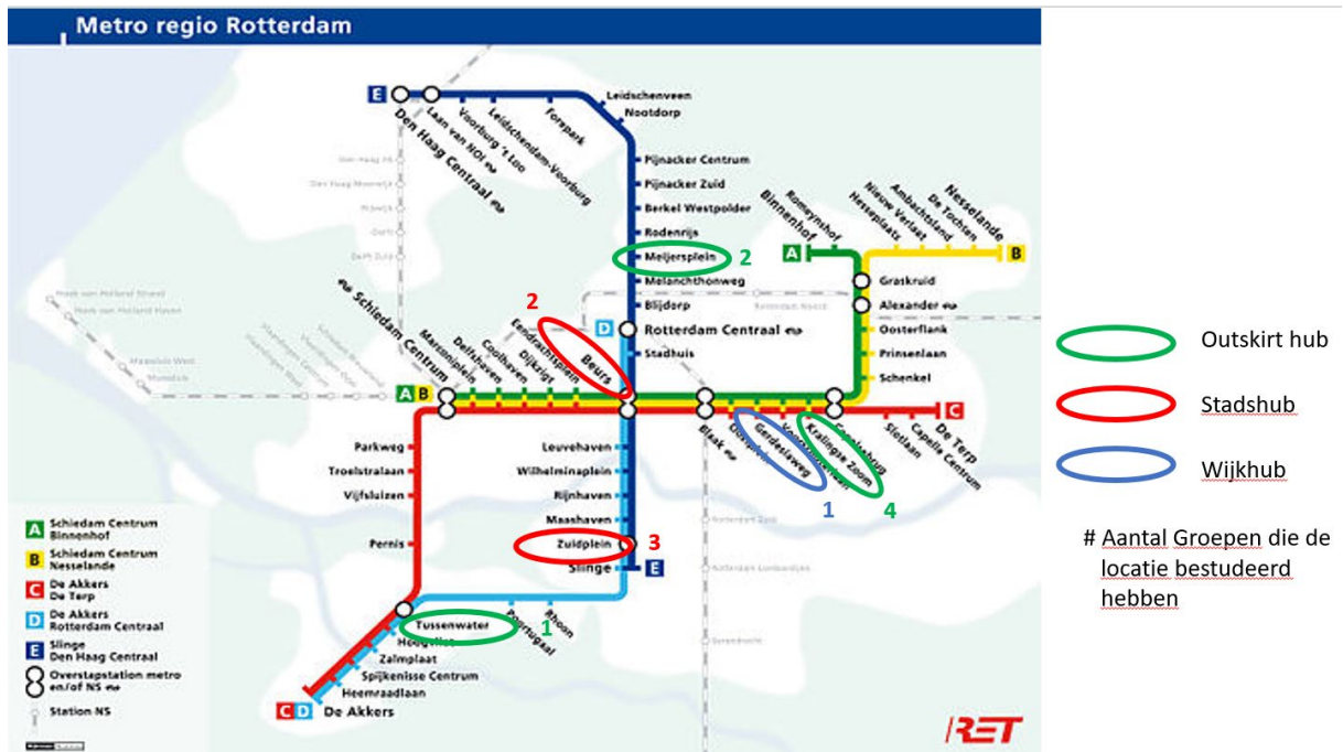
Figure 2. Overzicht van de typologisch onderzochte metrostations in Rotterdam

Kralingse Zoom is als station het meest populair om te onderzoeken (zie Figuur 2, 4 groepen studenten). Ondanks dat Kralingse Zoom tegen het centrum aanligt, wordt deze locatie toch bestempeld als outskirt hub, omdat deze locatie buiten het voorgenomen besluit van de Zero-Emissie Zone ligt. Oplossingen die voor deze locatie zijn aangedragen, zijn het faciliteren van opslagruimte, binnenstad beleving met nachtmetro, postpakket punt (met eventueel zelfs een autonome connectie naar het PostNL sorteercentrum), autonome beleving met gebruikmaking van de Brainpark shuttle naar het Rivium en Brainpark (pakketten, facilitaire goederen en catering) en een postpakketpunt.