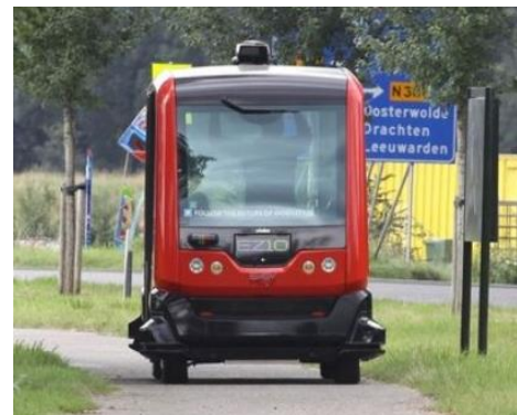
Figuur 4: Plaats op het fietspad (Groot, 2016)