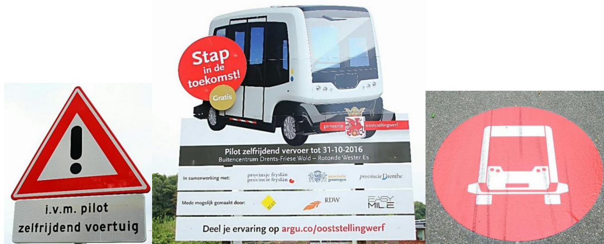
Figuur 5: Waarschuwingsborden en wegmarkering (Koene, 2016)

asfalt aangebracht waarmee duidelijk werd dat er sprake was van een bijzondere situatie. Daarnaast waren op een aantal plaatsen passeerhavens gerealiseerd zodat de voertuigen elkaar konden passeren. Om te voorkomen dat het voertuig onnodige obstakels zou detecteren, zijn laaghangende takken langs de route gesnoeid en is de berm tijdens de pilot regelmatig gemaaid (Stoep, Evaluatieverslag, 2016) (Boersma, Eigen observatie september, 2016). Onderstaande afbeeldingen van figuur 5 laten een aantal van de waarschuwingsmethoden zien. De eerste twee afbeeldingen geven de waarschuwingsborden weer zoals deze langs de route waren geplaatst. De derde afbeelding laat de markering zien zoals deze was aangebracht op het betreffende fietspad.