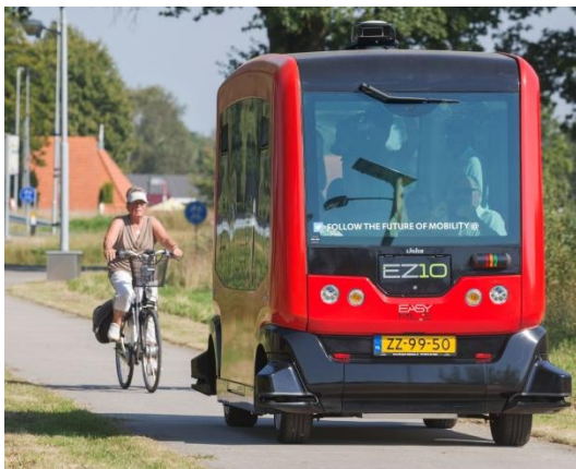
Figuur 3: Verhouding voertuig - fietser (Provincie Groningen, 2016)

In het evaluatieverslag van de gemeente Ooststellingwerf en de RDW wordt geconcludeerd dat het fietspad niet zowel het voertuig als de fietsers gelijktijdig kan faciliteren. Derhalve zijn er verkeersregelaars ingezet om de andere weggebruikers te informeren over het voertuig en het gedrag daarvan (Stoep, Evaluatieverslag, 2016). Daarnaast had de steward als gastheer/vrouw een belangrijke rol in de informatievoorziening (Stoep, Casestudy Appelscha, 2017). Meer over de inzet van de verkeersregelaars is de te lezen in de paragraaf 'Struikelblokken en oplossingen'. Hieronder zijn twee afbeeldingen (zie figuur 3 en 4) weergegeven waarop de plek van het voertuig op het fietspad duidelijk wordt.