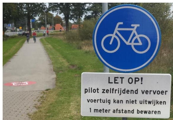
Figuur 6: Extra waarschuwing d.m.v. onderbord (Boersma, Eigen observatie oktober, 2016)

Na beoordeling van de aangepaste situatie door RDW, is de tweede ontheffing ingegaan. Let wel; de ontheffing is nooit door RDW ingetrokken. Op 6 oktober 2016 is de dienstregeling voor het vervoeren van passagiers hervat.