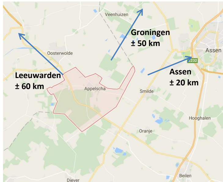
Figuur 1: Ligging Appelscha (Google Maps)

De plaats Appelscha ligt in de gemeente Ooststellingwerf, Friesland. De gemeente Ooststellingwerf is een zogenaamde 'krimpregio'. Een krimpregio is een regio waarbij het aantal inwoners naar verwachting met 4% zal afnemen tot 2040 (Rijksoverheid). Momenteel heeft Appelscha 4740 inwoners (Gemeente Ooststellingwerf, 2017). Door de terugloop van het aantal inwoners in de gemeente, staan de voorzieningen onder druk. Slechts in de grotere plaatsen zijn de voorzieningen gevestigd zoals scholen, huisartsen en winkels. De dichtstbijzijnde stad is Assen (zie figuur 1), welke op 20 kilometer afstand ligt.