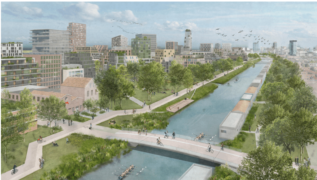
Figuur 7. Merwedekanaalzone is ontwikkeld volgens het principe van de gezonde stad. Een groenblauw raamwerk geeft de wijk een duurzaam kader waarbinnen de gebouwen kunnen worden ontwikkeld.

De wijk is een schaalniveau dat zich goed leent voor transformatie, voor het nadenken over de kracht van gemeenschappen, van de openbare ruimte, de woonopgave, etc. Maar het zal uiteraard samenhangen met de inzichten zoals bijvoorbeeld het circulair en landschapsinclusief maken van onze voedselproductie waarvoor we meer ruimte nodig zullen gaan hebben. Het mooie van al die ruimtelijke samenhangen is dat met de inzet van de juiste ontwerp- en verbeeldingskracht er op alle terreinen zich prachtige perspectieven openen. Omarm de complexiteit.