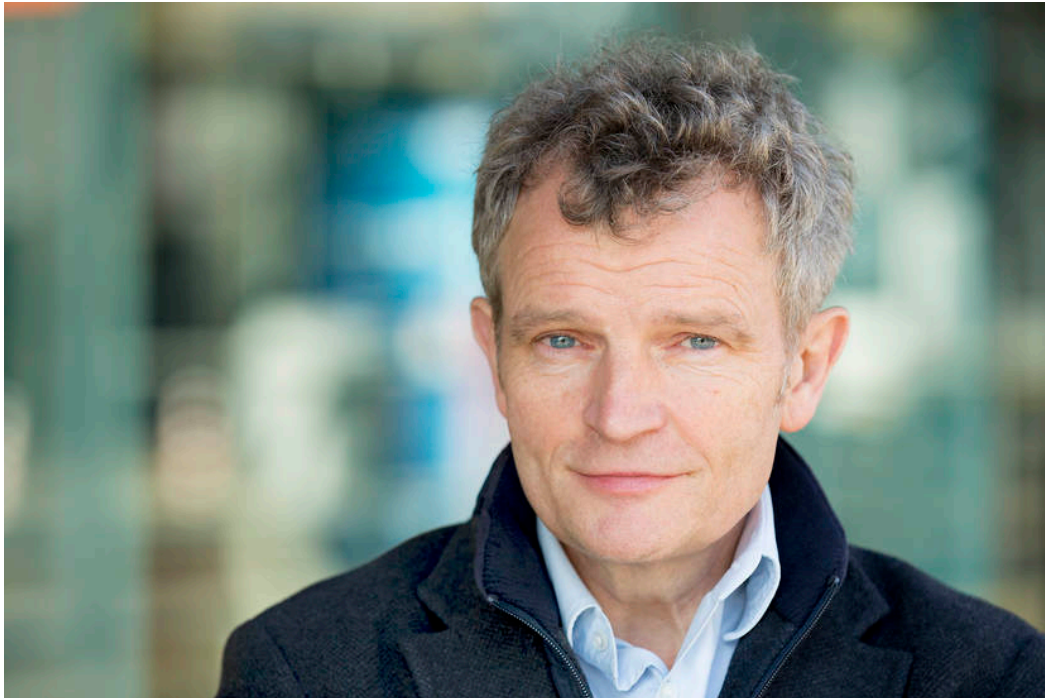
Figuur 1. Rijksbouwmeester Floris Alkemade.