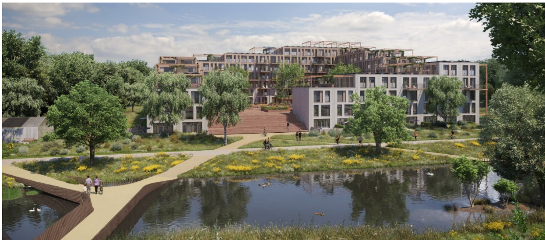
Figuur 5. Proeftuin Erasmusveld Den Haag door BPD ontwikkelt staat gezond en duurzaam centraal. Woongebouwen zijn in een parkachtige omgeving gesitueerd.

Ook hier is de tegenstelling veel te grof, het werkelijke speelveld is veel subtieler en ruimtelijk ook veel interessanter. De vraag is van welke intentie men uitgaat. Tegenstellingen zijn misschien minder groot. Belangrijk is dat mensen een keuze hebben waar ze kunnen wonen, ook een wooncarrière kunnen maken in de eigen woonomgeving. Dat kan de stad zijn, middelgrote stad of dorp. Belangrijk is wel dat we er mee ophouden om automatisch iedere vernieuwingsgolf stelselmatig buiten de bebouwde gebieden te willen bouwen. Het absorptievermogen van de bestaande stad voor extra woningbouw is enorm groot. Als we onze bestaande woonwijken gemiddeld met 10 à 15 % weten te verdichten, echt niet zo'n onmogelijke opgave, kunnen we al bijna een miljoen woningen kwijt. Bovendien kunnen we dan in diezelfde operatie ook onze bestaande woningen verduurzamen, onze openbare ruimtes opwaarderen en sociale problematieken als vereenzaming en sociale segregatie tegengaan. Op dit moment consumeren we in Nederland ruim 8 hectare open ruimte per dag, dat terwijl een circulaire vorm van landbouw niet minder maar meer ruimte nodig zal hebben. We hebben in Nederland vijf miljoen eengezinswoningen en twee miljoen gezinnen met kinderen. Laten we goed nadenken over hoe de hele keten in elkaar steekt, hoe de zorg en de demografie drastisch aan het veranderen zijn en van daaruit bedenken welke woontypologieën we nu moeten toevoegen om die keten op de juiste manier in beweging te krijgen.