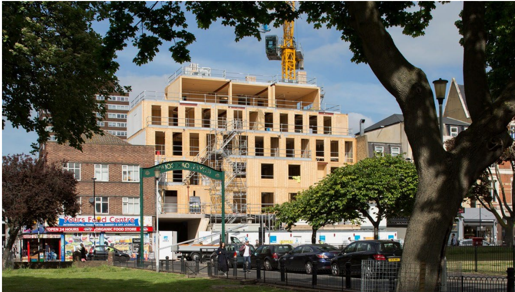
Figuur 2. Pitfield Street, Hackney Londen. De architecten Waugh Thistleton combineren CLT-techniek met renovatie van een bioscoop en uitbreiding met woningen. Verdichten en renovatie in een stedelijke omgeving met CLT-houtbouwtechniek biedt veel mogelijkheden voor steden.

Wat moet de rol van de rijksbouwmeester zijn?