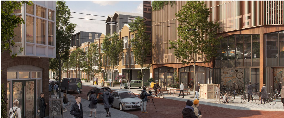
Figuur 3. Den Haag CID, met een mix van verplaatsen van functies (de prostitutiezone verdwijnt uit de Rivierenbuurt en gaat naar de Binckhorst), optoppen van woningen en nieuwbouw van hout vindt men ruimte in de bestaande stad. Bijvoorbeeld De Pletterijstraat in Haagse Rivierenbuurt.

Wat is er nodig om de ambities van Panorama Nederland te realiseren?