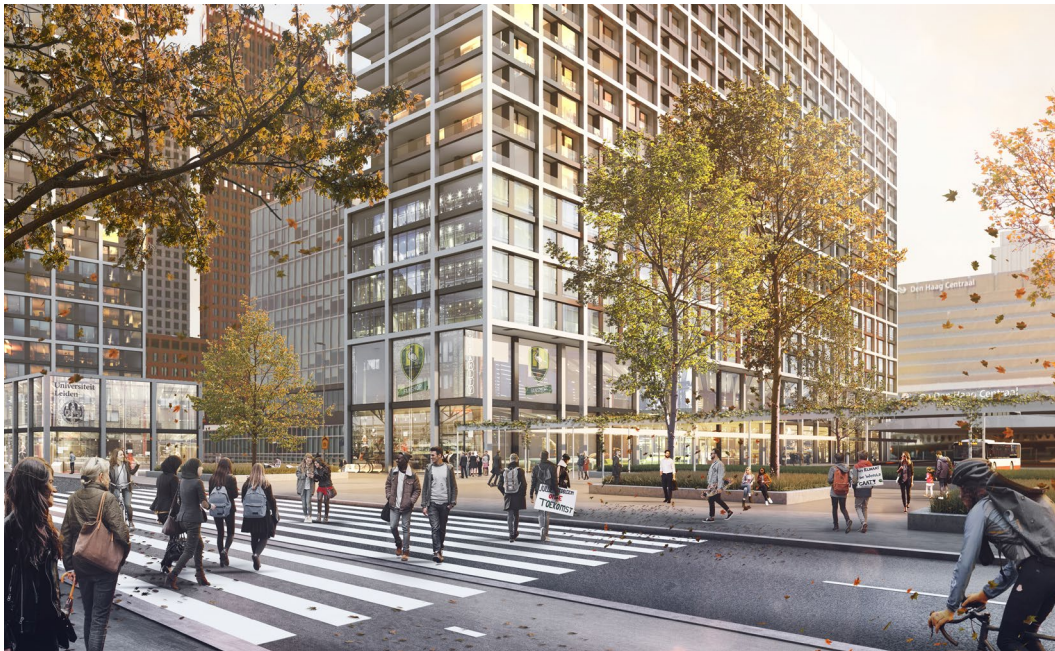
Figuur 6. Reuring in het CID Den Haag, in 2020 werd het Ontwerpstructuurvisie CID Den Haag ter visie gelegd. De structuurvisie werd door de Dienst Stedelijke Ontwikkeling, De Zwarte Hond en Witteveen + Bos ontwikkeld. De 'Inspraak- en participatieverordening gemeente Den Haag 2012' was leidend voor de gesprekken met de stad en had een informeel karakter naar de burgers.

Coalities werken wel goed op wijkschaal, een wijkgerichte aanpak is adequaat om integraal de problemen aan te pakken. Vaak gaat het om een cultuur van overleg, bouwen etc. die men moet opbouwen in wijken dat tijd kost. De sectorale budgetten moeten in samenhang gebracht worden de maatschappelijke problemen te kunnen oplossen. Als je kosten wilt uitsparen is het noodzakelijk om de energietransitie – de woningen van het gas af – te koppelen aan de veranderende zorg en vergrijzing en aan het bieden van andere woontypologieën en het CO2 neutraal bouwen. Van een dergelijke integrale aanpak kunnen we nog heel veel plezier gaan beleven. Dat uit te stellen is een onverantwoorde manier van geldverspilling.