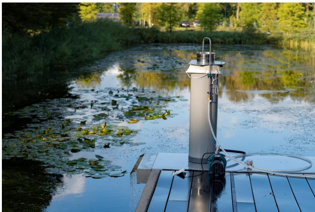
Afbeelding 1: Een van de opstellingen die KWR gebruikt voor monsternamen