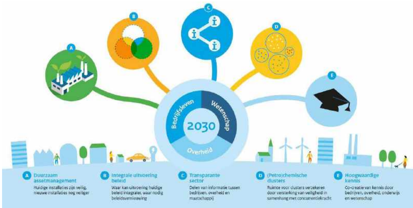
Figuur 3: Programma Duurzame Veiligheid 2030

en professionalisering waardoor de veiligheid verhoogt. Ook door kennisdeling en inzetten op 'peer pressure' kan men elkaar samen op een hoger veiligheidsniveau brengen. Er zijn verschillende aspecten die de samenwerking tussen verschillende (al dan niet geclusterde) bedrijven kunnen beïnvloeden. Het gaat hier onder meer over de invloed van ondersteunende organisaties, de invloed van ondersteunende wet- en regelgeving (die voornamelijk focust op een individuele benadering van bedrijven), de impact van de eventuele moedermaatschappij, en de impact van gelijkaardige processen en producten binnen verschillende bedrijven.