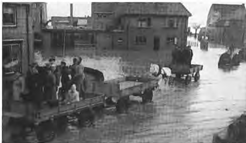
Kruiningen. Politie, Rode Kruis en Waterleidingpersoneel.