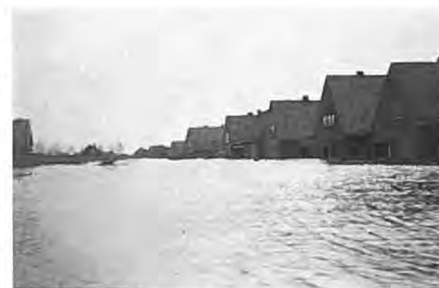
2 April 1953 te Waarde.