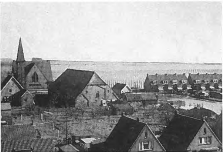
Gezicht op Rilland.