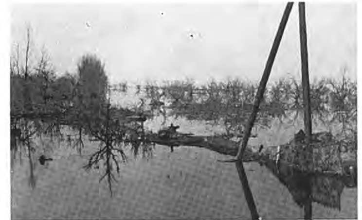
Rilland: ondergelopen boomgaarden.

Ook de landbouwwerktuigen en auto's werden zo snel mogelijk geborgen. Ieder uur, dat zij langer in het zilte nat stonden, betekende meerdere schade. Om mogelijke diefstal te voorkomen werd de politie versterkt en een strenge controle ingesteld. Niemand mocht zich zonder schriftelijke vergunning in het noodgebied ophouden. In het kantoor van de Bathpolder werd een nood-secretarie ingericht en later ook een nood-post- en telefoonkantoor, totdat barakken