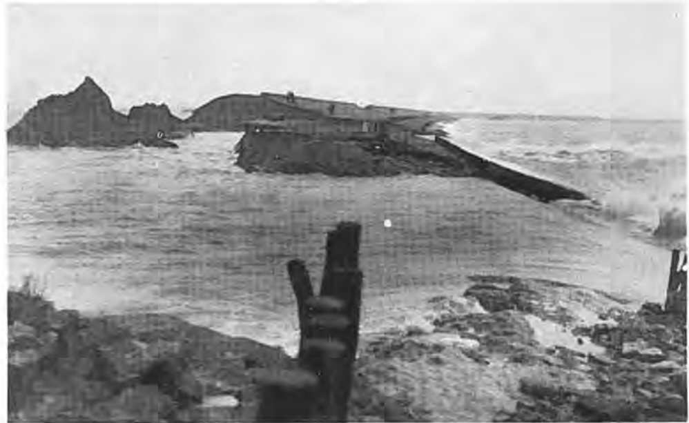
De stroomwerking in een der doorbraken in de dijk van de Krui-ningerpolder.

hoewel er van een felle politieke actie hier in Krui-ningen nooit sprake is.”