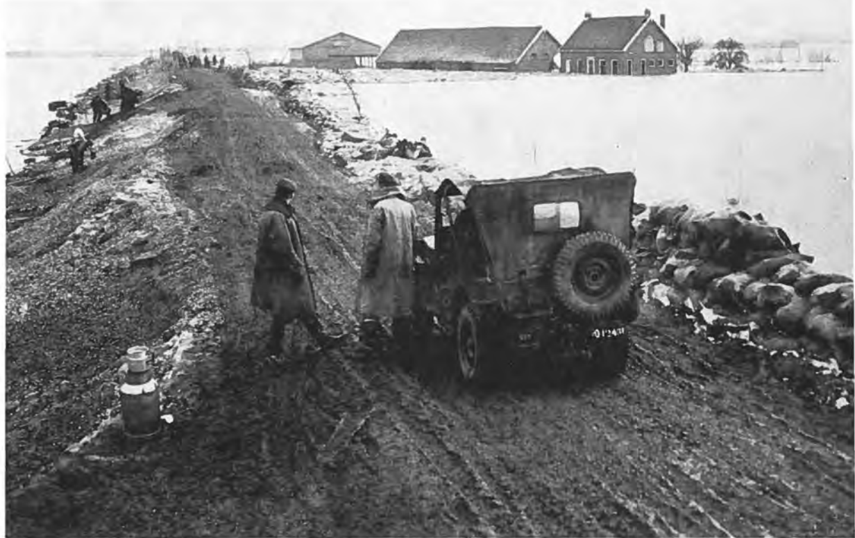
De Nieuwlandse-binnendijk wordt tot zeedijk versterkt.

Hoewel de bedoeling van dit gedenkboek in de eerste plaats is een met foto's verluchte beschrijving te geven van de watersnood in de direct getroffen woonplaatsen van Oost-Zuid-Beveland, zo zou het toch niet op volledigheid aanspraak kunnen maken, als daarin met geen woord werd gerept over het temidden van dit rampgebied gelegen en gespaard gebleven dorp Krabbendijke. Met opzet schrijven we het „dorp” Krabbendijke, dit nl. ter onderscheiding van de „gemeente” Krabbendijke, die wel direct door de watersnood is getroffen in de tot deze gemeente behorende gedeelten van de buurtschappen Oostdijk en Gawewe.