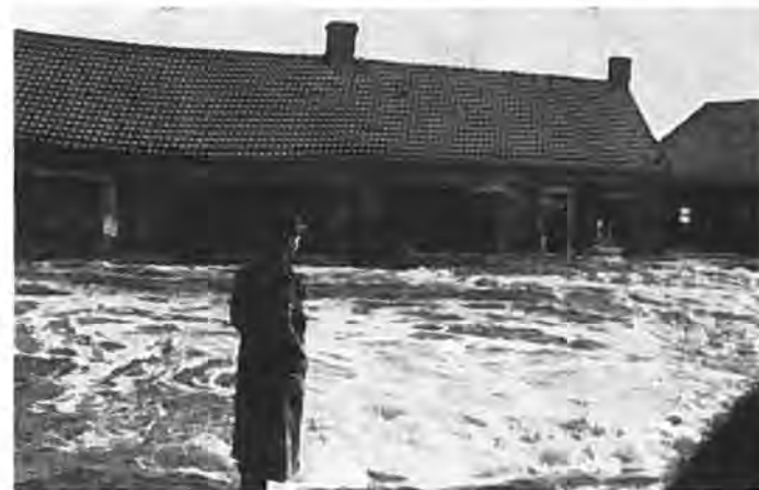
Stroomversnelling door gat in Lavendeldijk met woonhuizen.

Zoals nagenoeg elke daarbij betrokken woonplaats, werd ook Krabbendijke door het gebeurde in de nacht van 31 Januari op 1 Februari 1953 volkomen verrast. De op eerstgenoemde dag via de radio gedane mededelingen omtrent een te verwachten gevaarlijk hoge waterstand, ook bij Bergen op Zoom, vermochten niet de gemoederen in ernstige ongerustheid te brengen. Dergelijke mededelingen waren wel eens meer gedaan, zonder dat deze gevolgd waren door noemenswaardige