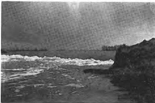
Kadijk te Waarde.