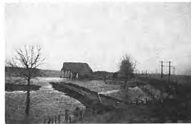
De resten van een mooie Zeeuwse boerderij.