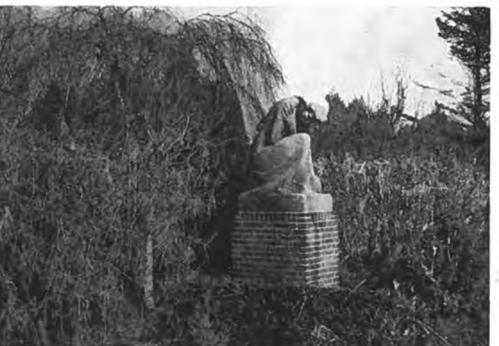
Het gedenkteken voor oorlogsslachtoffers op het kerkhof te Rilland.

Nu werden alle krachten ingespannen om het schip op de juiste plaats te zetten. Bevelen weerklonken. Omstreeks kwart voor tien was het gat geblokkeerd. Vier sleepboten lieten hun sirenes loeien, witte rookpluimen opstuwende in de blauwe lucht. Zandzakken begonnen over de transportbanden te glijden en ploften in het water. Een bak steen werd in een minimum van tijd voor het schip gestort. Van de andere zijde naderde het zinkstuk en werd snel op zijn plaats gebracht. Toch moest er nog de hele dag hard gewerkt worden om de dijk dicht te houden. Vrijwilligers werkten tot laat in de avond. Maar ook hier was eindelijk de zege bevochten: de Reygersbergse polder was in zijn geheel van de Schelde afgesloten.