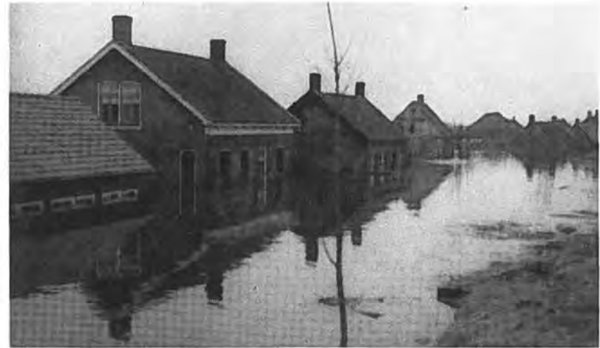
Kruiningen. Zanddijk.