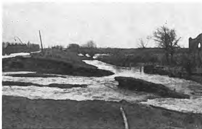
Gezicht op het gat in de Lavendeldijk.

Het eerste optreden in de strijd tegen het water op 1 Februari had, zoals te begrijpen is, nagenoeg geheel plaats in ongeorganiseerd verband. Dit kon eenvoudig niet anders. Aanvankelijk deden de wildste geruchten de ronde, zodat niemand met de werkelijke stand van zaken geheel op de hoogte was. Zo ging dus ieder min of meer op eigen gelegenheid naar de meest bedreigde plaatsen, om daar te doen wat zijn hand vond om te doen. En het mag gezegd worden, dat er in Krabbendijke veel en goed werk is gedaan op deze historische Zondag. In het voorgaande is getracht