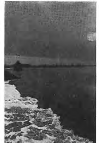
Het woelige water bij „Luchtenburg”.

Het onderbrengen van dit legeronderdeel verliep heel vlot door de beschikbaarstelling van de gebouwen der N.V. Groentenconservenfabriek „Zuid-Beveland”. De aanwezigheid van deze fabriek onder de gegeven omstandigheden was van onschatbare betekenis. Niet alleen bood zij ruimschoots gelegenheid voor de huisvesting van grote aantallen mensen, maar ook kon geprofiteerd worden van haar kook-apparatuur. Vooral deze laatste bleek een uitkomst te zijn voor de mannelijke bevolking in de evacuatie-periode. Tot 28