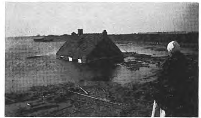
In de hoek Zuiddijk—Grote Dijk te Gawege.