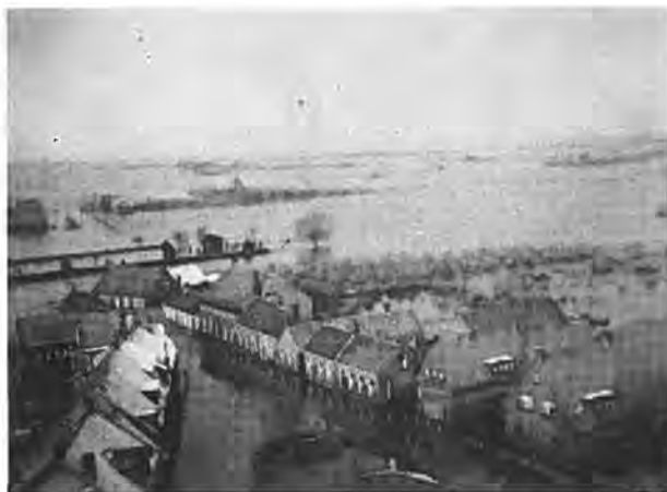
Gezicht over Waarde vanaf de toren.