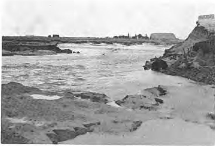
Bij Bath.

tersen werd na enkele dagen de heer C. van Gorsel Wz. aan het polderbestuur toegevoegd. Ook de mensen van de waterstaat zagen de toestand somber in en Ir L. O. Croes, die zich op de hoogte kwam stellen, was al spoedig van mening, dat, om verdere uitschuring door de ebstroom te voorkomen en het gat met succes te dichten, het noodzakelijk was, een groot gedeelte van de polder door een nooddijk af te sluiten, om zo de ebstroom minder hevig te doen zijn. Wanneer er volgens zijn plan een 800 ha kon worden afgesloten, vloeide er bij ieder tij veel minder