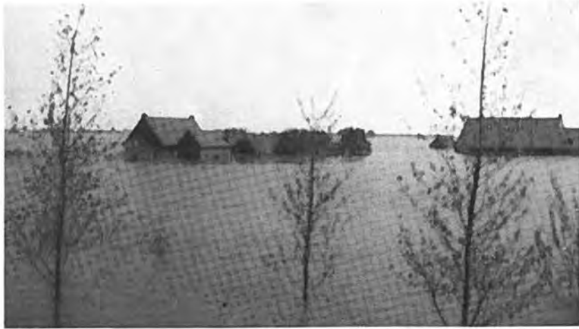
Gezicht vanaf de Zanddijk.