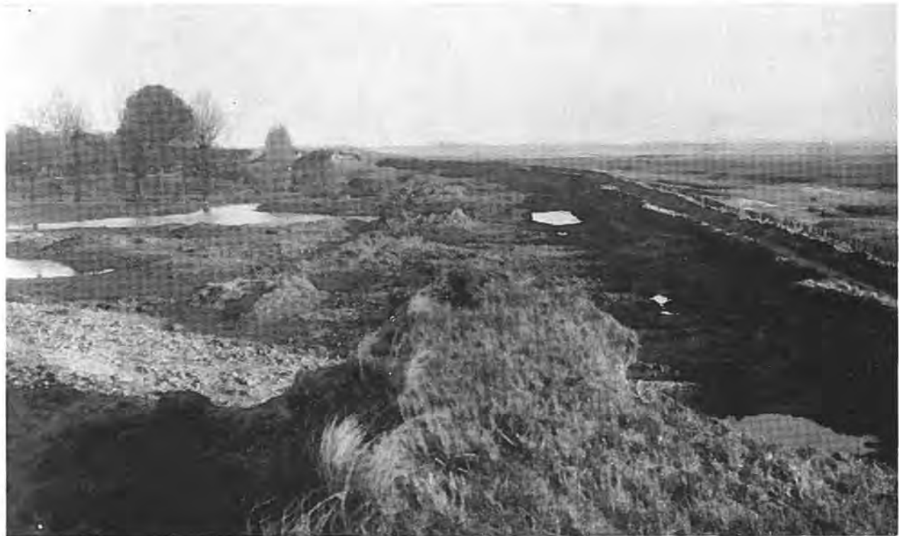
Weggeslagen zeedijk Zimmermanpolder te Rilland; alleen de voet van de dijk staat hier nog.

Honderden vragen bestormden ons, toen wij daar