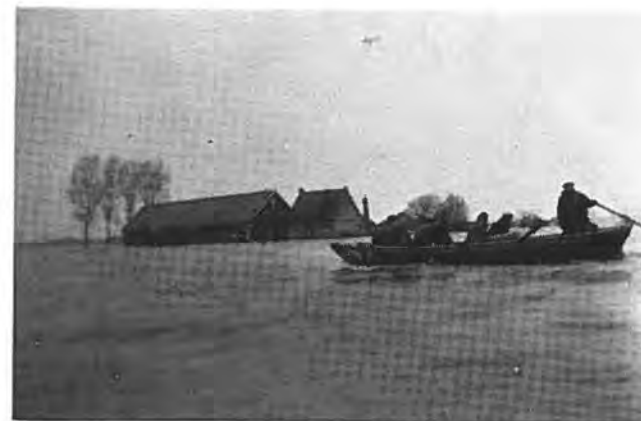
Tegen wind en stroom naar Waarde.