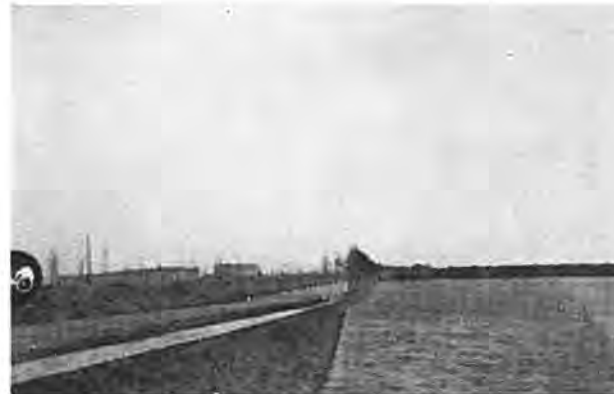
Rijksweg naar Rilland, Langendijk.