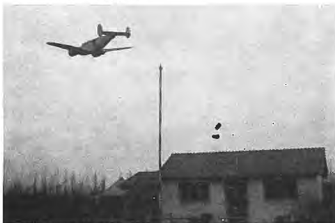
Een zandzakdropping op het sportveld te Krabbendijke.