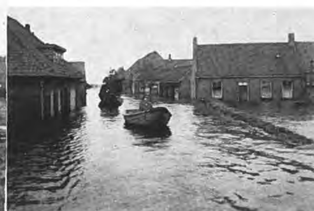
Door de stra'ten van Waarde.