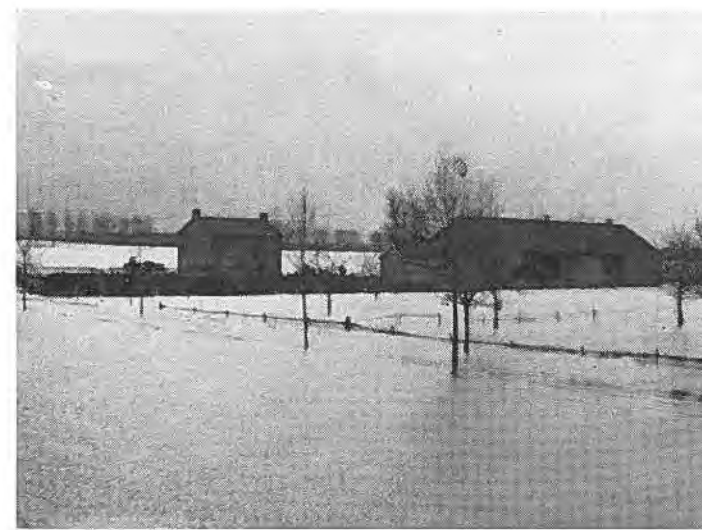
Landbouwbedrijf Boot te Rilland.