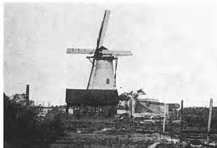
De Molendreef te Rilland. — Foto Kakebecke.