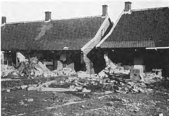
Ravage te Rilland.

hun Koningin, eenvoudig gekleed, de voeten gestoken in waterlaarzen, langs een ongeverfde trap uit de trein stijgen, waarna Zij door de Commissaris der Koningin werd begroet. Deze stelde verschillende personen aan H.M. voor, o.a. de hoofdingenieur van de waterstaat, de heer Heyblom.