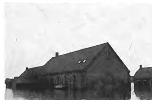
Kerkgebouw der Gereformeerde Gemeente Waarde.

dat met de pomp geen water meer geloosd kan worden. De volgende dag is de situatie niet zo gunstig. De duiker tussen de polder Waarde en de Westveerpolder laat water door, waardoor dus voor laatstgenoemde polder weer gevaar ontstaat. In allerijl worden noodvoorzieningen getroffen. 8 April wordt begonnen met het aanbrengen van een damwand. Op 17 April zijn de herstelwerkzaamheden aan de duiker klaar. Op 5 April wordt het pompen in de Westveerpolder weer hervat, terwijl op 16 April de polder zover droog is, dat het pompen kan worden gestaakt. Maandag 20 April wordt begonnen met het inzaaien van de polder. De C-cijfers schommelen dan