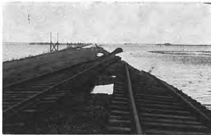
Weggeslagen spoorlijn bij hoeve van Mescu, Oostdijk.