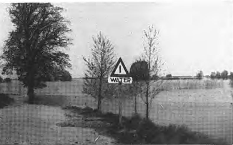
Kruiningen. „De Lindeboom” en een nieuw verkeersbord.

Bijna allen waren vertrokken uit Kruiningen. Zij, die wat hoger woonden en boven nog droog zaten, bleven nog wat. Zouden ze de ijdele hoop koesteren, dat de dijk in twee of drie dagen gedicht zou zijn? Als het 's avonds donker werd, zag men zo hier en daar een kaars branden. Het waren er echter niet veel. Die eerste dagen na de ramp was het zelfs angstig stil in het dorp. Het water klotste tegen de muren en ook in de kamers. Zo af en toe beukte een balk tegen de buitendeur. Een hond jankte om zijn baas. De meeuwen krijsten. Wat zal men nog doen in deze verlatenheid? Kranten waren er niet; wat hebben we die gemist. Van de buitenwereld wisten we niet veel. Nee, we gingen niet gerust slapen. De wekker moest weer op tijd aflopen, je kon immers nooit weten. Maar alles verliep normaal. De storm was bedaard en we voelden ons bijna veilig. Wat een geluk was het ook, dat de waterleiding nog intact was. De dingen van waarde, die je nog uit het slib opdiepte, kon je afspoelen met zoet water. Op die manier was het nog mogelijk verschillende dingen voor verder bederf te vrijwaren.