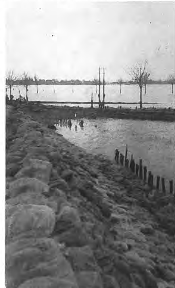
Met grote hoeveelheden zandzakken wordt de Nieuwlandse-binnendijk versterkt.

Het water kwam onderwijl steeds meer op en stond weldra zo hoog tegen de havendijk, dat de golven er regelmatig overheen sloegen. Dit had tot gevolg, dat op een drietal plaatsen de dijktop werd weggespoeld, waardoor een zeer gevaarlijke situatie voor de Oostpolder ontstond. Het is, menselijkerwijs gesproken, voor een belangrijk deel aan het moedig en vastberaden optreden van de bewoners van Roelshoek, onder leiding van de havenmeester, te danken, dat de Oostpolder en daardoor Krabbendijke behouden is gebleven. Onder zeer ongunstige weersomstandigheden, met steeds over hen heen stortend zeewater, hebben deze mensen, waaronder een aantal leerlingen