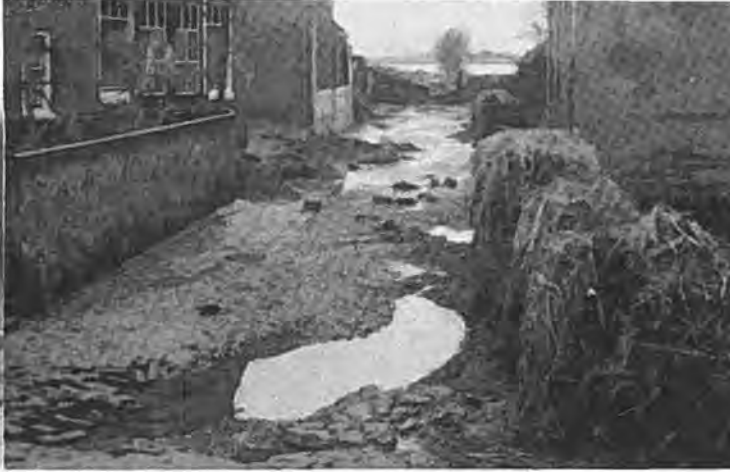
Oostdijk. Geheel links in dit straatje stond het huis van de omgekomen slachtoffers, B. Verschuure en z'n zuster Jacoba.