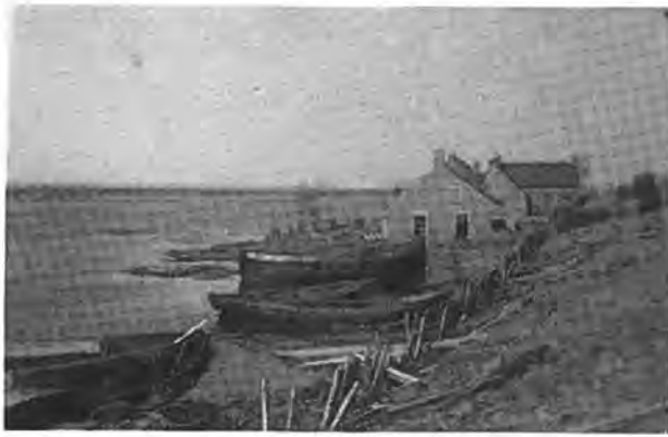
Gawege. Aanlegplaats „veerboot“ Gawewe—Waarde.