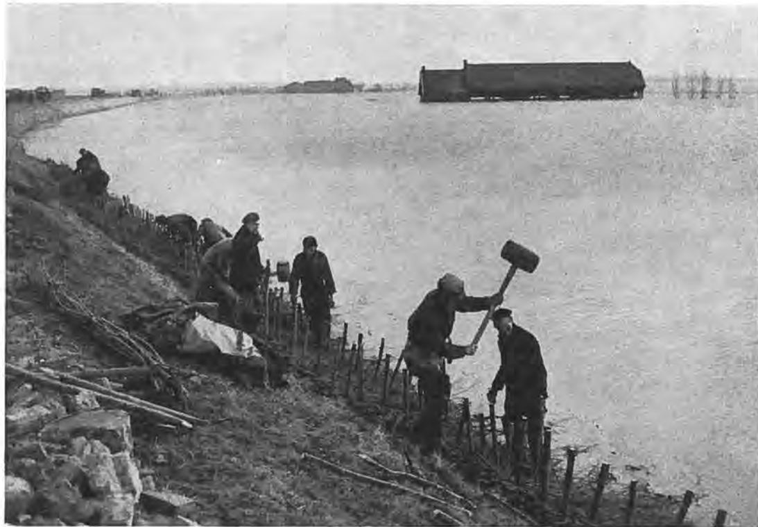
De verdediging van de Nieuwlandse-binnendijk, waarvan de toestand voor Krabbendijke dikwijls zeer kritiek was.

haard verdreven bevolking zo'n nauw aaneengesloten gemeenschap vormde.