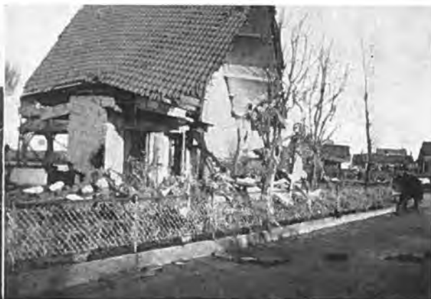
Het huis van N. Minnaard te Oostdijk: is thans geheel weg.