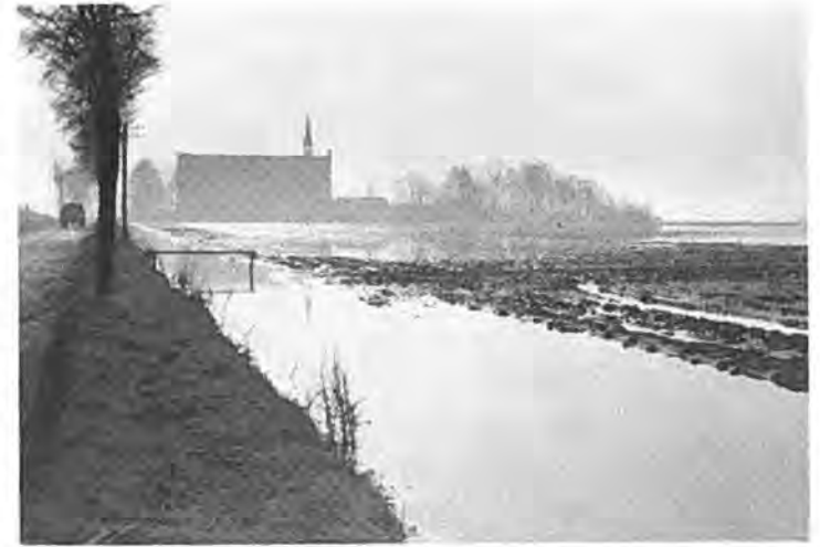
Hoofdweg te Rilland.

Daar er overal zo ontzaglijk veel aan de dijken te doen viel, was er geen sprake van, dat de waterstaat op de gewone wijze de werken kon aanbesteden, dus moesten deze in regie worden uitgevoerd, d.w.z. dat de aannemers tegen een bepaald percentage van de totale kosten werkten. De combinatie D. Verstoep — v. d. Breejen Bout — Bos & Kalis kreeg opdracht het werk aan de dijken van de Reygersbergse polder en Zimmermanpolder uit te voeren, terwijl aan de firma