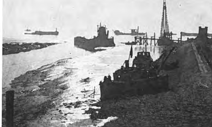
De perszuiger komt bij Bath.