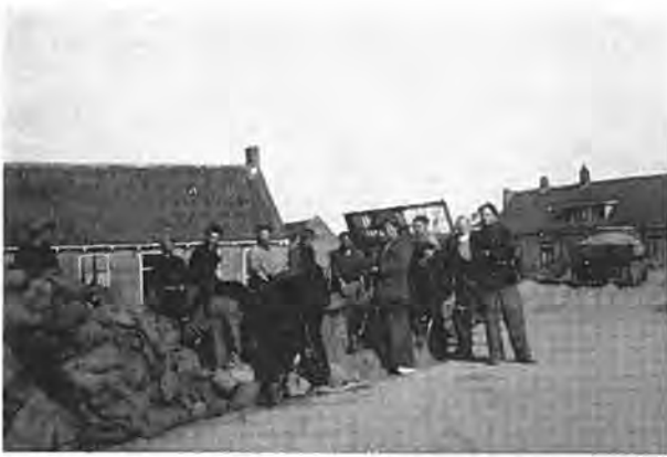
Arbeiders vullen zandzakken voor verdediging van de Lavendeldijk.

worden. De Lavendeldijk was hiervan het afschrikwekkend voorbeeld. In dat geval was het met Krabbendijke gedaan, want de nu nog overgebleven 2,70 meter hoge Lapdijk, waartegen het water op sommige plaatsen 1 à 1,50 meter hoog stond, kwam als waterkering niet in aanmerking.