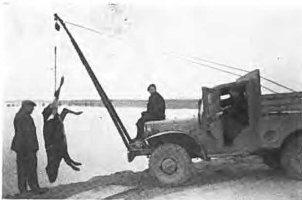
Verdronken vee wordt uit het water gehaald.

daarvan het een en ander weer te geven. Zo zagen we reeds, dat bij de Havendijk het eerste offensief, of beter defensief, werd ingezet. Bestond dit aanvankelijk slechts in het dichten van de ernstigste gaten in de dijkkruin, later op de dag werd dit werk met de inmiddels toegestroomde arbeidskrachten uit Krabbendijke voortgezet en reeds op dezelfde dag voor een belangrijk gedeelte — zij het provisorisch — voltooid. Een ander object, dat terstond massaal werd aangepakt, was het stoppen van de duiker in de Nieuwlandse-binnendijk. Deze duiker was normaal niet dicht te krijgen, waardoor er veel water in de Nieuwlandepolder liep. Met man en macht werd de duiker-ingang met zandzakken dichtgegooid. Ofschoon dit wel enig resultaat opleverde, gelukte het toch niet deze duiker geheel waterdicht te krijgen. Het is steeds een zorgkind gebleven.