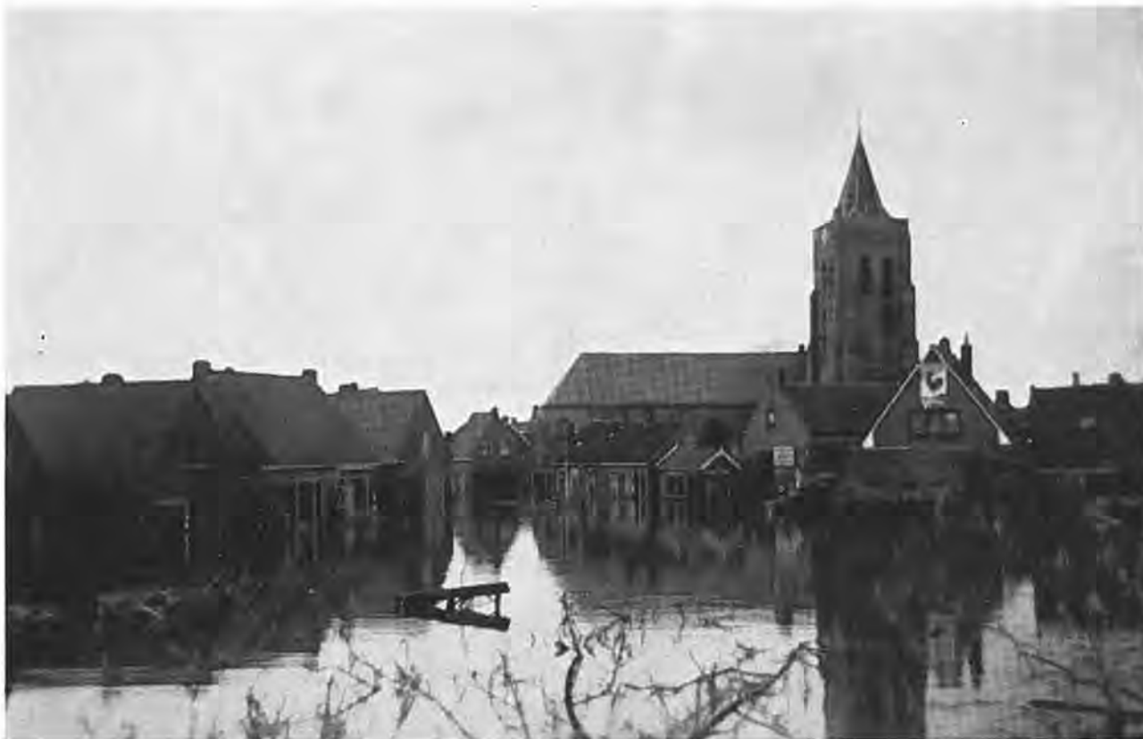
Een triest beeld van Waarde.