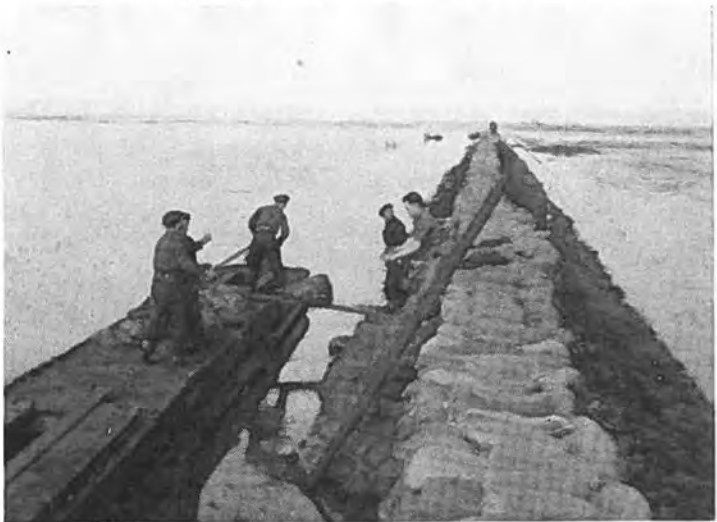
Militaire hulp aanleg nooddijk te Rilland.