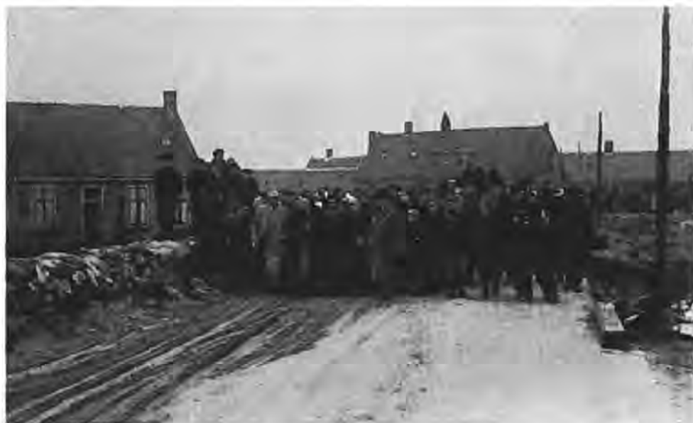
De Koningin op de Lavendeldijk — Foto Blok.

Zo groot werd de ontevredenheid, dat aanvankelijk enkelen en later meerderen hun geëvacueerde gezinsleden clandestien gingen terughalen. De vindingrijkheid bij deze „vrouwen- en kinderensmokkel” was opmerkelijk. Verborgten achter stapels kisten, dekzeilen, of als mannen verkleed gelukte het velen de postende politiemannen te verschalken.