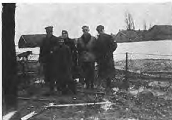
Gezicht op Gawege.

Reeds spoedig presenteerde zich een Leger des Heilsafdeling uit Hilversum aan het waterfront en bood belangeloos haar diensten aan. Deze bestonden voor de mannelijke leden in het tweemaal per dag uitdelen van warme koffie aan de dijkwerkers en voor de vrouwelijke leden in het verrichten van naai- en stopwerk en het behandelen van de was tijdens de evacuatie-periode. Voortreffelijk werk is daarmee gedaan. Door het fit houden van de dijkwerkers met het opwekkend vocht en door het hen ontlasten van huishoudelijke besommeringen heeft het Leger des Heils daadwerkelijk deelgenomen aan de strijd tegen het water en maakt het evenveel aanspraak op onze waardering als elke andere vorm van hulpverlening. Ook hebben deze heilssoldaten — die gehuisvest werden in het kweekschoolinternaat aan de Noordweg —