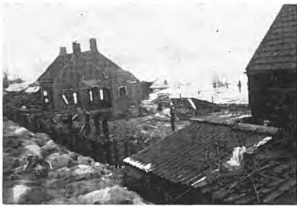
Verwoesting op Gawege.