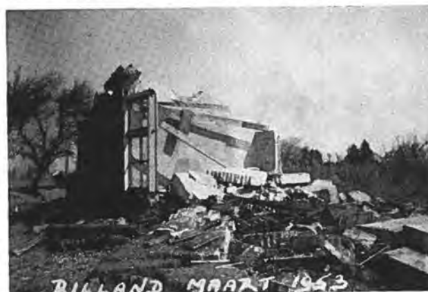
Een totaal verwoest huis in Rilland.