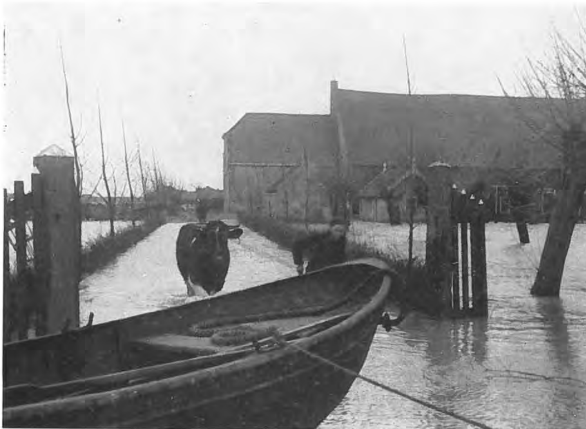
Het geredde vee wordt in allerijl in veiligheid gebracht.

zoek uit te gaan, dwarrelen allerlei gedachten door ons brein, maar de gedachte aan het doorbreken van de dijken laat ons niet los. En wanneer we dan eenmaal buiten zijn en hoegenaamd geen sterveling op straat tegenkomen en ook geen water zien op de straat of in de tuin, die wat lager ligt, begeven we ons naar de Rijksweg, om daar de sloten te controleren. We zijn ook dan nog niet verontrust, het zal zo'n vaart niet lopen. Er heeft immers al meer water in de polder gestaan. Het zou de eerste keer niet zijn, maar een catastrofe, neen, daar rekenen we niet op. Het blijft rustig, heel rustig in het dorp. Men rookt een sigaretje en vraagt aan een enkele fietser, wat er eigenlijk aan de hand is. Eindelijk krijgen we te horen, dat er een gat in de dijk is en dat van dichtmaken voorlopig heel weinig kan komen. Op de vraag, of er veel water in het dorp zal komen, weet niemand het juiste antwoord. Och, het zal vermoedelijk wel meevallen.