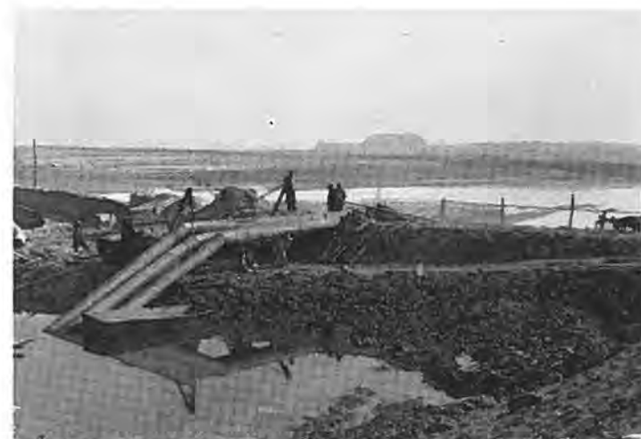
Hevels te Rilland.

De zon straalde aan een wolkeloze hemel. Een frisse