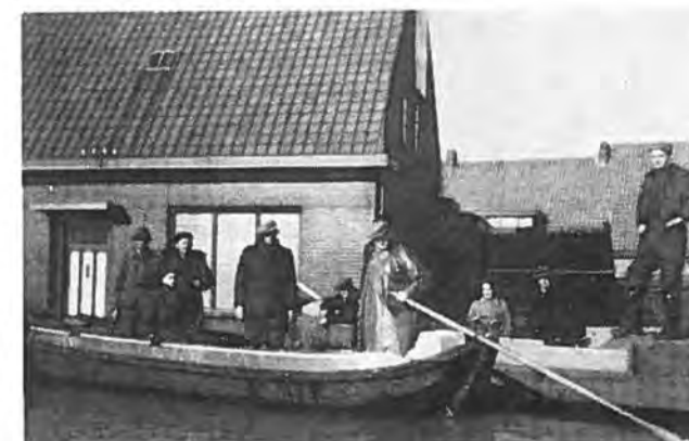
Per boot door het dorp Waarde.

Maar ondanks alle ellende ontbreekt toch de humor niet. Ergens staat een varkenshok; het water heeft een tweede er bovenop gestapeld... Een hark hangt netjes in een telefoonpaal. Een petroleumkarretje heeft een hele reis gemaakt en is uiteindelijk in een boom terecht gekomen. In een woning broeden duiven op een kabinet. In een ander huis troont een rat op de in het water staande naaimachine. En zo zijn deze feiten met tientallen te vermeerderen.