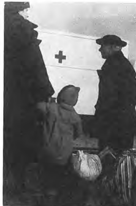
Evacuatie van inwoners van Krabbendijke.

dijke zeer kritiek achtten, terwijl ook de Commissaris der Koningin, die terzake geraadpleegd was, evacuatie van genoemde bevolkingsgroepen raadzaam vond. Hoewel de desbetreffende publicatie eerst bij het aanbreeken van de dag in de gemeente werd verspreid, was reeds een groot gedeelte van de bevolking op de evacuatie voorbereid. De zorgwekkende toestand, waarin Krabbendijke reeds vanaf het begin van de ramp had verkeerd, was oorzaak, dat velen met de mogelijkheid van overstroming en van de daarop volgende vlucht rekening hadden gehouden. Zo waren overal de benedenverdiepingen der woningen ont ruimd en had vrijwel ieder een vlucht koffer in gereedheid gebracht. Er kan dan ook niet worden gezegd, dat het bericht van de evacuatie afkwam als een donderslag bij heldere hemel. Veeleer betekende het voor velen, vooral de min of meer hulpbehoevenden, het einde van een martelende onzekerheid. Hadden niet verscheidene inwoners hun kinderen of hulpbe-