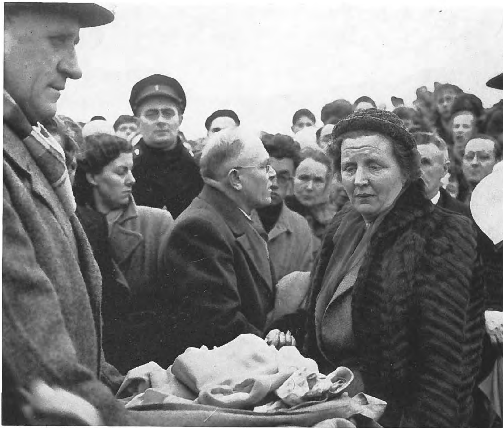
Allerwege droefheid tijdens het onderhoud van H.M. de Koningin