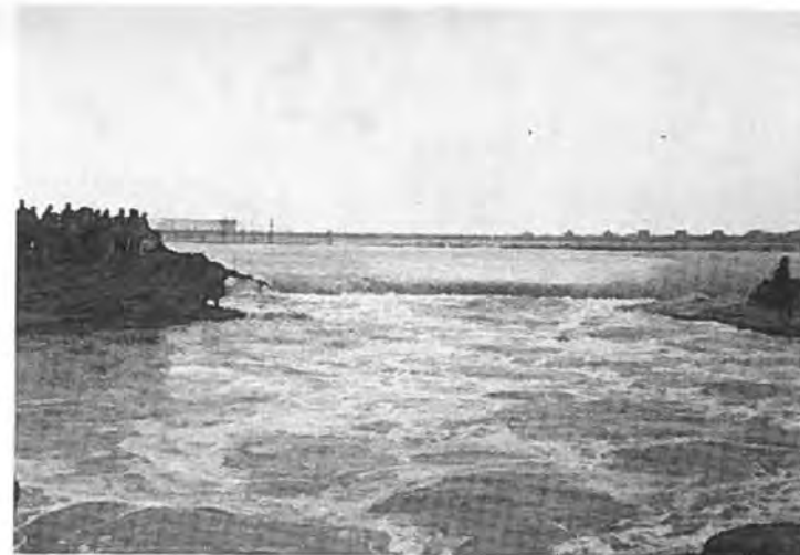
Het gat bij de Vierde Weg. Deze foto geeft een duidelijk beeld van de harde strijd om de dichtmaking van dit gat.