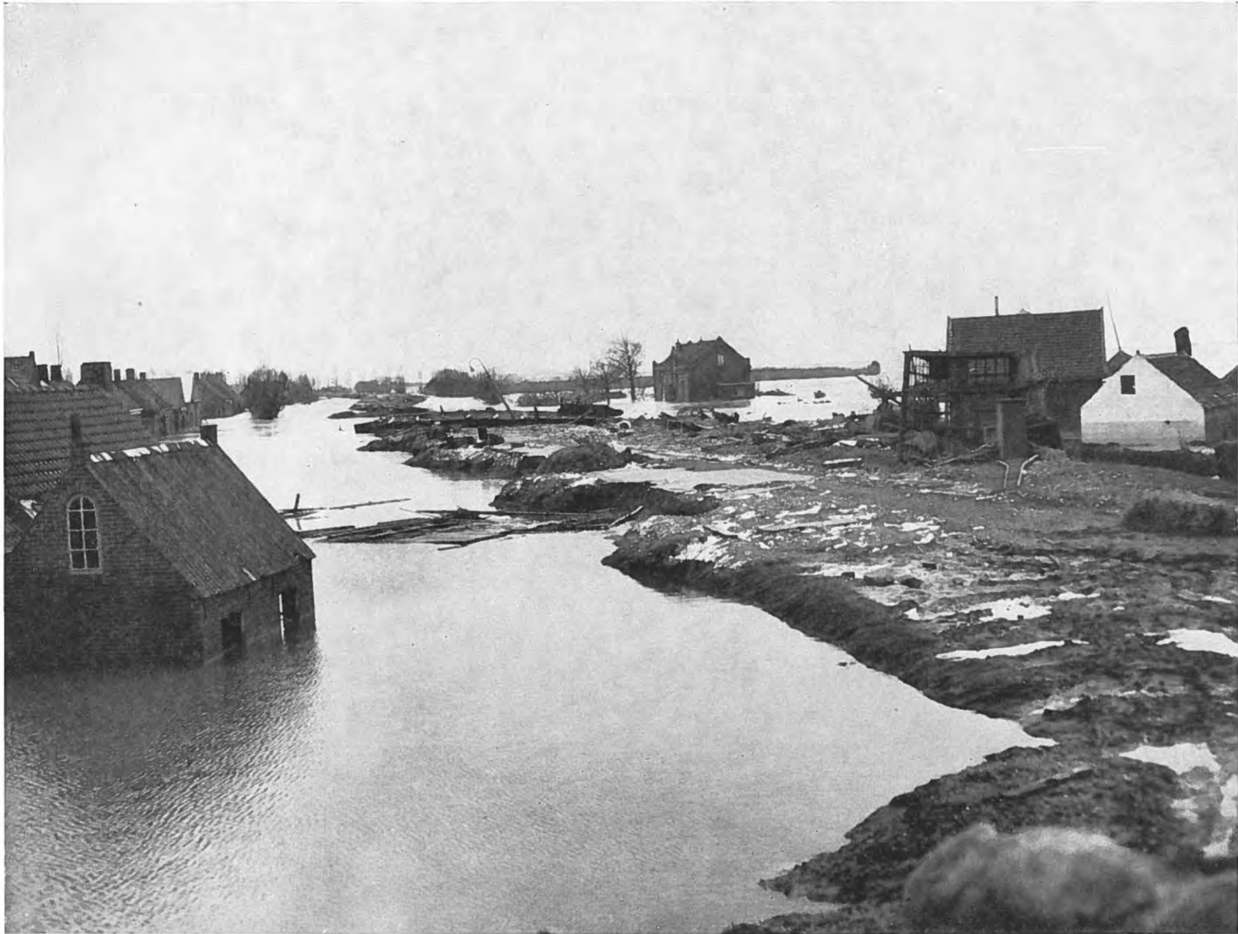
De Lavendeldijk te Oostdijk. Dwars over de dijk een stuk van de aanlegsteiger van de Veerhaven.