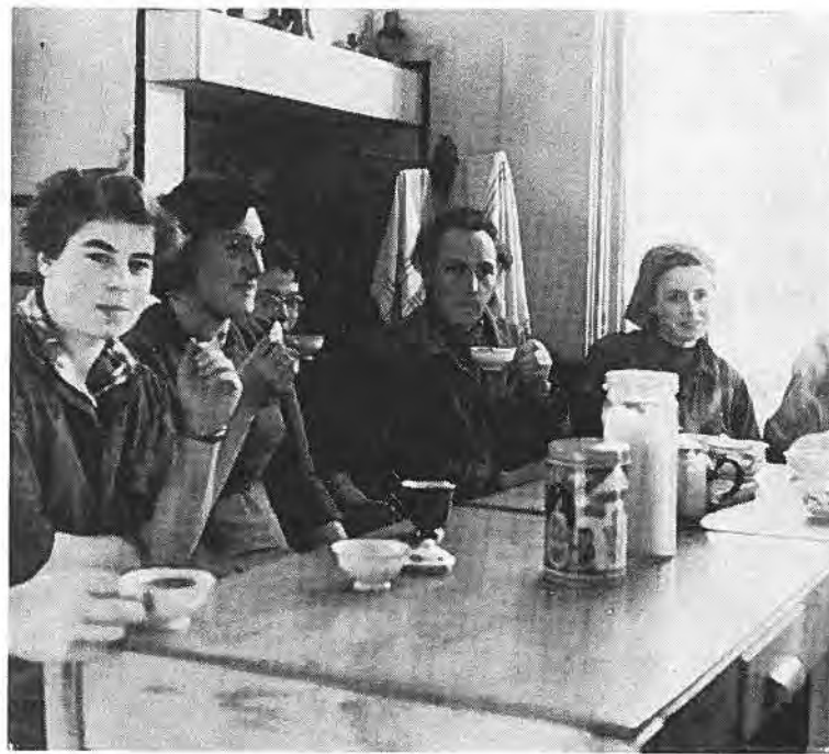
Belgische schoonmaakploeg te Rilland-Bath.