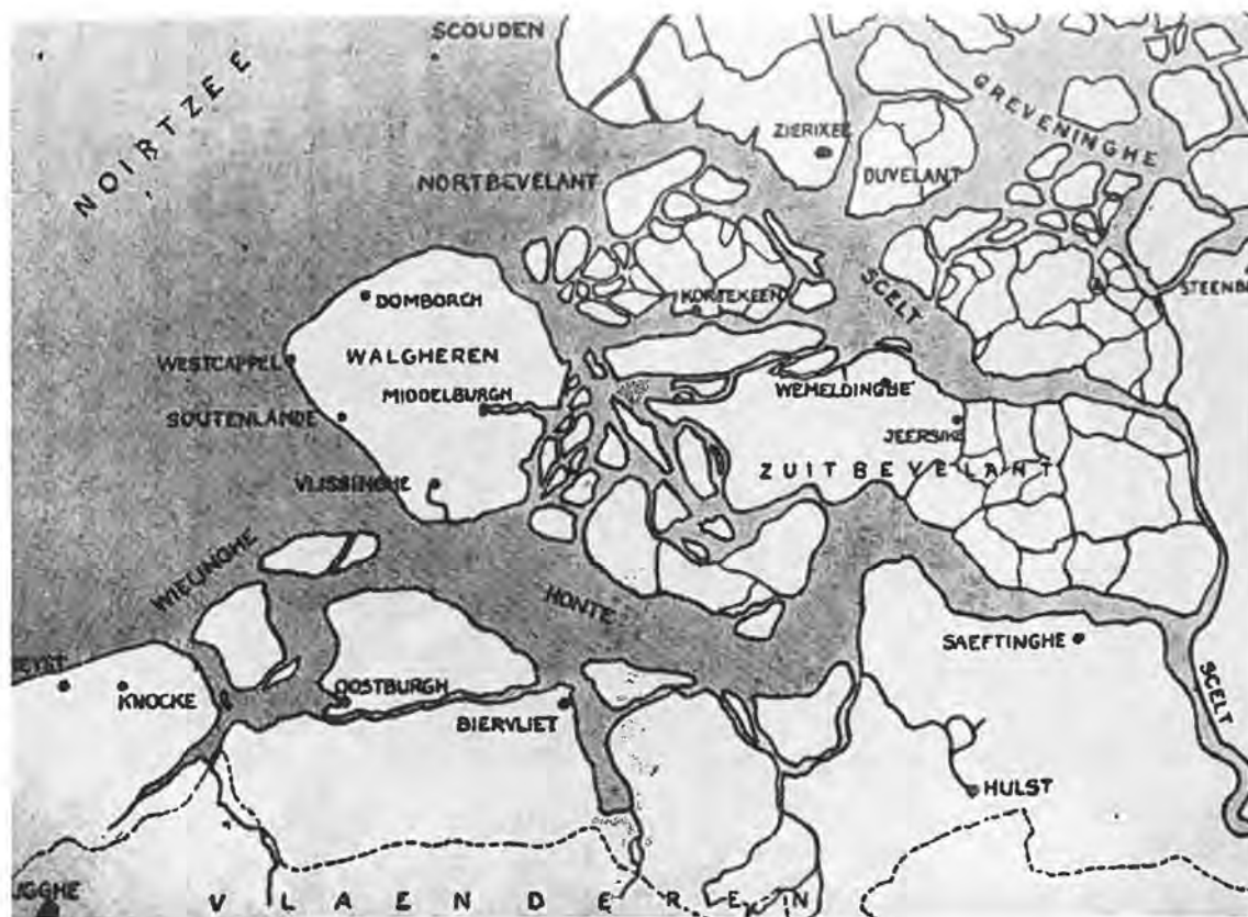
Zeeland in vroeger eeuwen.