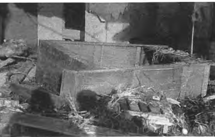
Wat eens een woonkamer was te Gawege...