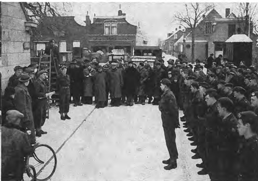
Een andere opname van de plechtigheid op de „herdoopte” Zuidweg.