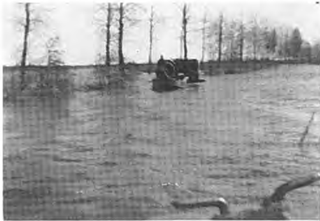
Per boot over de Rijksweg tussen Bolwerk en Luchtenburg.