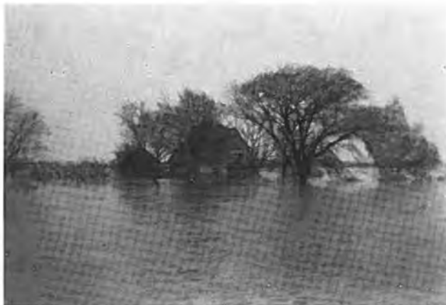
Buitenplaats te Waarde.

Want al is het aantal directe slachtoffers beperkt gebleven tot één, het aantal van hen, die indirect aan de gevolgen van de ramp stierven, o.a. door opgedane ziekten bij de evacuatie, is groter. Maken wij verder de balans op, dan kan nog worden vermeld, dat van de 274 woningen er zeven totaal zijn verwoest en negen zwaar beschadigd. Bijna alle andere woningen hebben in meerdere of mindere mate scha-