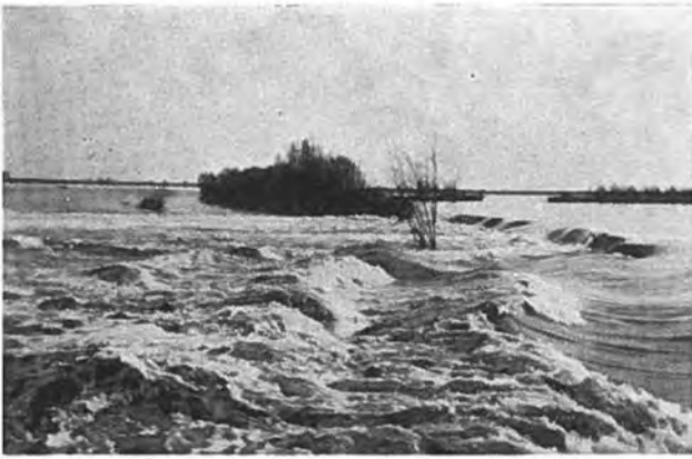
Wat de stroom deed. — Foto van Fraassen.

de opgelopen, want slechts drie woningen hebben geen waterschade gekregen. Daarbij komt nog de schade aan vee, want er verdronken o.a. 58 stuks rundvee en 4 paarden, d.i. respectievelijk circa 18 en 4 pct. Zo zijn we dan aan het slot van dit relaas gekomen.