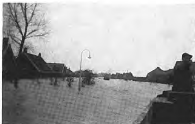
Hoe hoog het water op de Kerkweg stond.