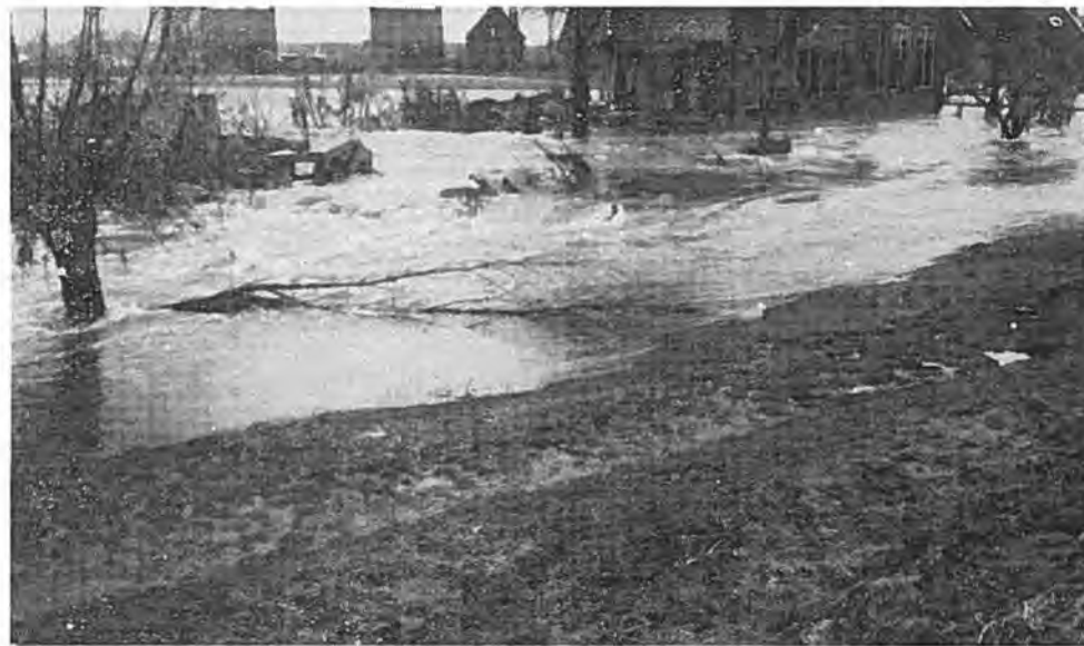
De stroomversnelling door het gat in de Lavendeldijk