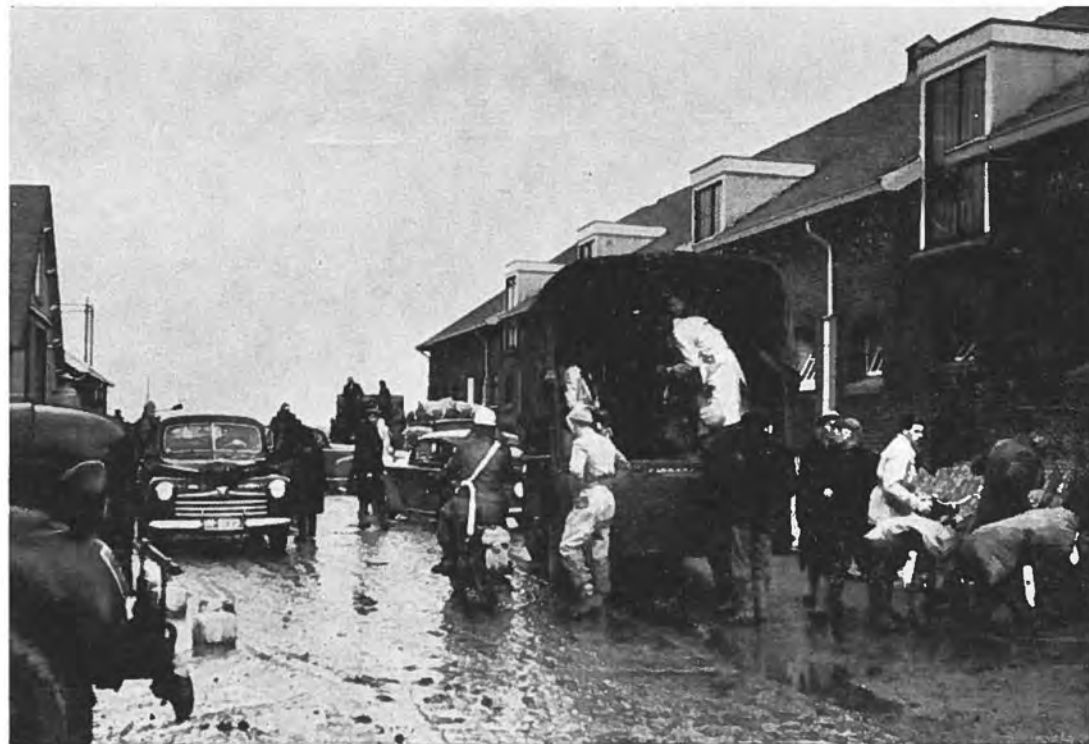
Transport van evacués via hoeve „Westhof“ te Rilland