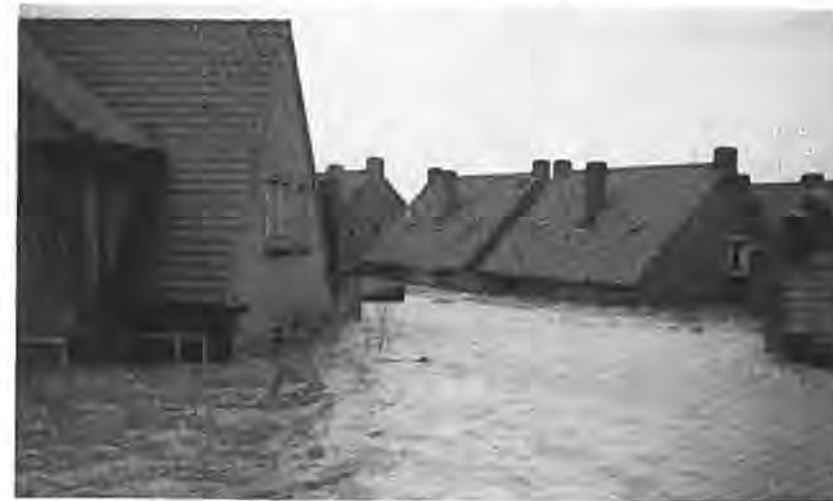
Achterzijde Slotstraat te Kruijningen.

De vloed, die nu volgde, was belangrijk lager. Onze slaapkamers bleven dan ook droog. Dit was een hele geruststelling, hoewel we wisten, dat nog veel mensen in nood zaten en zonder eten of drinken, van kou verkleumend . . . Vooral de bewoners van Eindje de Rondte, Slotstraat, Schoolstraat, Berghoekweg en die