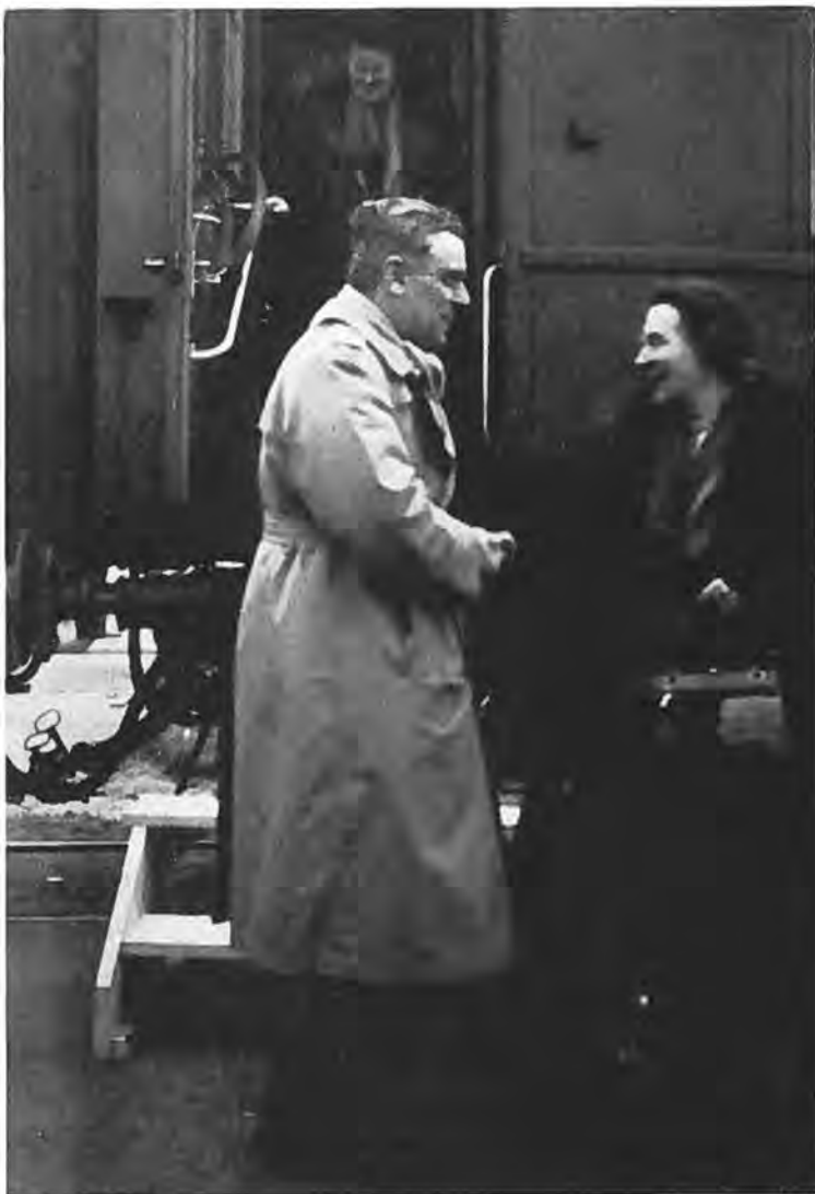
De Commissaris der Koningin in Zeeland verwelkomt H.M. de Koningin bij Haar aankomst in Rilland.

Was het een troosteloos gezicht, het dorp onder water te zien staan, veel erger nog was de aanblik, toen alles drooggevalen was. Overal een laag vieze zwarte modder, overal kapotte, waardeloze meubelen. Wat eens de trots van zovele zuinige huismoeders was, was nu een armzalig, waardeloos rommeltje gewor-