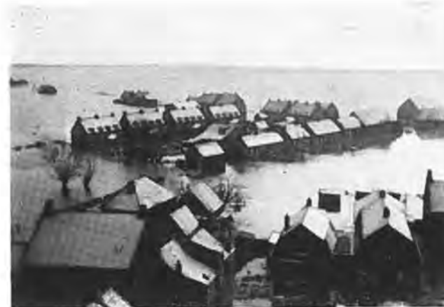
Huizen in water en sneeuw in de eerste dagen van de ramp — Foto van Fraassen.

Hier mag wel eens gewezen worden op een lichtpunt, dat er toch, ondanks alle ellende, nog is en dat is, dat Waarde pas Zondagnamiddag is overstroomd; anders zou het aantal slachtoffers veel groter zijn. Merkwaardig is, dat bij deze vloed de Kadijk het eerst is doorgebroken en een kreek wordt gevormd juist op de plaats, waar de Hinkelinge eeuwen geleden werd afgedamd. Het water heeft hier dus zijn oude loop hernomen.