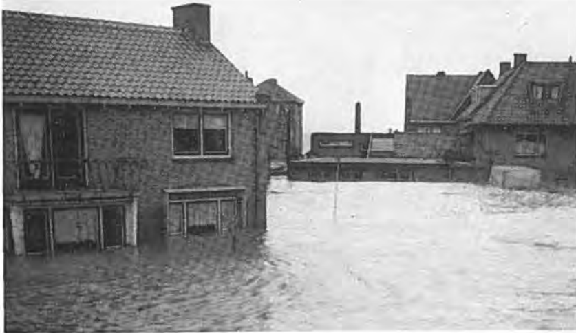
Hoek Burg. Elenbaasstraat en Slotstraat.