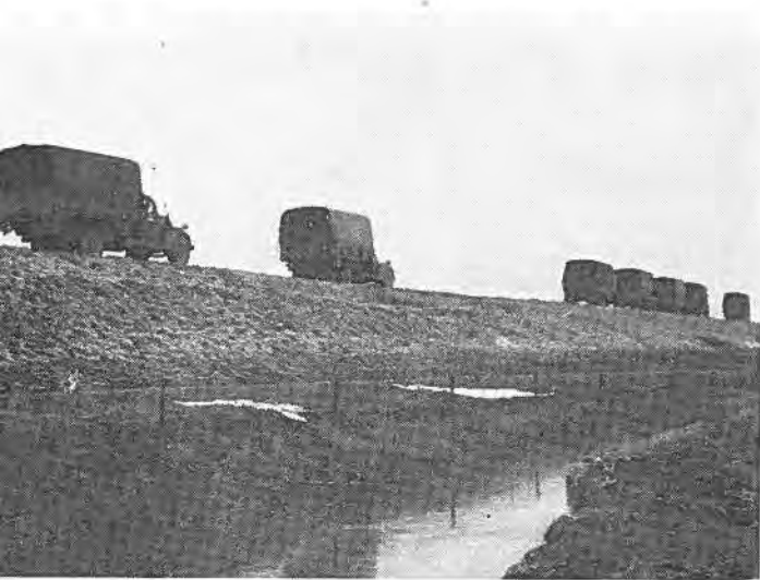
Het inrukken der hulptroepen te Bath.