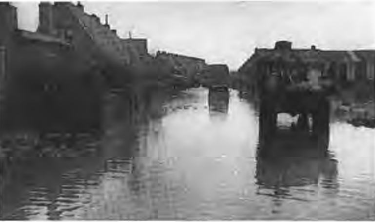
Kruijningen. Evacuatie Berghoekstraat.

obstakels maakten hun werk dubbel zwaar. Maar ophouden deden ze niet. Mensenlevens waren immers in gevaar, geen minuut mocht verloren gaan.