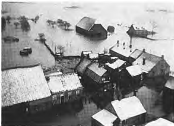
Met sneeuw bedekte woonhuizen in het water te Waarde.

heid gebracht. Op het gemeentehuis is op die tijd het belangrijkste reeds naar de zolder verplaatst.