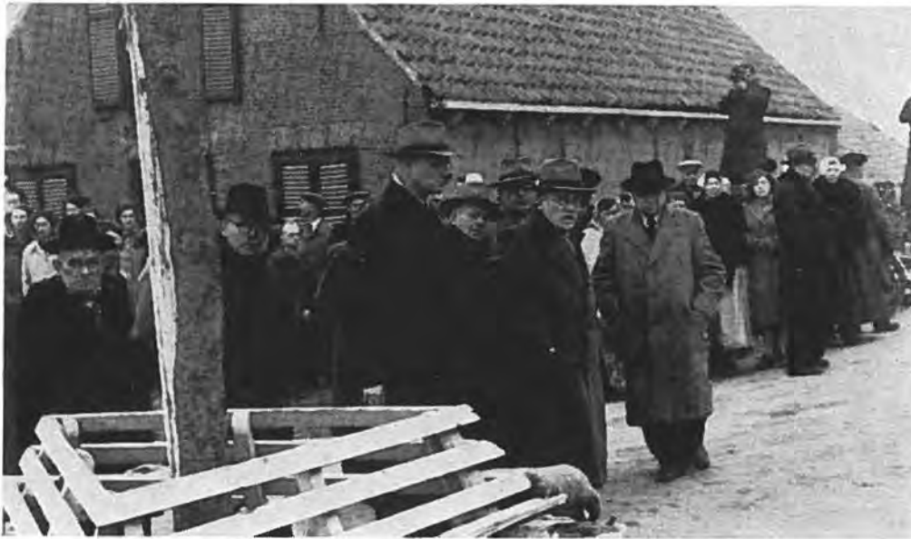
Oostdijk: In afwachting van de aankomst van H.M. de Koningin