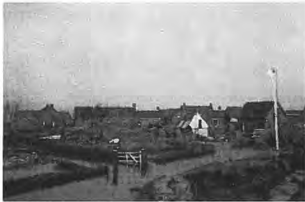
Oostdijk. Wat er overbleef.