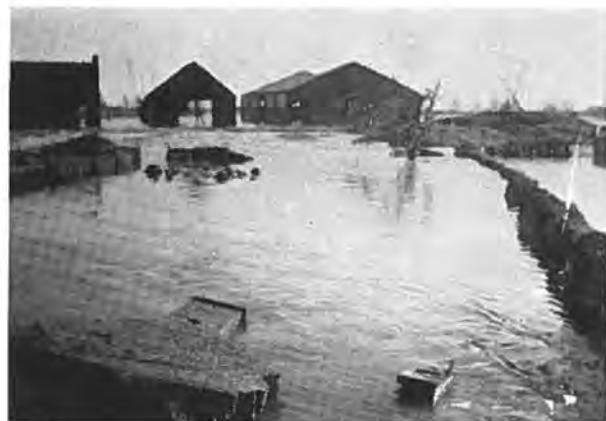
Oostdijk: Op de voorgrond links de eindgevel van het huis van de omgekomen wed. Minnaar-Pouwer.