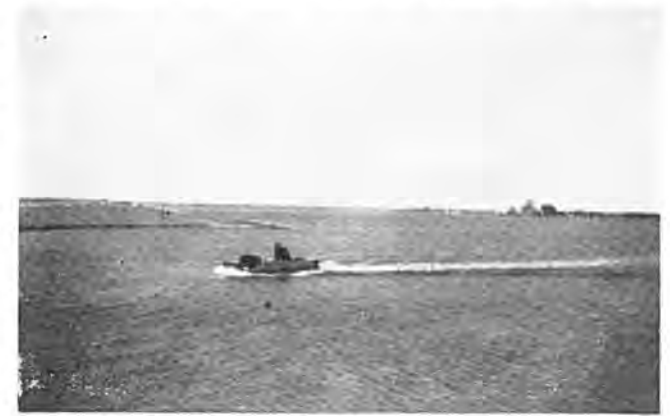
Per motorboot door de Reygersbergse polder.

Vrijdag 13 Februari werd een begin gemaakt met het leggen van een nooddijk over de Vierde Weg, dus