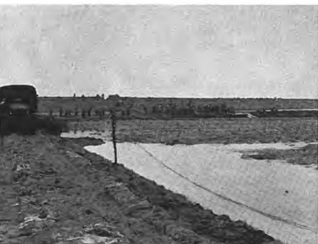
Aanleg van de nooddijk te Rilland.