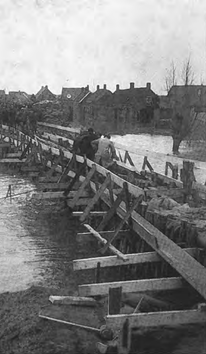
De dichting van het grote gat in de Lavendeldijk. Tussen een dubbele rij palen worden zandzakken gestort.