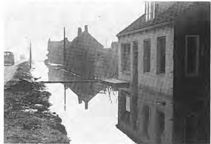
Stationsbuurt te Rilland.