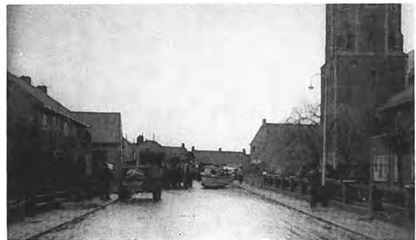
Evacuatie-drukte Kruiningen.

val ruist het water onder de deuren en spleten. Water, vies en ijskoud water. Maar je voelt het niet. De angst heeft je te pakken. Alle energie in de mens wordt wakker. Je vliegt en rent, je sjouwt en zweet en . . . bidt. Het water stijgt maar, het stijgt snel. Het weet van geen ophouden. De mens moet deze wedloop verliezen. We moeten ons haasten om zelf nog het vege lijf te redden en laten met bloedend hart de niet meer te redden meubels en kleding achter. Nog stijgt het water, de vloed is nog steeds niet op het hoogst. Daar zitten we dan, bovenaan de trap op de eerste verdieping met een kaars in de hand om te kijken hoe alle treden van de trap door het zeewater worden overspoeld.