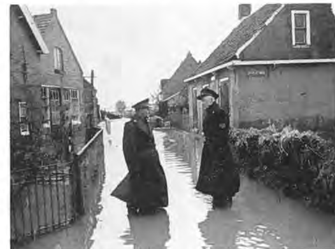
De Tweede Vlietweg te Oostdijk.