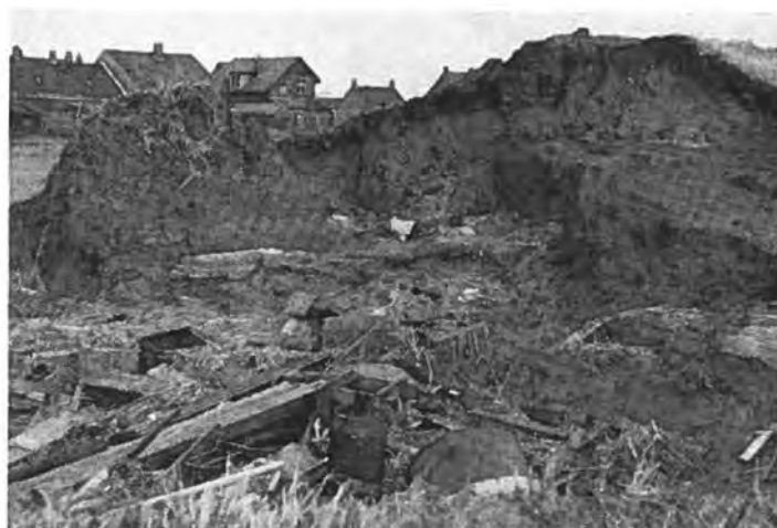
Zeedijk bij Bath.

De vrouwen rogen met ijver aan het werk. Hier en daar verschenen alweer heldere gordijntjes voor de ramen, wat een indruk van gezelligheid gaf, ook al