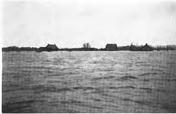
Gezicht op Waarde.