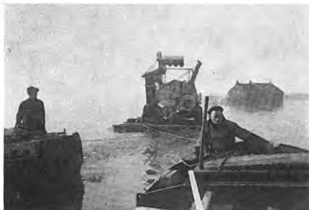
Een zware landbouwmachine op een vlot.