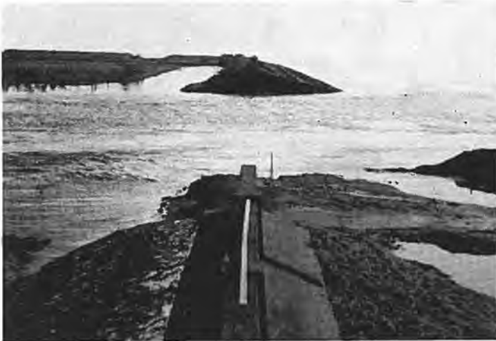
Het grote gat bij Bath.

kon op grotere schaal hulp geboden worden. Helaas kwam de vloed met hernieuwde kracht opzetten en de in hun huizen opgesloten mensen beleefden misschien de angstigste uren van hun leven. Hier en daar steeg het water tot meer dan twee en een halve meter. Meubels bonkten tegen het plafond, schuimende golven beukten de muren. De duisternis viel vroeg in en bij het licht van een