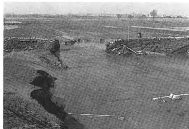
Het opengebleven gat door de Vierde Weg te Rilland.