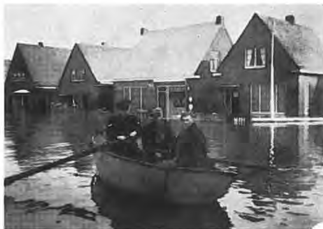
Met de politieboot door Waarde.