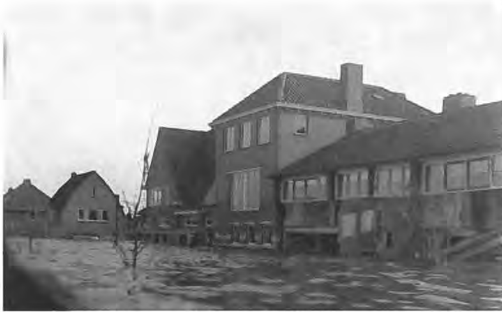
Woningen aan de Rijksweg — Foto Verschoore.