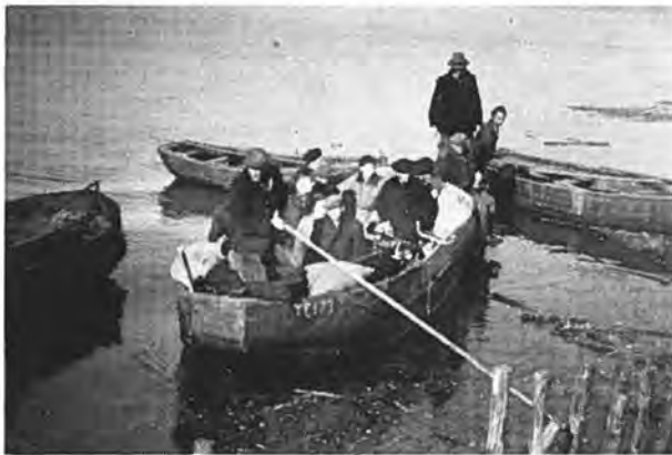
Landing van een boot met huisraad enz. aan de dijk te Gawewe — Foto Pieper.