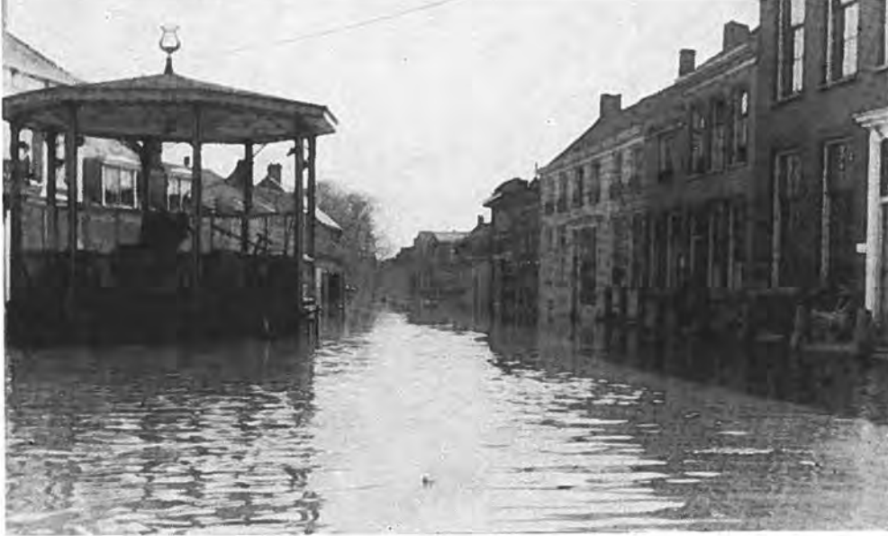
De Markt te Kruiningen onder water.