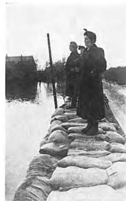
Met zandzakken versterkte Hoofdweg te Rilland.