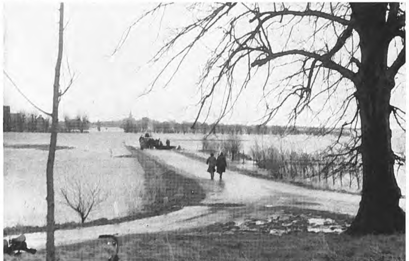
Bij laag tij was het mogelijk Kruiningen te bereiken.

Bij dit alles kwamen nog meer moeilijkheden, doordat