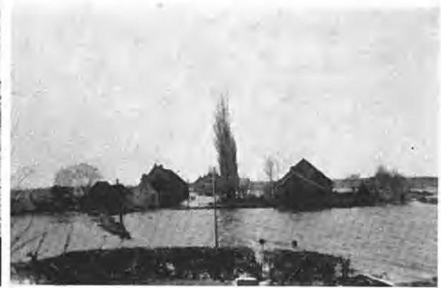
Gawege. Aanlegplaats „veerboot“ Gawege—Waarde.

dezelfde reden werd een uitgaansverbod — van nul tot vier uur — ingesteld.