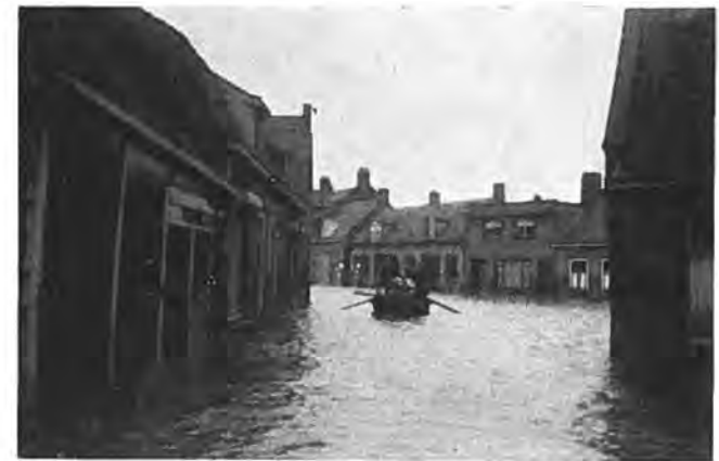
Zo voer men door het dorp Waarde!.

De 8e is het gat weer dicht. En dan gaat het snel in de goede richting. Op Maandag 20 April is het te herstellen gedeelte van de Kadijk dicht! Een ander gedeelte van deze dijk zal echter niet hersteld worden, daar de gaten daar zeer diep zijn. In plaats daarvan wordt een circa 400 meter lange nooddijk van stalen pontons gelegd van de te herstellen Kadijk naar de Rijksweg. Op en tegen deze pontons wordt klei aangebracht ter meerdere versteviging. Zondag 19 April komt deze dijk gereed. Het sluitgat zal op de Rijksweg bij de Lavendeldijk komen te liggen. Een aantal pijlers van zandzakken en een hoge