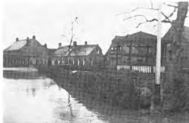
Dorpsstraat met muziktent — Foto van Fraassen.

loopbrug worden gebouwd. De twaalf gaten tussen deze pijlers zijn 20 m breed. Vóór de dichting van deze gaten moeten de Yersekse schippers proberen uit de binnensee te komen en ze verlenen op 21 April voor het laatst hun hulp.