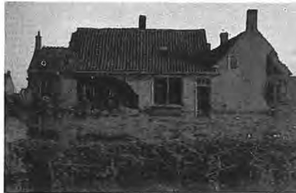
De Adriaan Butijnstraat te Rilland.

kaars of zaklantaarn volgde menigeeen met spanning de stand van het water. De traptreden werden geteld, men keek iedere vijf minuten, of het water nog niet minder treden bloot liet. Eindelijk begon het te vallen. Goddank, het ergste was voor vanavond voorbij. De storm nam in hevigheid af, de maan kwam van achter de wolken, kortom, de hele situatie werd wat minder angstwekkend. In de late avond slaagden militairen erin de bewoners van een paar boerderijen