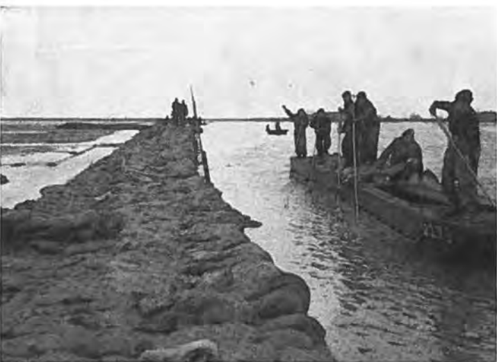
Aanleg van de nooddijk op de Vierde Weg te Rilland.