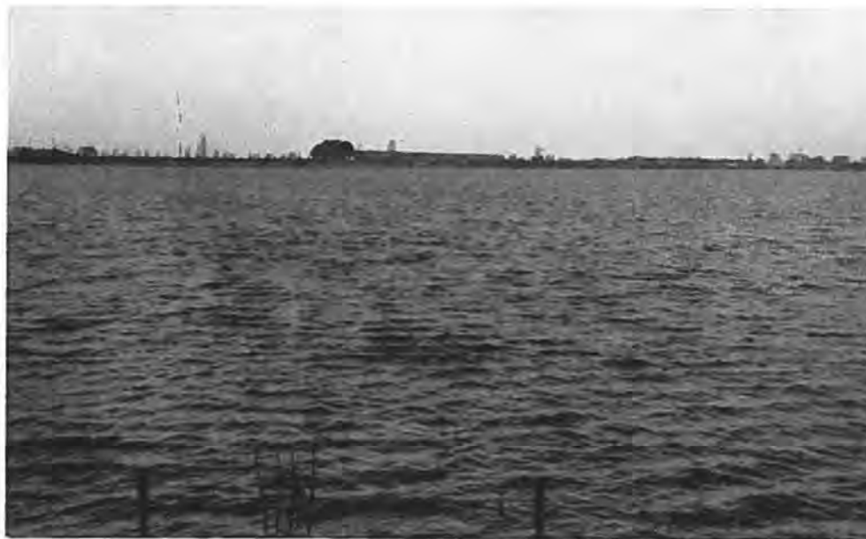
Gezicht op de Reigersbergerpolder te Rilland. —

In de week van 8 tot 14 Maart werden eindelijk de stoffelijke overschotten van de drie nog vermiste slachtoffers gevonden, eerst dat van Cysouw, drie dagen later dat van de burgemeester en weer twee dagen later dat van Jacoba van Zwienen-v. d. Maas. In diezelfde week begonnen de werkzaamheden aan het grote gat in Bath, dat honderd meter breed was, wat beter op te schieten en waagde men op de 11e Maart een aanval op het stroomgat tussen de nooddijk en de zeedijk. Driehonderd bietennetten, gevuld met zandzakken, werden in gereedheid gebracht. Tijdens laag water kwam de afsluiting tot stand. De soldaten van het regiment Limburgse Jagers, alsmede van het Oranje-Gelderland regiment, hadden prachtig geholpen deze overwinning te bevechten. Voldaan