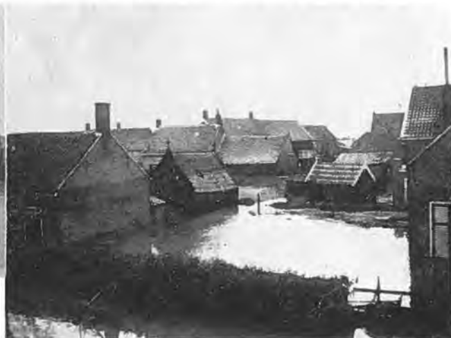
Huizen te Oostdijk.