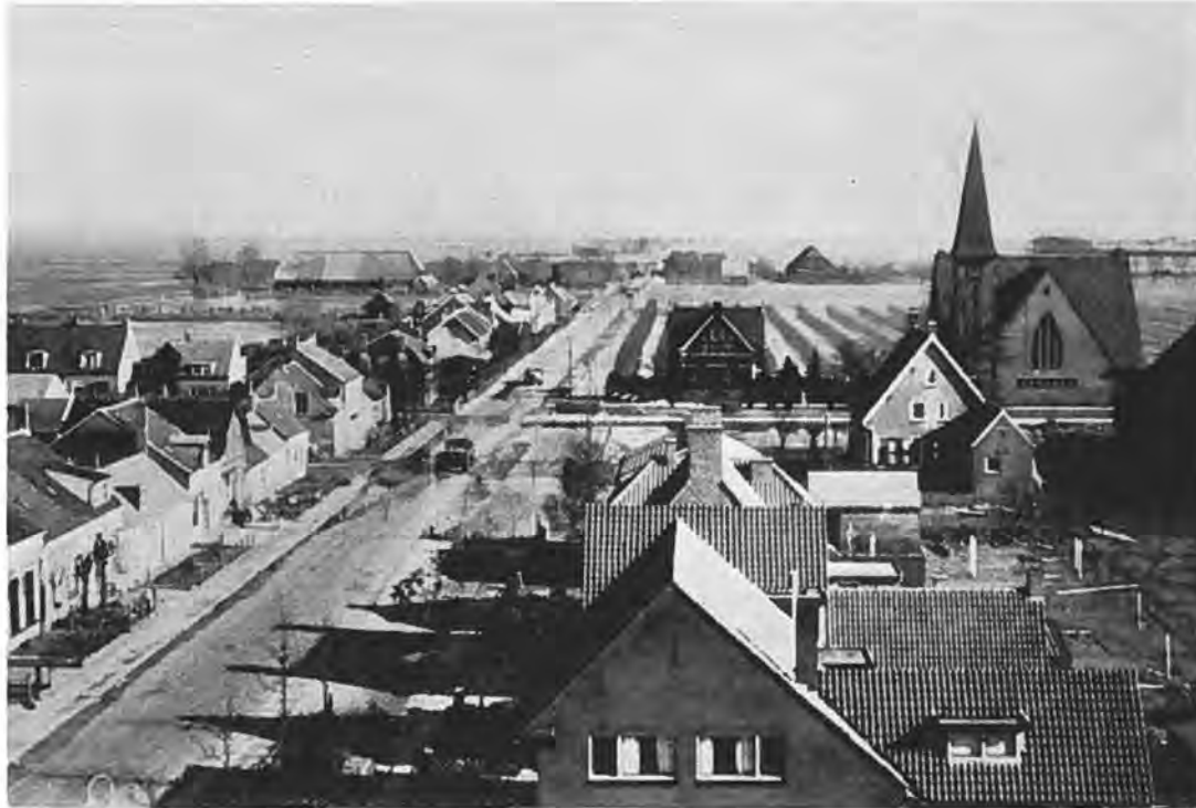
Eenzaam en verlaten. Rilland-Bath bij laag tij.