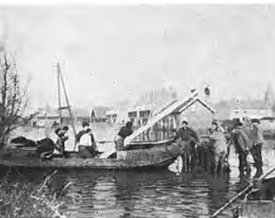
van huisraad