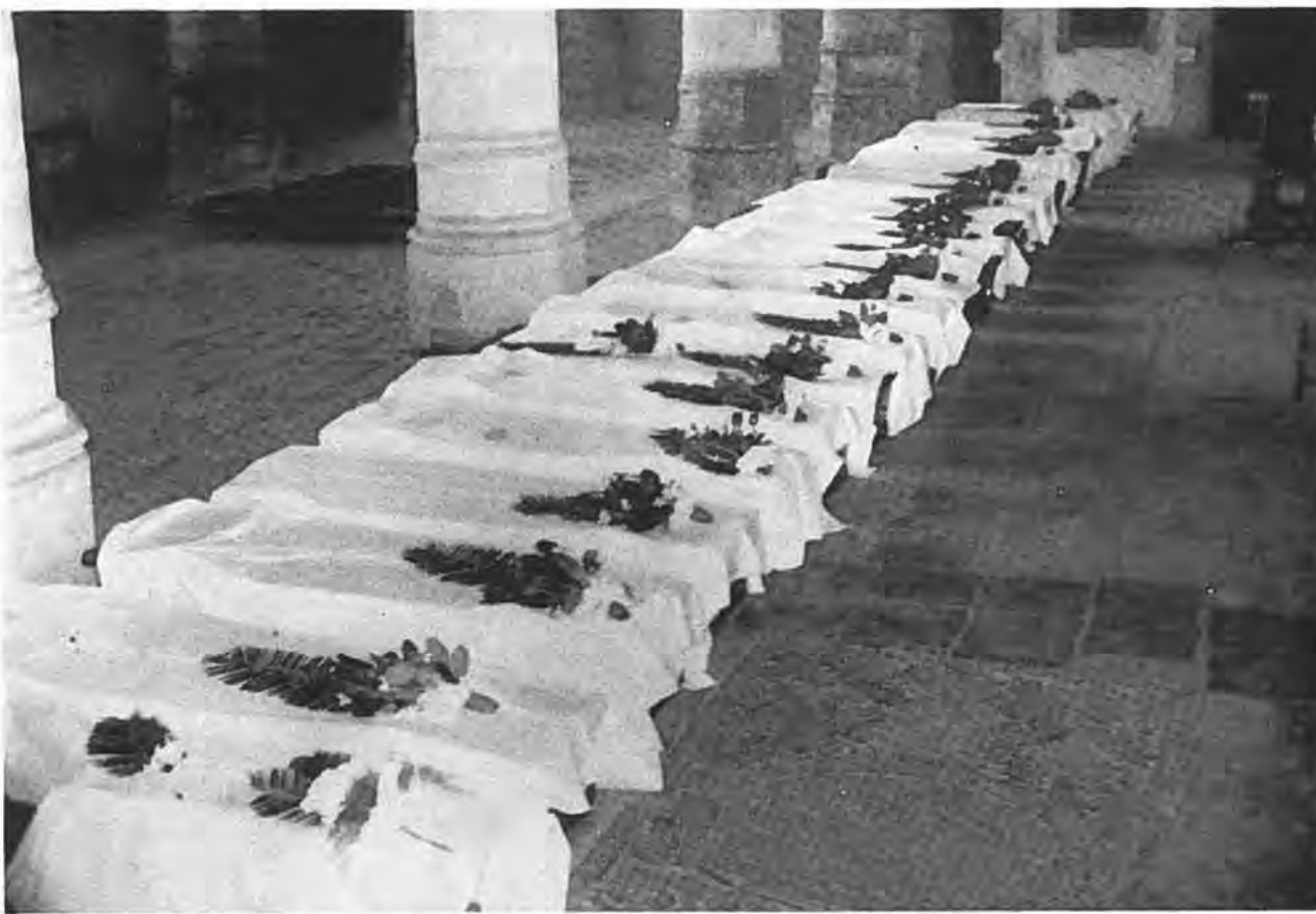
Opgebaarde slachtoffers van Kruijningen in de Grote Kerk te Goes.