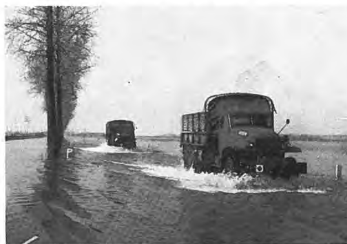
Over de Rijksweg te Rilland. — Foto Kakebeeke.