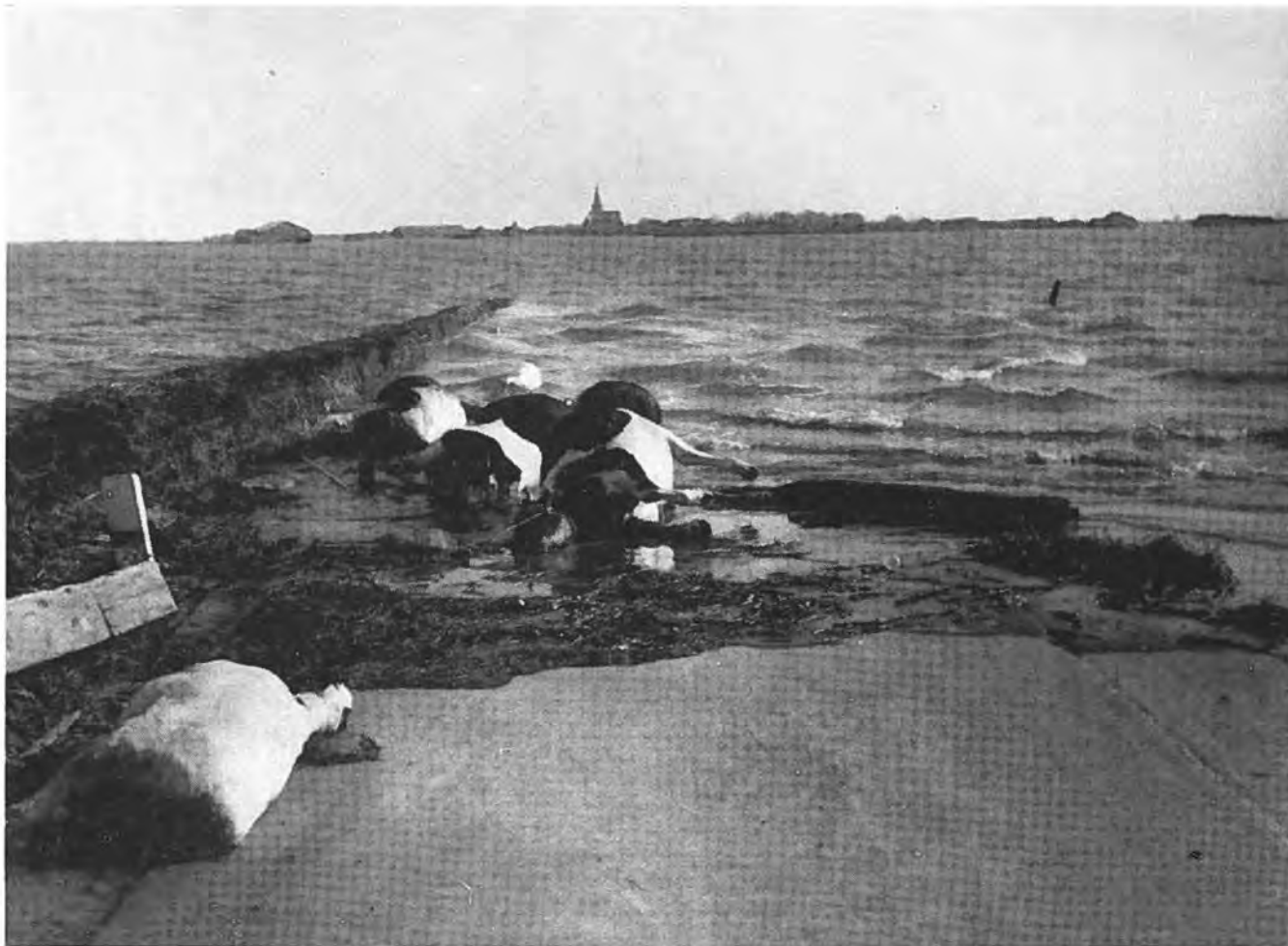
Aan de Zanddijk te Kruijningen met gezicht op het dorp en op de voorgrond verdrongen vee.

We zijn er nog niet. Is er niet een vijftigtal neringdoenden, die sinds 1 Februari hun bedrijven zagen ten onder gaan? Dit wil niet zeggen, dat ze verloren zijn, maar al die tijd liggen hun verdiensten stil. Ze zijn aangewezen op hulpbetoon van anderen. Zullen ze ooit hun schade te boven komen, zullen hun inventarissen vergoed worden? Zullen ze straks, als ze weer opnieuw beginnen, dezelfde klantenkring