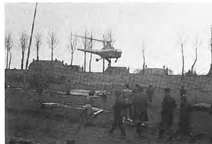
Daar komt de helicoptère weer! (Bathpolder).