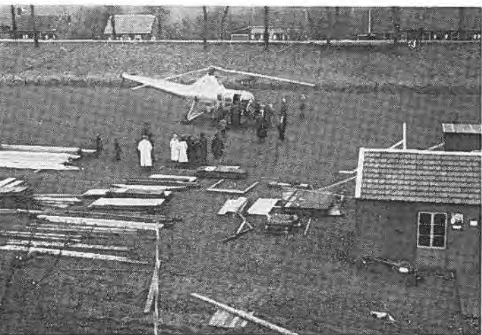
Hulp per helicoptère te Rilland.