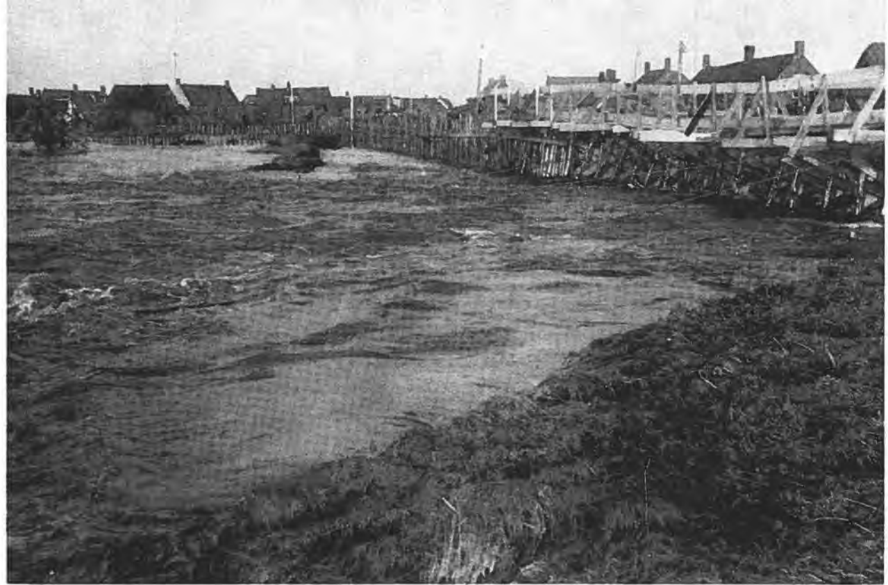
De afdamming van het gat in de Lavendeldijk. —