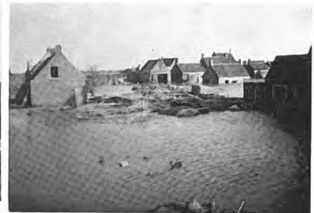
Oostdijk in het water.