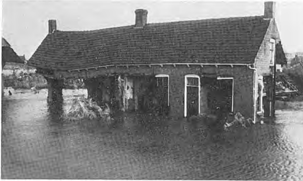
Hoe lang zullen deze woningen nog blijven staan?