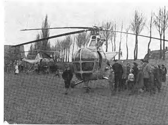
Helicoptères bieden hulp te Rilland.