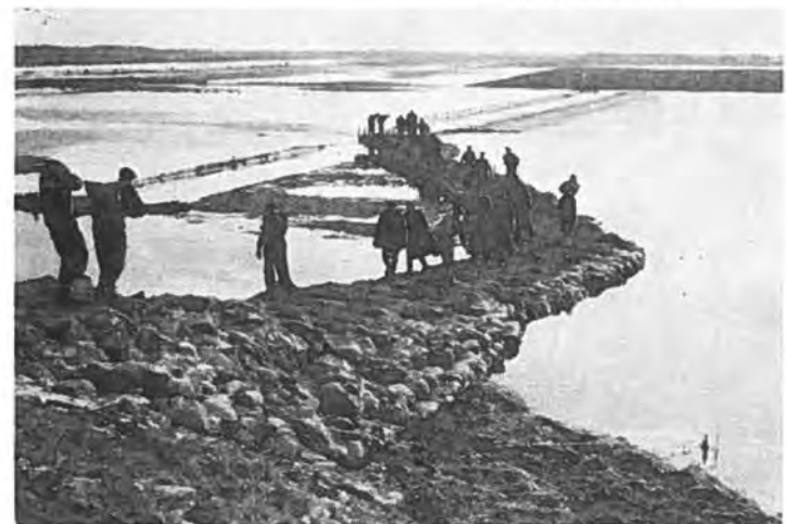
Afweer tegen aantasting binnendijk bij Zuidhof Rilland.