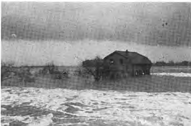
Café „Luchtenburg“.