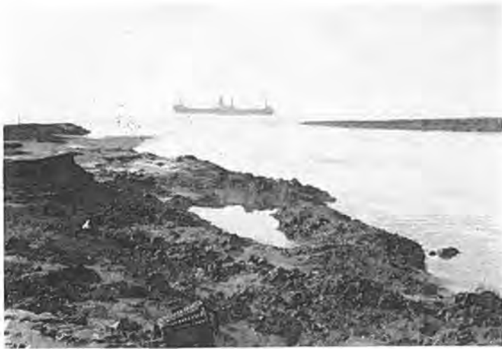
Verbrede geul bij Bath. Op de achtergrond een zeestomer naar Antwerpen.