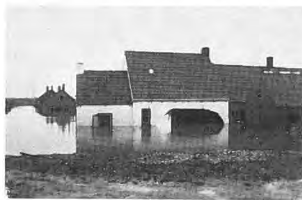
Oostdijk. Wat de stroom meenam.