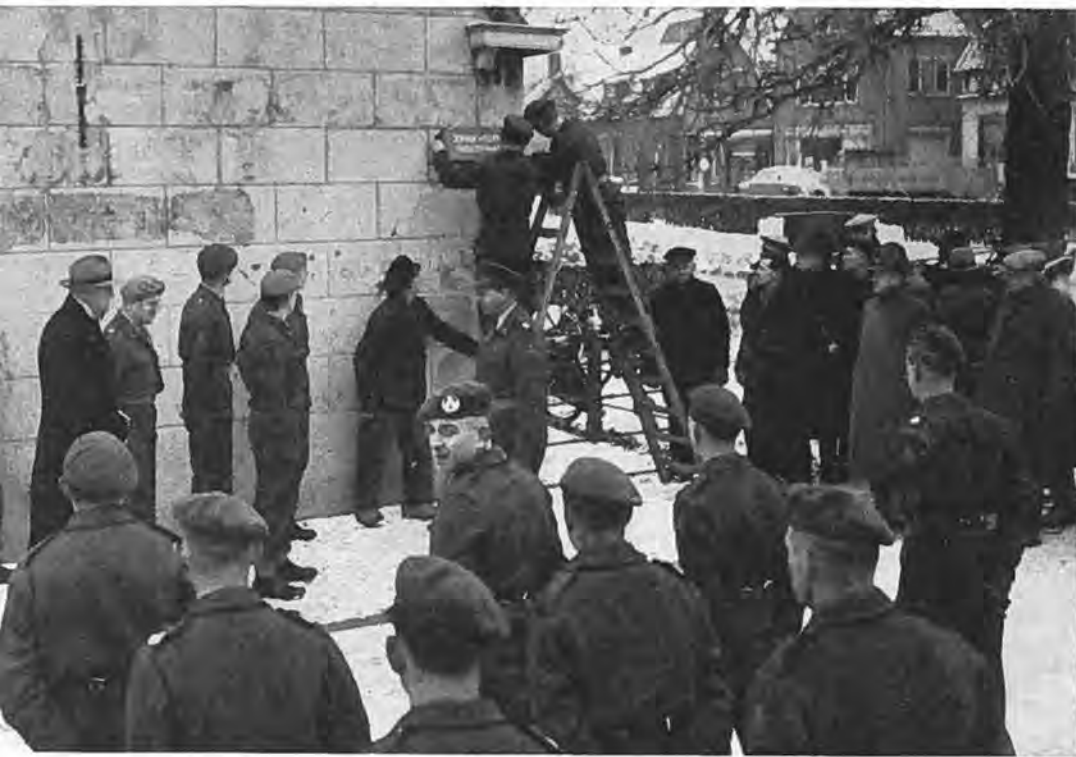
Ter herinnering aan de militaire hulp werd de Zuidweg te Krabbendijke herdoopt in: Johan Willem Frisostraat.

Reeds in de eerste week van de ramp werd begonnen met de verdediging van de Gawegesedijk. Naast de bekleding van de buitenzijde van deze dijk met zand-