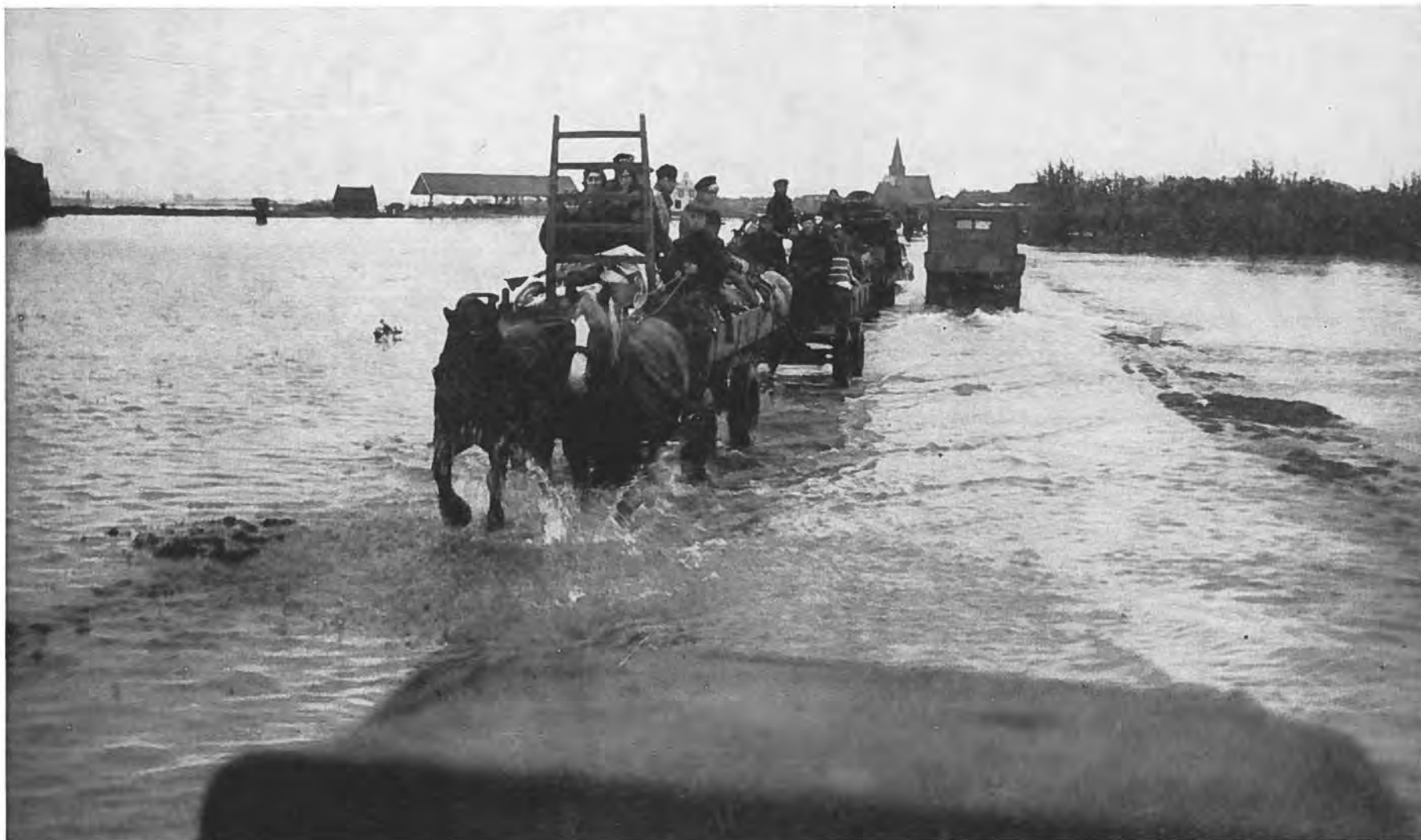
De evacuatie van Kruiningen in volle gang.