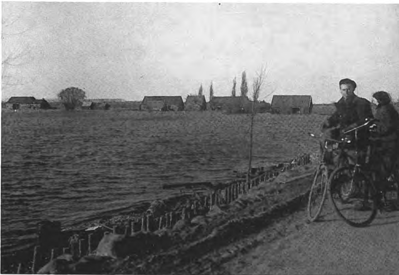
Gezicht op Gawege.