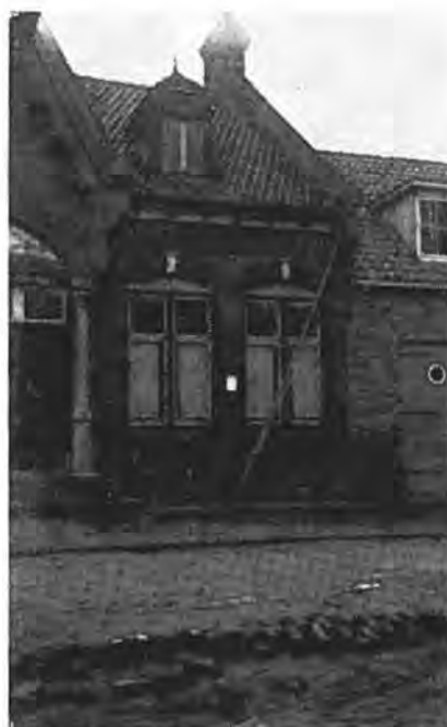
Gemeentehuis van Waarde; let op het aanplakbord met de ongeschonden gebleven huwelijksaankondig'ng.

daarop is het gat in de Nolledijk zo ver gedicht, dat de dijk op hoogwaterpeil gebracht is. Het werk wordt dan voorlopig stopgezet, want belangrijker werkzaamheden moeten voorgaan. Daarom wordt 14 Feb. een begin gemaakt met de dichtmaking van de dijk aan de Westveerpolder. De breuk is 65 m breed en 3 m diep. Vrijdag 20 Februari is het gat in de dijk gedicht. 's Nachts breekt echter de dijk weer door. Woensdagmiddag 25 Februari lukt het het gat opnieuw te dichten. Op een bestorting van basaltsteen is een dijklichaam van zandzakken opgebouwd. Een zandzuiger heeft een zandbed achter de provisorische dijk gespoten. Op 20 Maart wordt een aanvang gemaakt met het aanbrengen van een kleilaag op het pas gedichte gedeelte van de dijk. 11 Maart wordt begonnen met het leegpompen van de Westveerpolder. 3 April moet het leegpompen worden stopgezet, daar de polder zover van het water ontlast is,