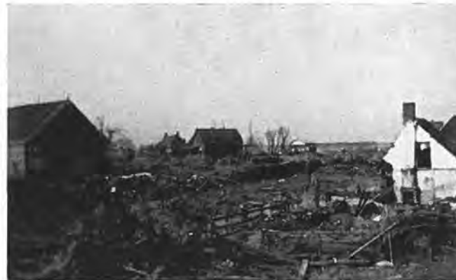
Wrakhout enz. te Oostdijk.