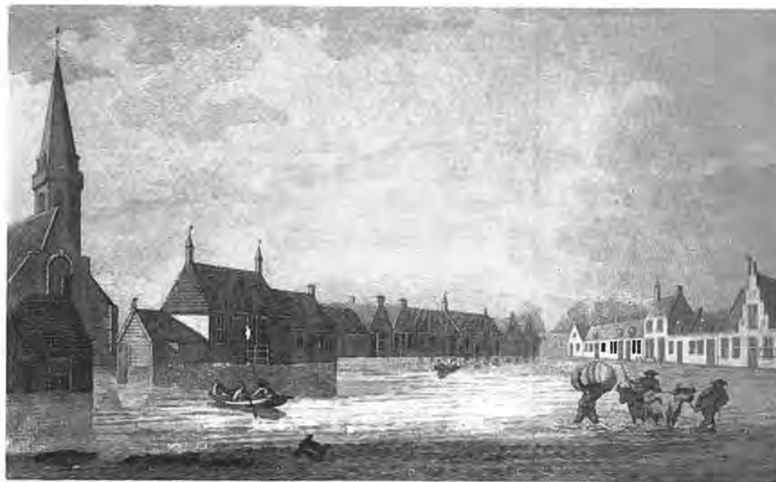
„Gezigt van het overvloeiën van het dorp Kruiningen na de doorbraak van den zeedijk in den nacht tusschen den 14de en 15den Januarij 1808.“

„Op Sinte Aachten Dagh, hoort dese nieuwe Maar, Was Zeelandt door 't Water bedorven bij naar.“ Op Sinte Katarinendag (25 November) 1304 braken