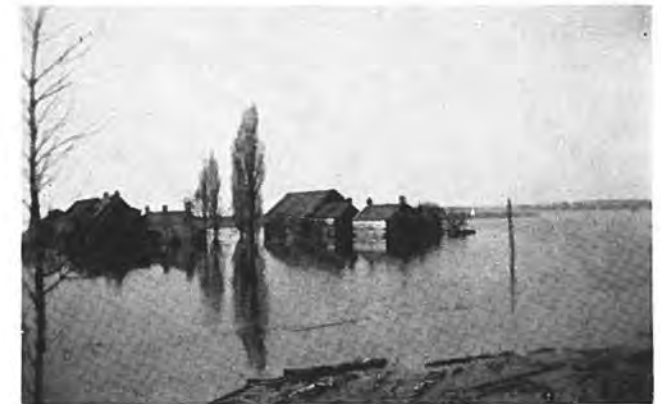
Daar ligt Gawege.