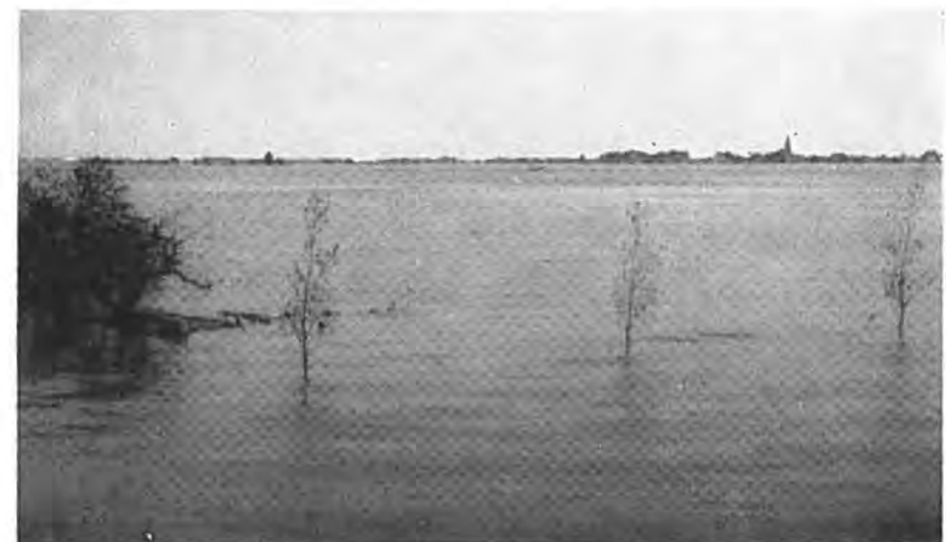
Gezicht vanaf de Zanddijk