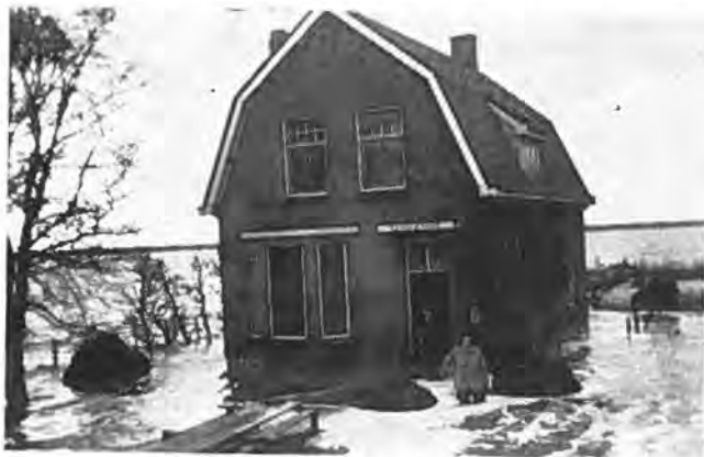
Woning aan Hoofdweg te Rilland-Bath.

tersen werd na enkele dagen de heer C. van Gorsel Wz. aan het polderbestuur toegevoegd. Ook de mensen van de waterstaat zagen de toestand somber in en Ir L. O. Croes, die zich op de hoogte kwam stellen, was al spoedig van mening, dat, om verdere uitschuring door de ebstroom te voorkomen en het gat met succes te dichten, het noodzakelijk was, een groot gedeelte van de polder door een nooddijk af te sluiten, om zo de ebstroom minder hevig te doen zijn. Wanneer er volgens zijn plan een 800 ha kon worden afgesloten, vloeide er bij ieder tij veel minder