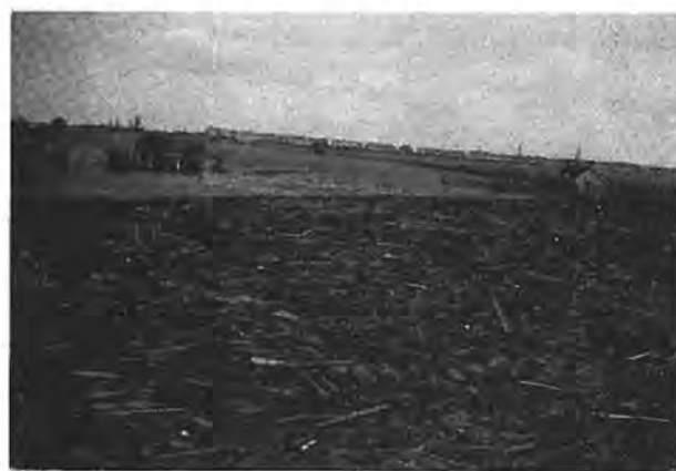
Huizen bij de Weel te Waarde met veel wrakhout aldaar.

te volbrengen. Dat het werk van deze mannen ook van hogerhand waardering ontmoet, blijkt wel uit het feit, dat ongeveer half Februari door Prins Bernhard een radiotoestel in bruikleen wordt afgestaan.