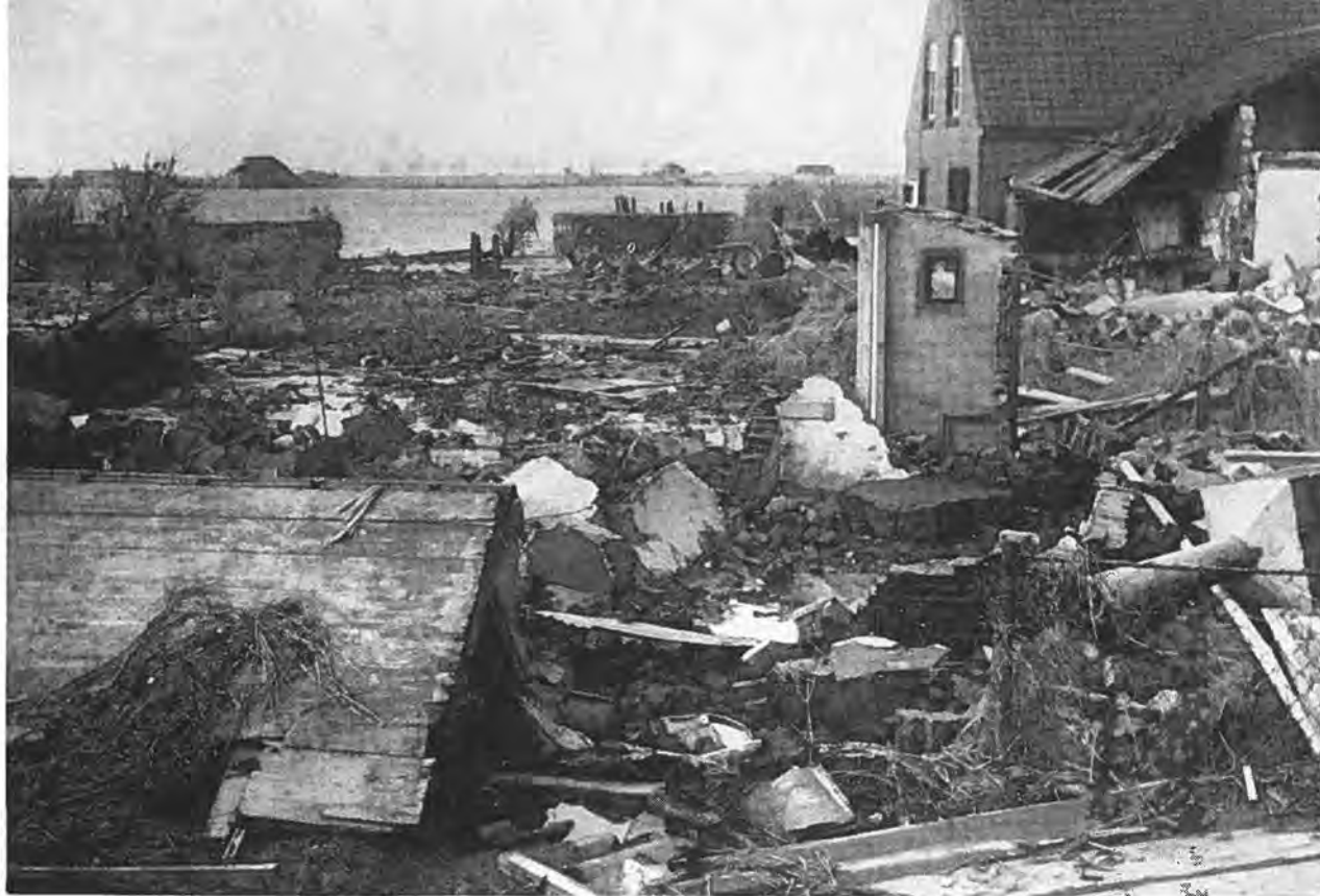
Aan de Tweede Vlietweg te Oostdijk.

calamiteiten. Trouwens, wie waande zich, ook in Krabbendijke, niet absoluut veilig achter de hoog oprijzende, machtige zeedijken, die al zoveel stormen hadden weerstaan?