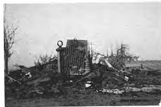
Overblijfsel woning met garage Minnaard. Oostdijk.