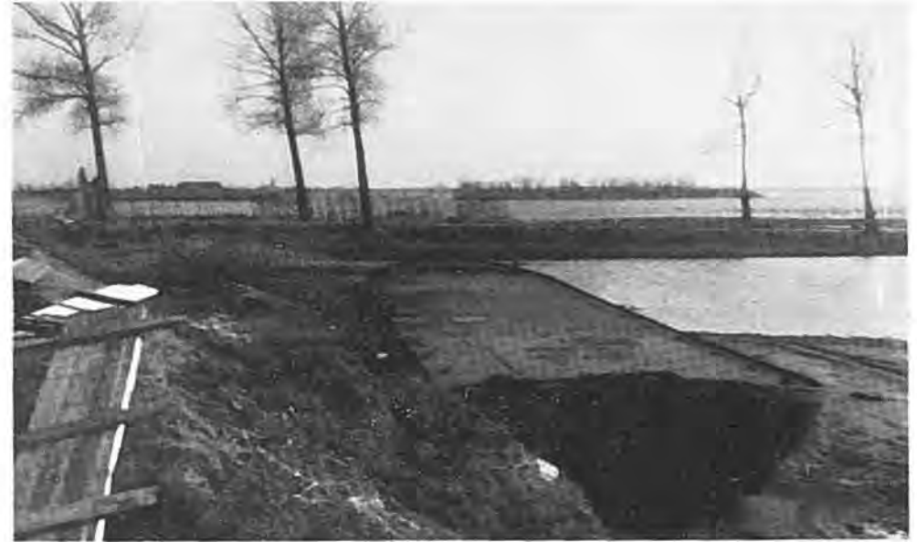
Gezicht vanaf de Lavendeldijk. Daar, waar de bomen staan, is de Rijksweg naar Kruijningen. Op de achtergrond resten van de Kadijk.