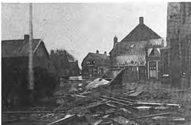
Verwoestingen in Waarde.