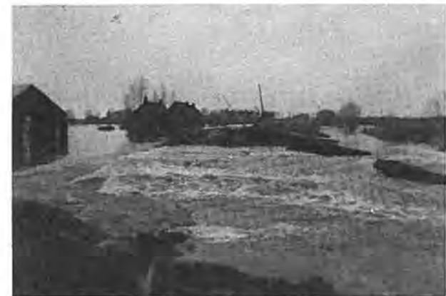
Het grote gat in de Lavendeldijk.