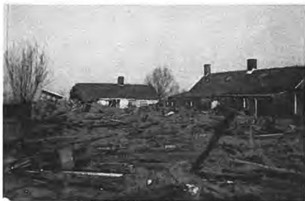
Verwoesting te Oostdijk.

Later heeft dit noodziekenhuis ook uitstekende diensten bewezen bij de verpleging van de vele zieke militaire en burger-dijkwerkers. Als bijzonderheid wordt nog vermeld, dat op 2 Februari in het noodziekenhuis een kind is geboren van een uit Waarde geëvacueerd echtpaar.