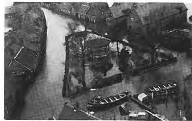
De dorpskern Waarde, gezien vanuit de toren.