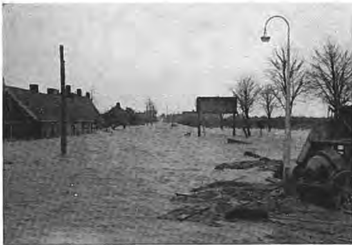
De Hoofdweg te Rilland.

kon op grotere schaal hulp geboden worden. Helaas kwam de vloed met hernieuwde kracht opzetten en de in hun huizen opgesloten mensen beleefden misschien de angstigste uren van hun leven. Hier en daar steeg het water tot meer dan twee en een halve meter. Meubels bonkten tegen het plafond, schuimende golven beukten de muren. De duisternis viel vroeg in en bij het licht van een