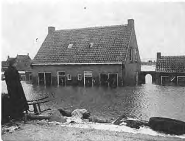
Deze nieuwe woning te Oostdijk doorstond het geweld van het water.

Daar een doorbraak van de Nieuwlandse-binnendijk niet alleen fataal zou zijn voor de Nieuwlandepolder en gevaar zou opleveren voor Krabbendijke, maar ook de nu wel heel dunne „staart” van Zuid-Beveland met volledige doorsnijding zou bedreigen, was het