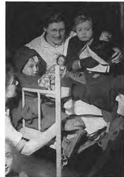
Liefderijk was de ontvangst van de evacués.