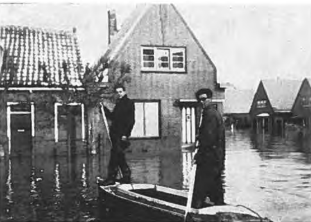
Per boot op hulp uit.