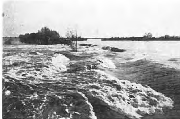
Overloop Kadijk te Waarde.