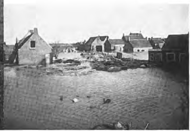
Gezicht op Oostdijk.

voorkomen daarvan niet slechts een polder- maar een algemeen waterstaatsbelang. De Rijkswaterstaat, dit belang ziende, besloot de verhoging van deze dijk een definitief karakter te geven.