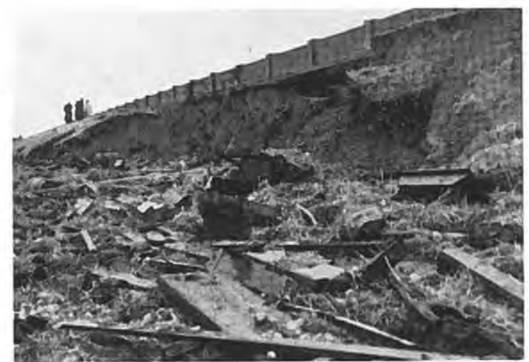
Aantasting binnenkant zeedijk door overlopend water te Rilland.

Ondertussen hadden wij, huisvrouwen, in de Bathpolder bovendien onze eigen zorgen. Wij zagen de eerste weken noch slager, noch groenteboer, terwijl de bakker ons dagelijks brood uit Bergen op Zoom moest betrekken. We hadden niet alleen voor ons eigen gezin te zorgen, maar ook voor de evacué's, die we in groten getale in onze huizen hadden opgenomen. We misten elektrische stroom, wat be-