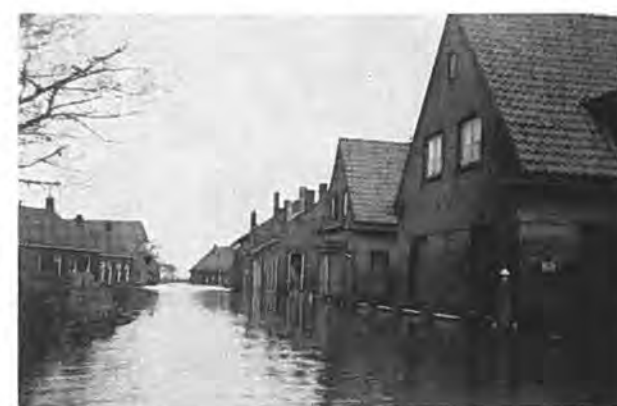
Ouddorp te Waarde.