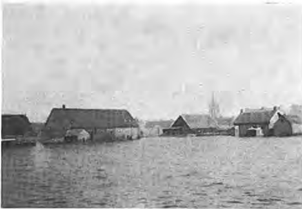
Waarde met kerk Geref. Gemeente.