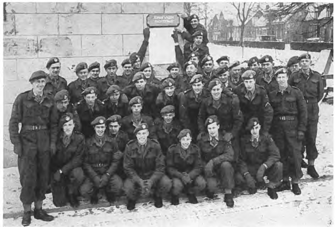
De kranige jongens van het Bataljon Johan Willem Friso.

zakken moest tevens op het onverharde gedeelte van de dijkruin een wegdek worden aangelegd. De onderlangs de dijk — door de buurtschap Gawege — lopende weg stond onder water. Daar al het verkeer naar de Valkenispolder, de Frederikapolder, de Emmanuelpolder en de Zimmermanpolder deze dijk moest passeren, was de aanleg van dit wegdek zeer noodzakelijk. Herhaaldelijk kwam het voor, dat auto's hier bleven steken en daardoor groot oponthoud in de dijkwerkzaamheden veroorzaakten. Bij deze wegaanleg hebben zich o.m. Franse militaire hulptroepen verdienstelijk gemaakt. Deze hadden de beschikking over kipwagens, die voor dit doel zeer geschikt waren. Het voor de verharding benodigde puin en grint werd grotendeels door hen vanaf de opslagplaats aan de haven vervoerd. Deze Franse militairen vonden onderdak in een der gebouwen van de Veilingsvereniging „Krabbendijke en Omstreken”.