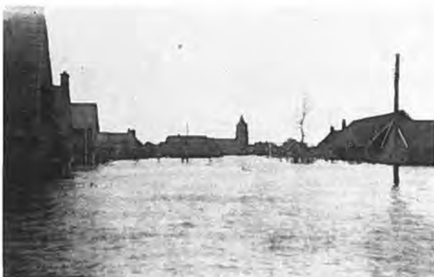
Het water in en om Waarde.