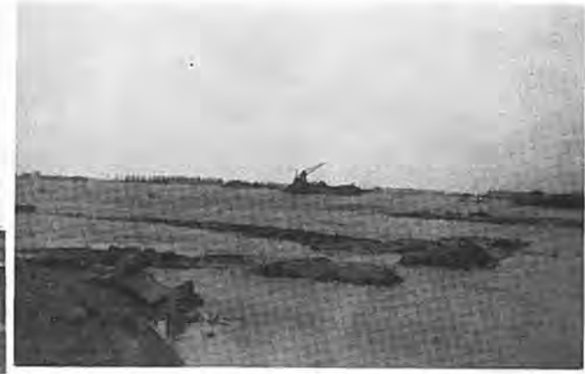
De doorbraak van de Kadijk.