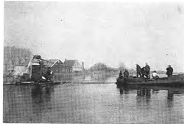
Het bergen van landbouwmachines