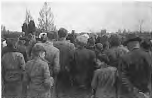
Het medeleven bij de begrafenis van een slachtoffer.

vijf Tweede Kamerleden Krabbendijke en meerdere malen was dat het geval met de Commissaris der Koningin in de provincie Zeeland, die steeds grote belangstelling voor het wel en wee van Krabbendijke aan de dag legde en die het gemeentebestuur met raad en daad terzijde stond.