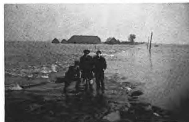
Het water komt weer op te Rilland-Bath.