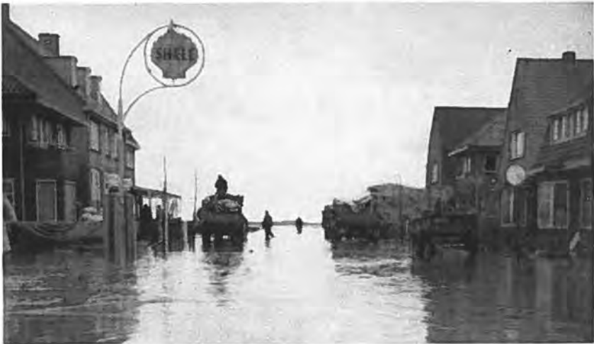
Evacuatie Burg. Elenbaasstraat.