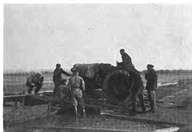
Het bergen van een zware tractor — Foto van Fraassen.