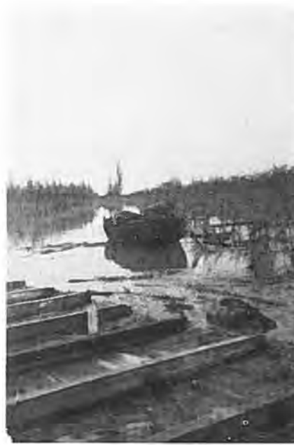
Een boomgaard aan de Lavendeldijk.

De uitvoering van deze voor het behoud van Krabben-