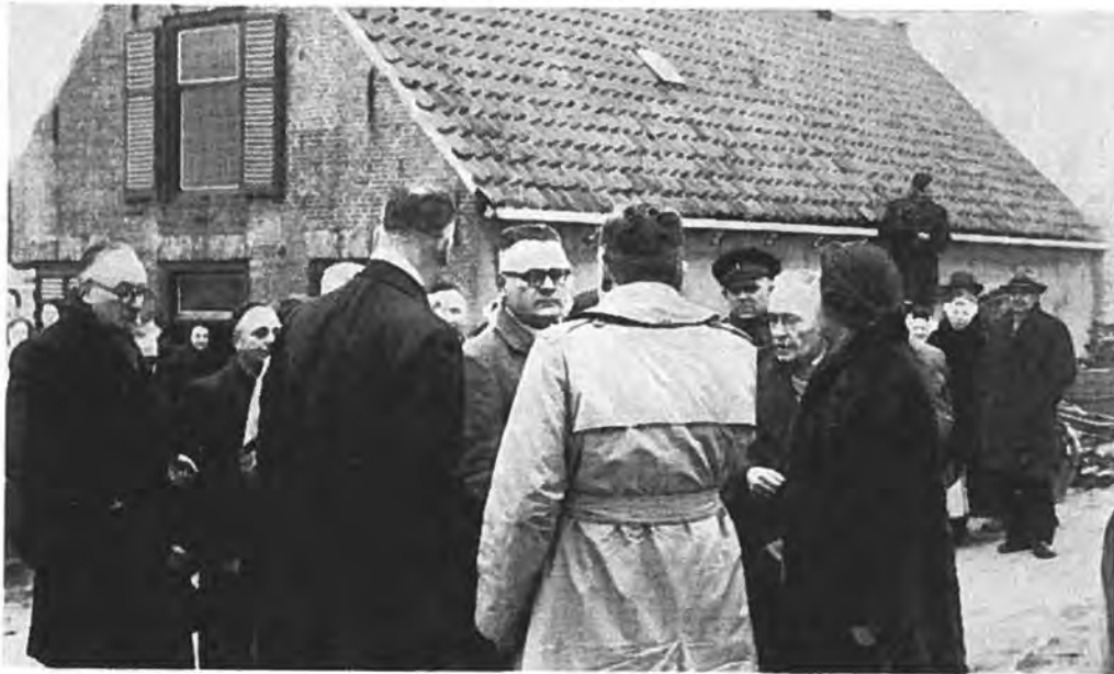
Bezoek H.M. de Koningin

hoevende familieleden al eerder in veiliger oorden gebracht?