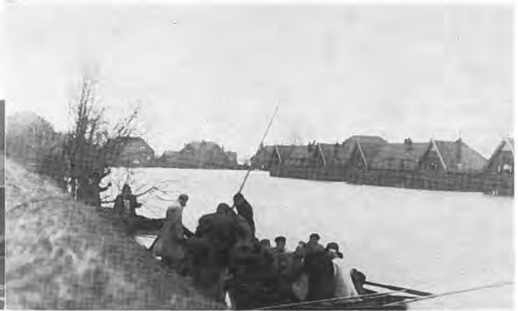
Aankomst van bewoners uit de Kruiningerpolder te Hansweert.