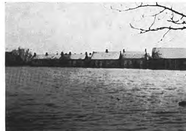
In sneeuw en water te Waarde.