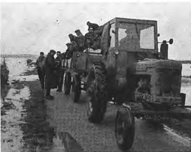
ort over de Derde Weg te Rilland.

23 Maart was een bijzondere dag, die wij nimmer zullen vergeten. In de morgen bracht H.M. Koningin Juliana een bezoek aan onze gemeente. Het was een gewoon werkbezoek, zonder de officiële plechtigheden, die aan een koninklijk bezoek verbonden plegen te zijn. Even voor tien uur arriveerde de koninklijke trein bij wachtpost 20. Het was de eerste persontrein, die na de ramp Zeeland binnenreed. Een lichte mist hing over het land en geen zonnestraal slaagde erin het wolkendek te doorboren. Slechts een paar honderd mensen waren getuige van de aankomst der vorstin. Deze mensen zagen van heel nabij