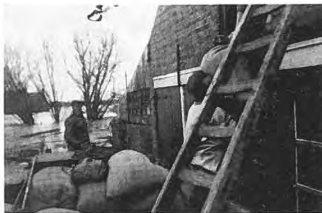
Wat nog te redden viel, wordt van de zolders gehaald.