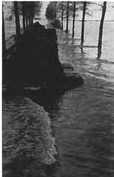
Grote stapels zandzakken aan de Rijksweg.

wordt begonnen met de aanvoer van materialen voor de Kadijk. Tevens wordt begonnen met de werkzaamheden aan de Lavendeldijk. Donderdag 26 Feb. is het eerste gat in deze dijk gedicht. Op 10 Maart wordt het grootste en laatste gat in de Lavendeldijk gesloten. Op 16 Maart kan worden begonnen met het opspuiten van de Kadijk. De 28e Maart om 1 uur is het eerste gat in deze dijk, dat 100 m breed is, dicht. Dan komt echter tegenslag. De volgende dag wordt als gevolg van een storm een kwart gedeelte weer weggeslagen. Ook twee kleinere gedichte gaten zijn weer opengebroken. Maandag 30 Maart is het voor de twee zuigers, die werkzaam zijn aan de Kadijk, een ongeluksdag. De ene wordt door de harde wind van zijn ankers geslagen en krijgt schade aan de scheepswand, terwijl de andere zuiger zijn persbuis, waarmede het zand wordt opgespoten, verliest. In de loop van Dinsdag arriveert reeds een nieuwe persbuis uit Sliedrecht, zodat de zuiger zo spoedig mogelijk zijn arbeid kan hervatten. Op 7 April wordt weer begonnen met het persen in het 25 meter lange gat, dat bij de storm weer in de Kadijk was geslagen.