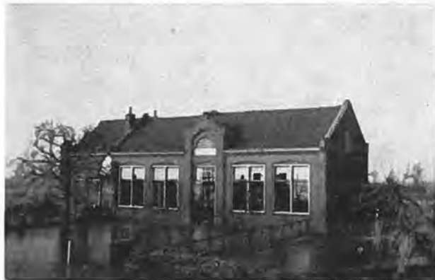
Chr. School Oostdijk bij laag water. De schoolwoning is geheel verwoest.