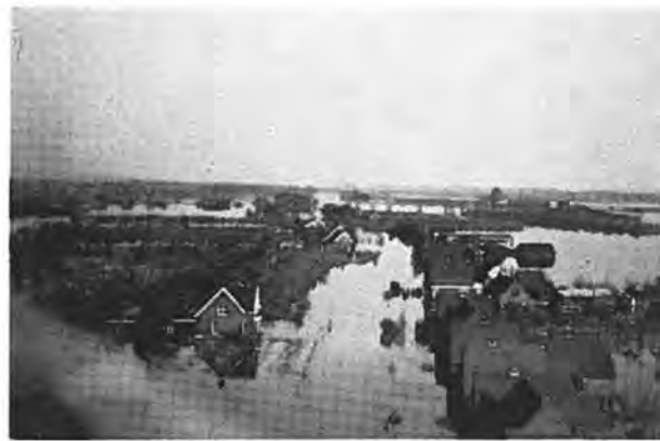
Gezicht op Waarde.