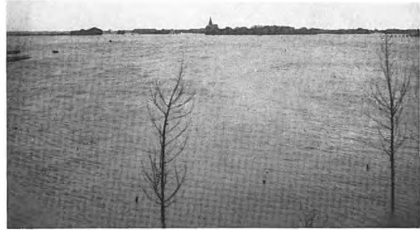
Kruiningen. Zeer hoog water.