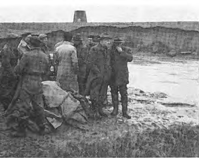
Het dichtten der dijkgaten te Rilland. Geheel rechts Dijkgraaf Krijger, daarnaast wnd. Burgemeester Bu'ijn.