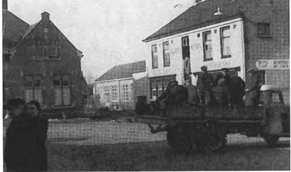
De evacuatie van Kruijningen in volle gang.

wie de hulp te laat kwam? Veler gedachten gingen naar hen uit. Maar wat konden wij doen? Immers niets!