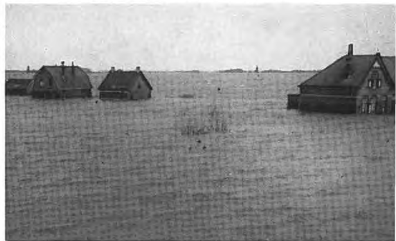
Hansweert. Gezicht vanaf de Havendijk.