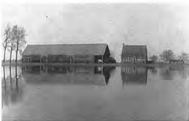
Hoeve „Annaput“ te Waarde.