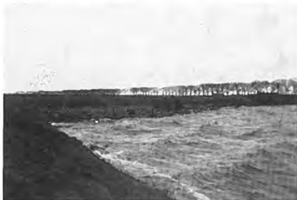
Golfeklots in de dijkhoek bij Gawege.