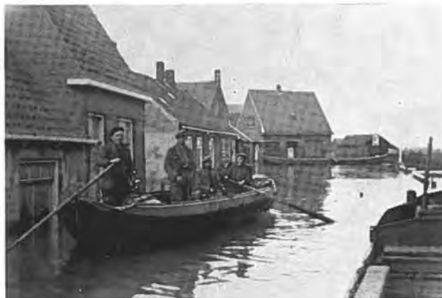
Per boot door het dorp Waarde.