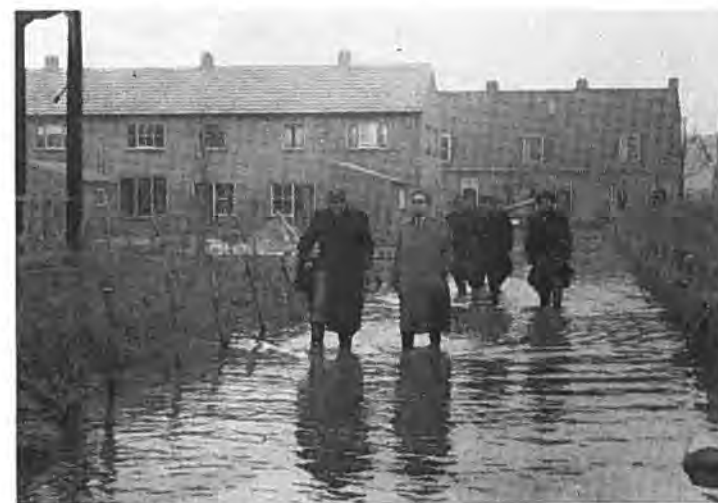
Adopterende Gemeentebesturen op bezoek in Rilland; links op de voorgrond wnd. Burgemeester Butijn.

Van tijd tot tijd werden stokjes in het water gegooid om te zien, hoe snel de vloedstroom nog binnenwaarts ging. Iedereen keek met belangstelling toe. Eindelijk gingen de stokjes wat minder snel. De kentering was op til. Nog een paar minuten en het laatste stokje, dat in het water geworpen werd, bleef liggen in de geul.