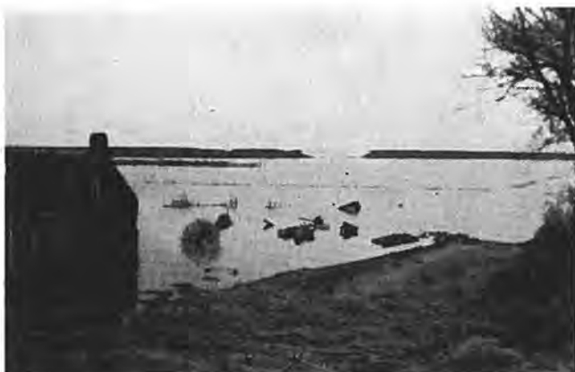
Waarde. Gat in zeedijk Westveerpolder.

daar de buitendijk het meest te lijden heeft door stormen uit het zuidwesten, wel zeer goed dienst gedaan.