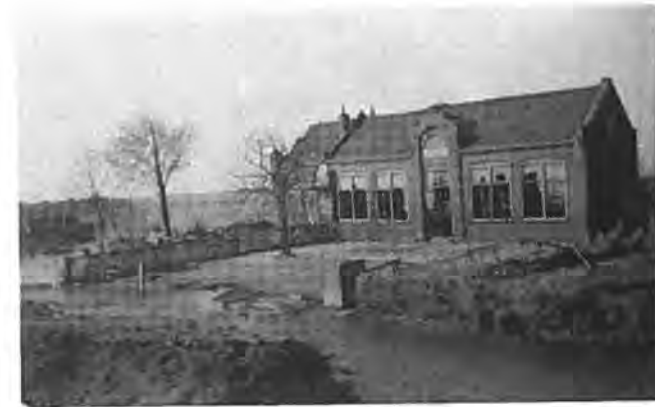
Chr. School te Oostdijk. (achtergevel geheel weg).

Het versterken van de Lapdijk had ten doel om Krabbendijke te beveiligen tegen het water uit de Nieuwlandepolder, die reeds gedeeltelijk was ingelopen. Deze maatregel verhinderde echter niet, dat daarnaast ook al het mogelijke werd gedaan om deze