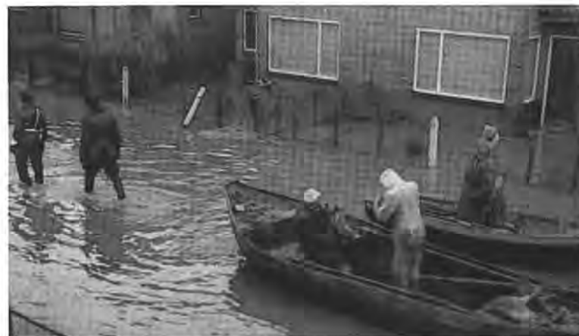
Evacuatie drukte.