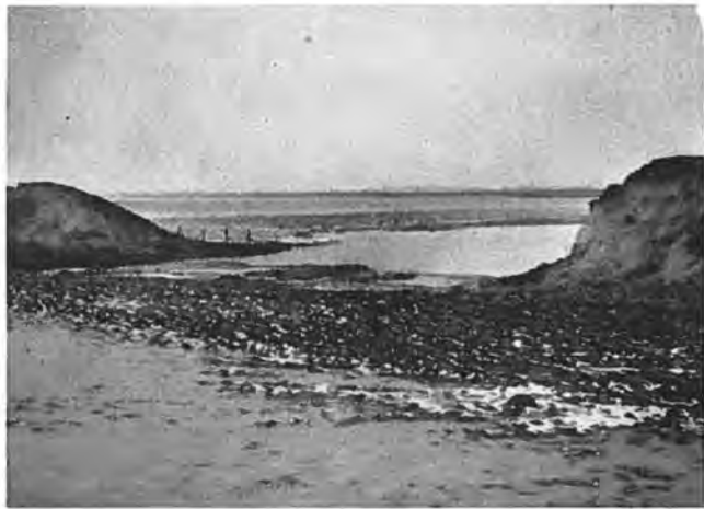
Het dijkgat in de Emmanuelpolder te Waarde.