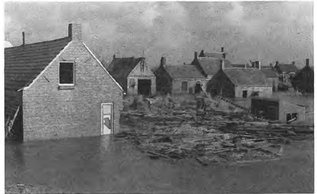
Wrakhout bij Oostdijk.