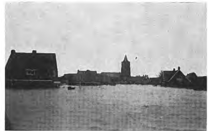
Kerkweg Waarde.