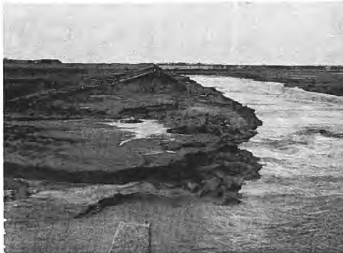
Het grote stroomgat bij Bath.