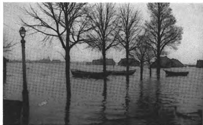
Hansweert. „De oprijt” Hansweertsestraatweg. — Foto Verbeek.