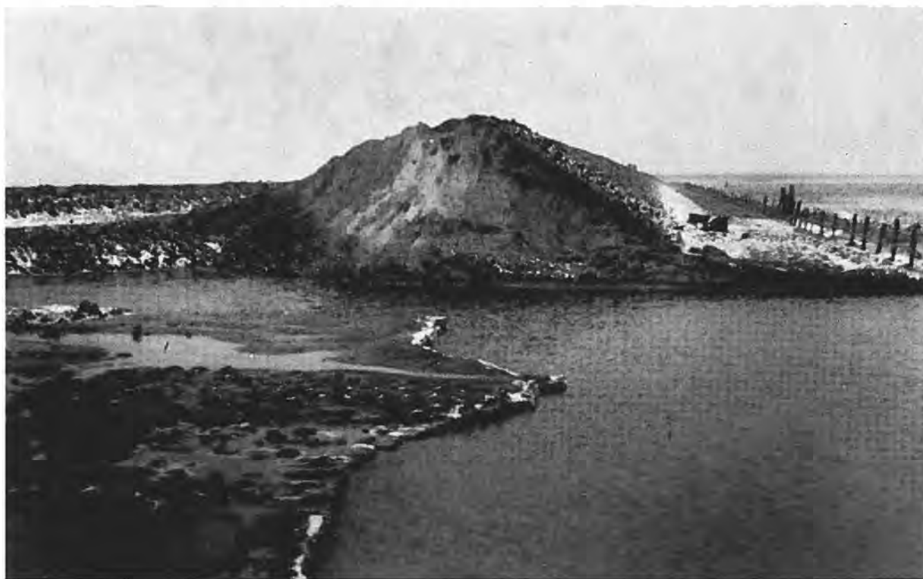
Het dijkgat in de Emmanuelpolder te Waarde.

Onderwijl is gebleken, dat het grootste gevaar voor het dorp Waarde niet van de zeezijde komt. Het blijkt al spoedig, dat het water zich door de Kadijk een weg heeft gebaand naar het Waterschap Waarde en in de Krabbendijkse Vliet stroomt. Hoewel het onbegonnen werk lijkt, besluit men toch te trachten