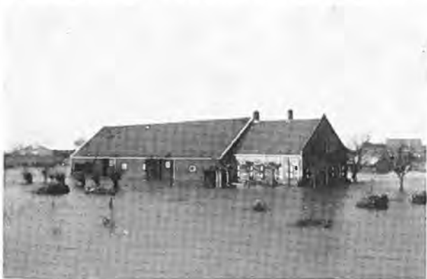
Huis met landbouwschuur van J. Nieuwenhuyse met op achtergrond Oostdijk.