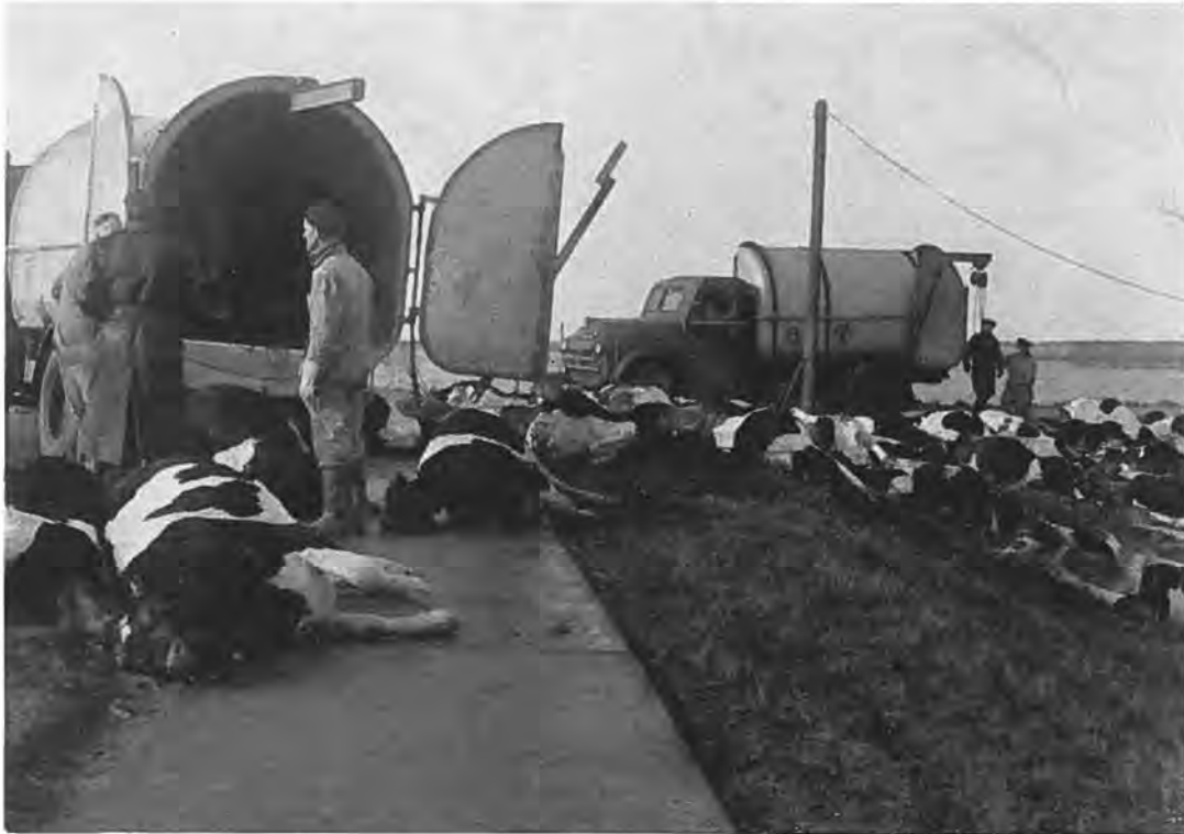
Een groot gedeelte van de veestapel werd een prooi van het water.