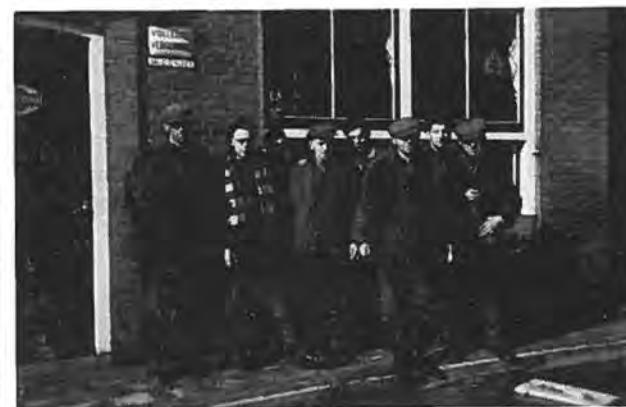
Redden wat nog te redden valt bij laag water te Waarde. Vóór café Kloet.