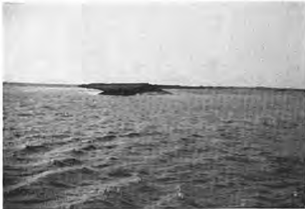
Het grote dijkgat bij Krui-ningen.

„Maar, à propos, wat denk jij van de aanstaande gemeenteraadsverkiezing? Zouden er in de toekomst veranderingen komen in de raad? Je weet, de laatste jaren is de bevolking flink toegenomen, ons dorp heeft de allures van een klein stadje aangenomen en daarom konden er inderdaad wel eens veranderingen op til zijn. Ook de middenstand roert zich de laatste tijd,