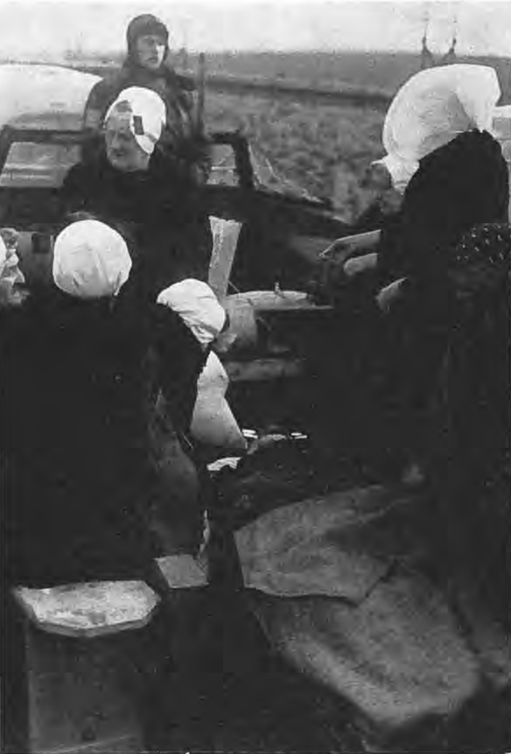
Evacuerende Zeeuwse vrouwen.

buitengewone maatregelen de hulp moest worden ingeroepen van extra politiepersoneel. In de eerste dagen na 1 Februari werden door de alhier woonachtige leden van de Luchtvaartdienst en door met verlof zijnde militairen politiediensten verricht. Tegen het einde der eerste week werd deze taak overgenomen door een detachement van de Koninklijke Marechaussee en een detachement Rijkspolitie uit Limburg, respectievelijk gehuisvest in de (juist leeggekomen) schoolwoning aan de Noordweg en in de cantine van de Veiling. Enige weken later werd het