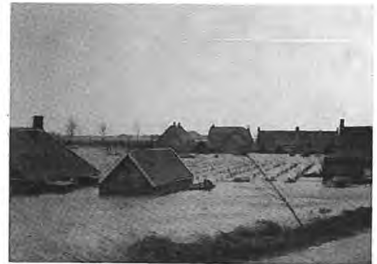
Aan de Hogendijk met „Drie Haasjes“ te Rilland.