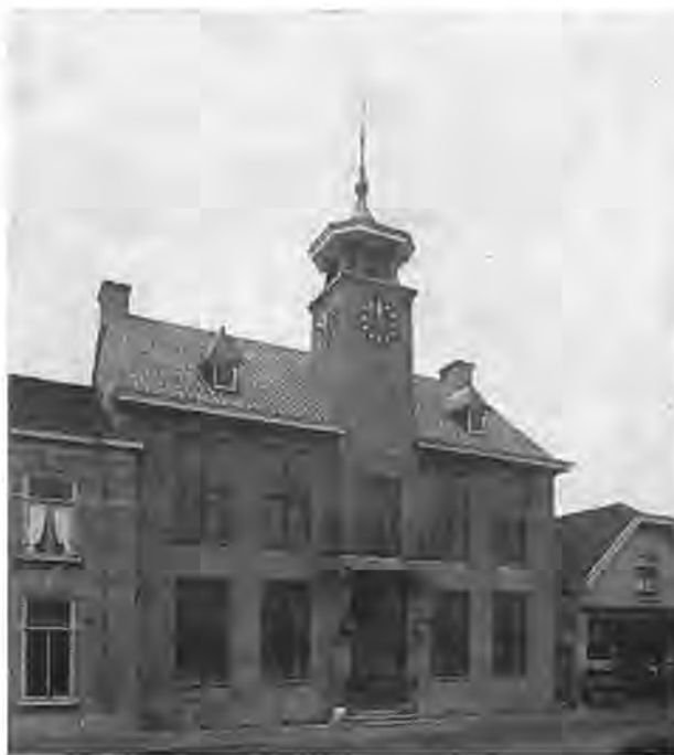
Gemeentehuis te Krabbendijke.

Als men rekent, dat reeds aan deze dijk ruim 400.000