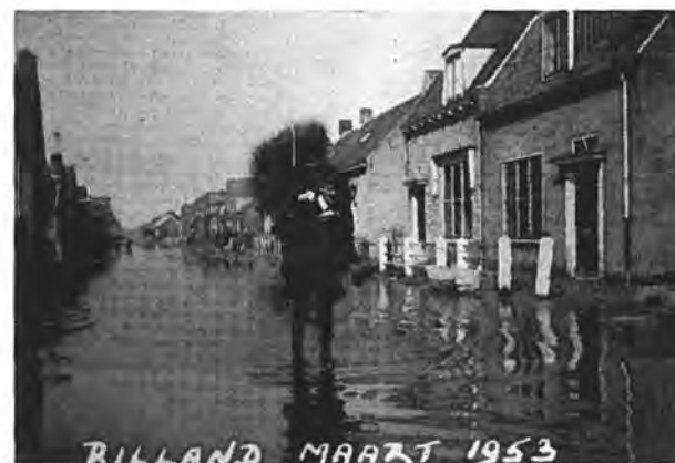
Adriaan Butijnstraat te Rilland.

Hoe vervelend het ook was, op Zondag 1 Maart moest er worden doorgewerkt aan het nieuwe stuk nooddijk. In de dagen die volgden schoot het werk flink op en op 7 Maart ging Ir Croes het werk ver-