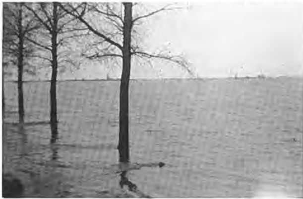
Rijksweg naar Kruiningen: aan de horizon het dofp.