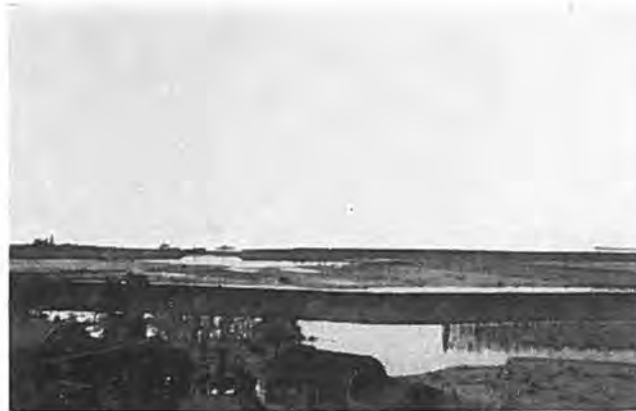
Gezicht op de Westveerpolder te Waarde; op de achtergrond gat in de zeedijk.