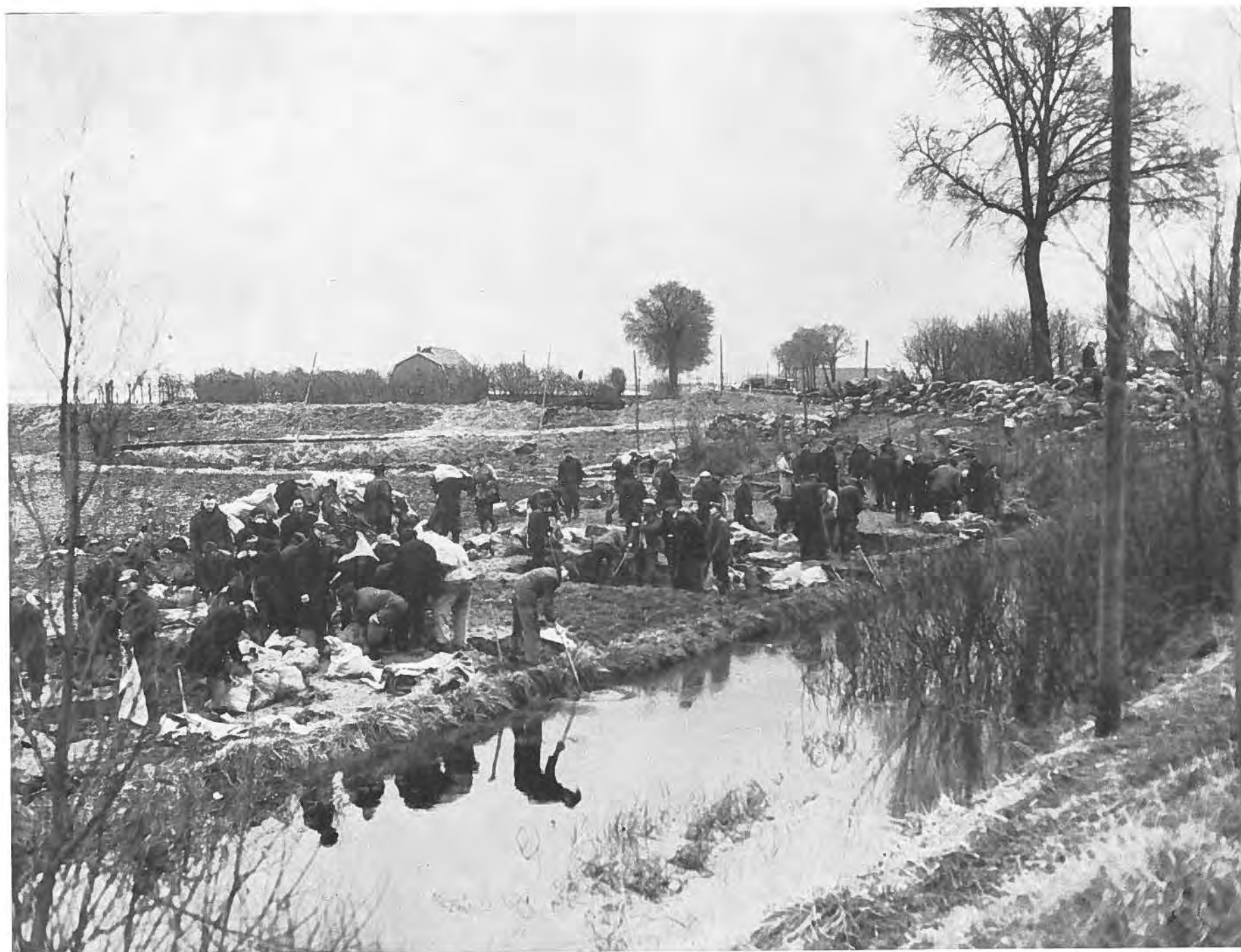
Met man en macht wordt de Zanddijk versterkt.