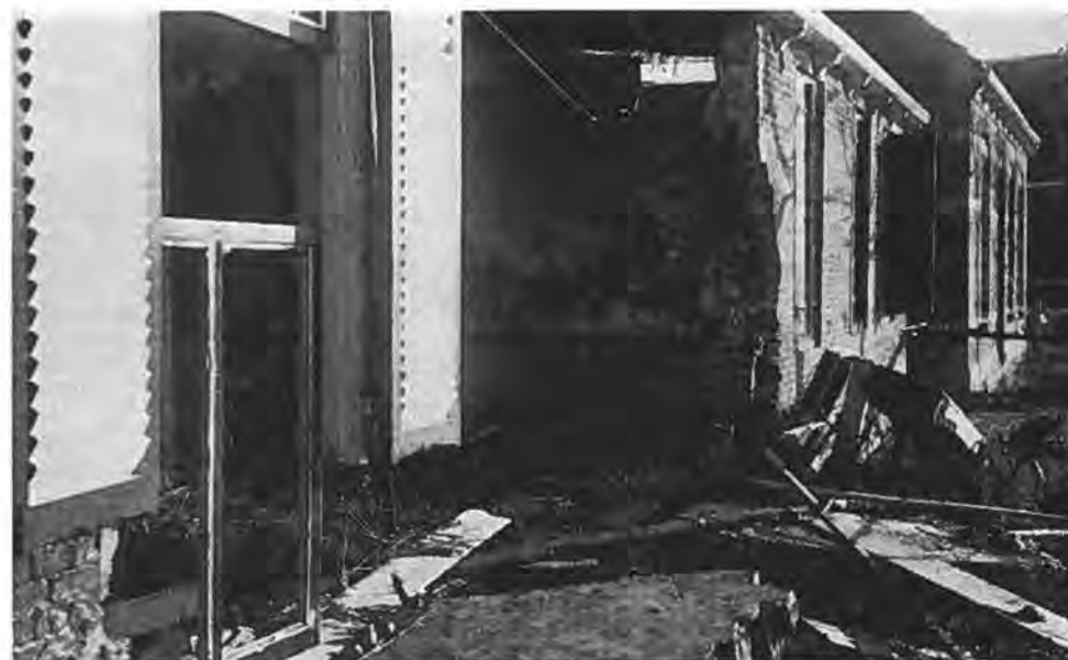
Een verwoest huis te Gawege.

Wanneer wij in dit laatste onderdeel van deze bijdrage allereerst iets willen gaan mededelen over de taak van het gemeentebestuur, dan mag hieruit niet worden afgeleid, dat deze taak, omdat daarover pas in het slot gesproken wordt, niet zo erg belangrijk is geweest. Als ooit het gezegde „Last but not least”