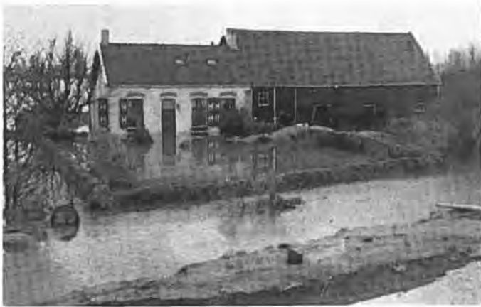
Woonhu's met schuur van P. Philipse, Oostdijk.