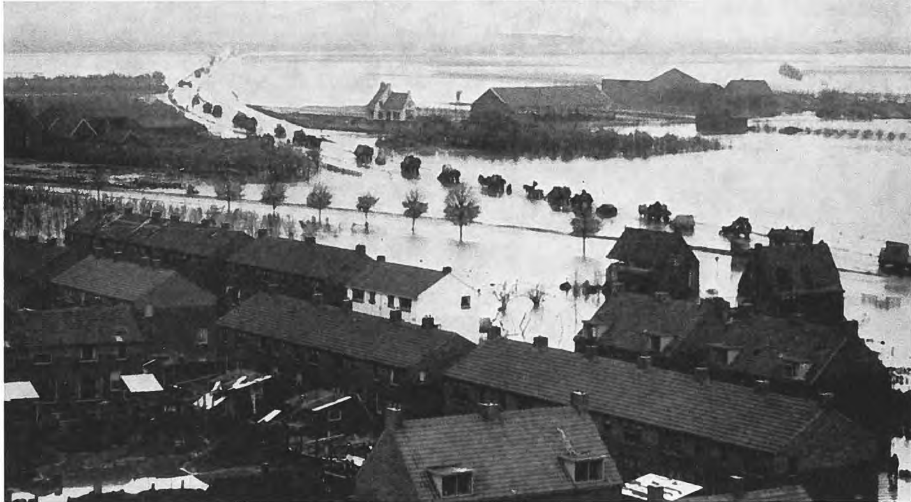
De evacuatie van Kruiningen in volle gang.