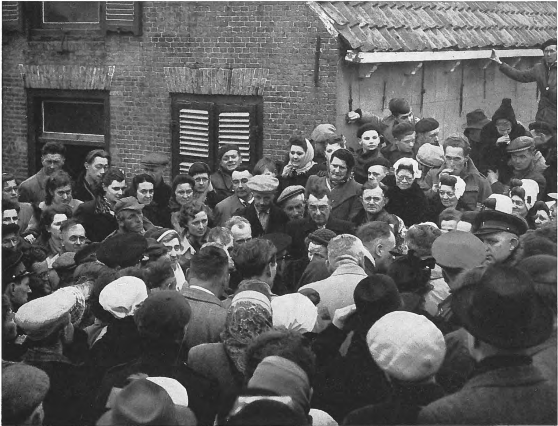
Koninklijke belangstelling voor het zwaar getroffen Oostdijk.