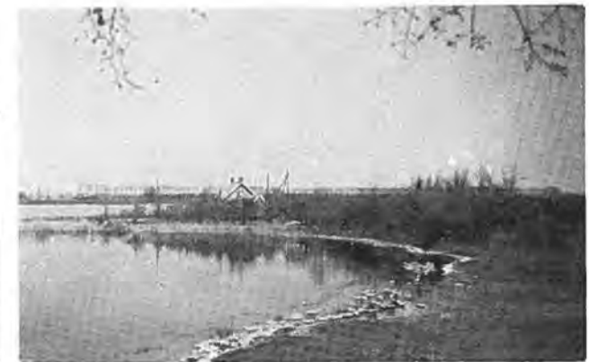
De Weel bij Waarde.

het gat in deze dijk te dichten. Een aantal mannen begeeft zich naar de plaats des onheils en om 10 uur wordt met het werk begonnen. Met man en macht wordt gezwoegd om de dijk te behouden. En het lukt! Om half twaalf is het gat dicht. Besloten wordt om half één weer naar de Kadijk te gaan, om deze verder te versterken, maar inmiddels is er iets anders gebeurd, waardoor practisch allen verstek laten gaan.