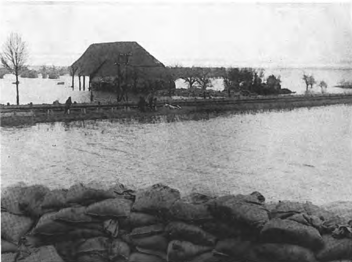
Hofstede van fam. Mesu te Oostdijk. Op de voorgrond met zandzakken versterkte Nieuwlandse-binnendijk. Midden: de spoorbaan. Op Tweede Paasdag stortte ook de rest van de schuur in

Juist door zijn behoud heeft Krabbendijke een zeer belangrijke rol gespeeld in alles, wat met de watersnood in Oost-Zuid-Beveland verband hield. Om deze reden is het alleszins gerechtvaardigd, dat ook voor Krabbendijke een plaats in dit gedenkboek wordt ingeruimd.