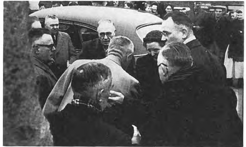
Ontvangst H.M. de Koningin