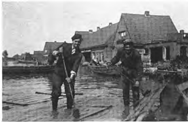
Schoonmaak — Foto van Fraassen.