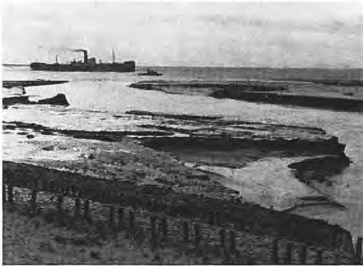
Stroomgat bij Bath.

Omstreeks half twee in de namiddag werden de heren de Hartog, Leendertse en van Hoek, die nog steeds in of op de autobus nabij Bath zaten, per roeiboot afgehaald en verkleumd van koude op het droge gebracht. Daarna werd ook de bevolking van Bath geëvacueerd en met bussen naar Bergen op Zoom vervoerd. Later op de dag, toen inmiddels per radio de met verlof zijnde militairen waren teruggeroepen,