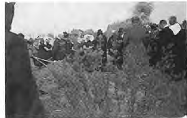
De teraardebestelling van een slachtoffer op de begraafplaats te Krabbendijke.