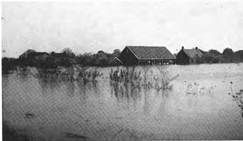
Hofstede van dhr. Boone te Kruiningen.

Na alle drukte, die de lage waterstand met zich meebracht, werd het weer stil. De vloed kwam weer, men moest maken dat men wegkwam. Het ging zo snel; wie niet op tijd weg was liep kans zijn leven of althans zijn hebben en houden te verliezen. Het gebeurde zelfs, dat iemand, die zijn natte huisraad probeerde te redden, wat laat uit het dorp vertrok en, vóór de veilige Zanddijk was bereikt, de vrachtauto met het huisraad halverwege moest laten staan, daar de motor door het opkomende zeewater afsloeg. Hij zelf werd op het kantje af gered.