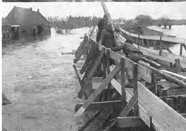
De afdamming van het gat in de Lavendeldijk.

van 3000 zielen, nog ongeveer 1500 evacu es ondergebracht. Neemt men hierbij in aanmerking, dat Krabbendijke over land praktisch geheel van de buitenwereld was afgesloten, dat voorts de storm de gehele dag met schier onverminderde kracht had gewoed en daardoor de zwakke binnendijken onder voortdurende bedreiging hield, dan kan de toestand, waarin Krabbendijke zich op de avond van de eerste rampdag bevond, uiterst zorgwekkend worden genoemd. Het is dan ook begrijpelijk, dat er die nacht niet veel geslapen is. Ieder hield rekening met de mogelijkheid, dat ook Krabbendijke nog aan het water ten prooi zou vallen.