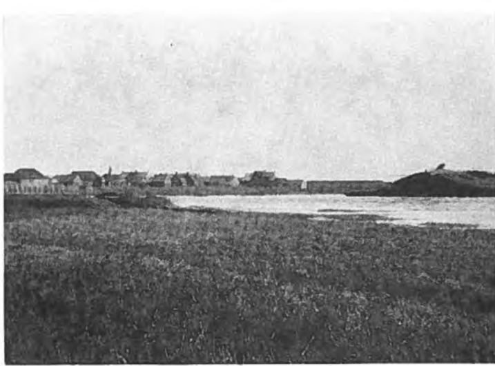
Gezicht op Bath; op voorgrond dijkdoorbraak.