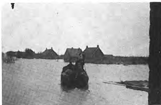
„Veerboot“ van en naar Waarde, afvaart Gawegc.

Intussen heeft Donderdag 5 Februari toch nog een lichtzijde. Dan wordt nl. begonnen met de werkzaamheden aan de Nolledijk onder toezicht van de Nederlandse Heidemaatschappij. De 12e Februari neemt de combinatie D. Verstoep — v. d. Breejen Bout — Bos & Kalis de uitvoering van het werk in handen. De dag