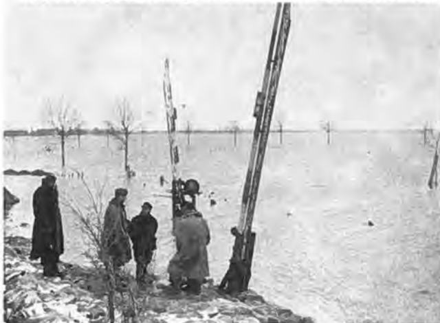
Militairen in gesprek met spoorwegaarbeiders aan de Nieuwlandse-binnendijk.

een derde gedeelte geheel verwoest en een even groot gedeelte practisch onherstelbaar beschadigd. Ook de boerenhoeve van de wed. Mesu onderging het lot van de verwoesting, terwijl die van de landbouwers Visser en Boone zwaar beschadigd werden. Het gebouw van de enige school op Oostdijk werd evenmin gespaard. De schamele resten ervan kunnen elk ogenblik in elkaar storten. Vijf en negentig stuks rundvee kwamen in het water om en nagenoeg al het kleinvee. Welk een tragisch lot voor deze zo sterk op zichzelf ingestelde buurtschap, waarvan de thans van huis en