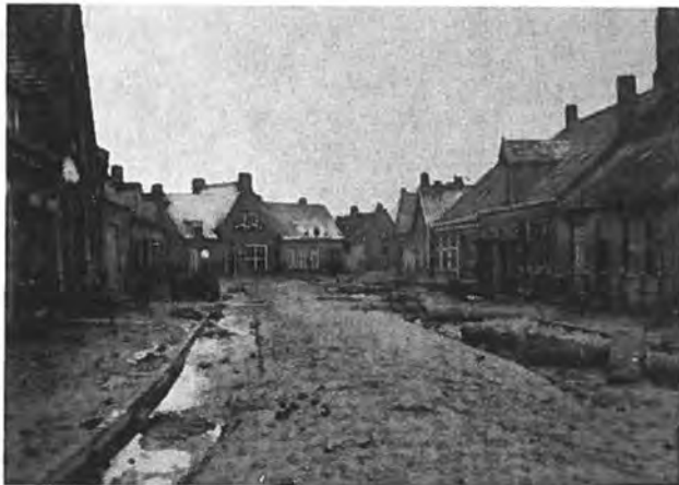
Dorpsstraat Waarde bij laag water.

Veel zal nog moeten gebeuren; met grote energie zal de bevolking zich moeten geven aan het herstel. En zij zal dat doen. Groots is deze taak, maar ook zeer moeilijk. Maar met Gods hulp zal eens de verloren gegane welvaart zijn teruggewonnen en Waarde zal herrijzen in zijn oude schoonheid.