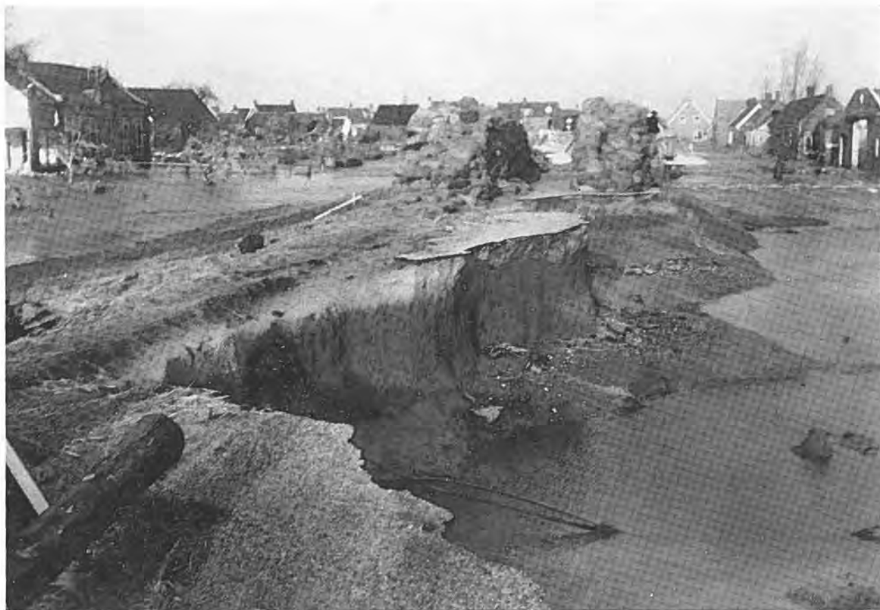
Zo zag de Lavendeldijk er uit op 9 Maart 1953

Van welk een bijzonder verrassend karakter deze ramp ook voor onze omgeving was, blijkt wel uit de omstandigheid, dat, terwijl men dus aan de ene zijde van onze toch niet uitgestrekte gemeente geloofde, dat