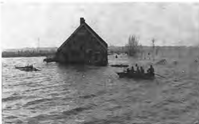
Waar eens een huis stond, vaart thans een boot...

De tweede zwakke schakel was de Valkenissepolder met de aan de Westzijde gelegen Gawegesedijk. Ook deze dijk is betrekkelijk laag en was eveneens blootgesteld aan het, door de Westelijke stormen aangevoerde, hoog oplopende water uit de Waardse polder. Hoewel de toestand van deze dijk niet zo gevaarvol was als die van de hiervoor genoemde polder, mede als gevolg van de bescherming biedende boogaarden en woningen, zo kon toch het water ook tegen deze dijk angstwekkend hoog stijgen. Een doorbraak zou voor Krabbendijke fatale gevolgen hebben gehad, omdat van de tussen de Nieuw-Krabbendijke en Valkenissepolder gelegen — aanmerkelijk lagere — Zuidelijk evenmin veel beveiliging was te verwachten. Het derde zwakke punt in de verdediging van Krabbendijke waren de enige als waterkering fungerende binnendijken van het waterschap Krabbendijke, nl. de Grote Dijk, gelegen tussen de Nieuw-Krabbendijke en de Waardse polder en de Gentmansdijk, gelegen tussen de — tot het waterschap Krabbendijke behorende — Monnikenpolder en de Waardse polder. Aanvankelijk bestond voor deze, in elkaars verlengde gelegen, dijken geen reden tot ongerustheid. Beide dijken bestaan geheel uit klei en hebben een behoorlijke hoogte, nl. respectievelijk 5.10 m en 4.70 m. Het ver-