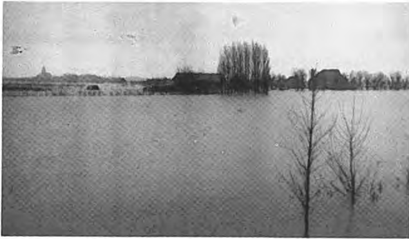
Gezicht vanaf de Zanddijk.