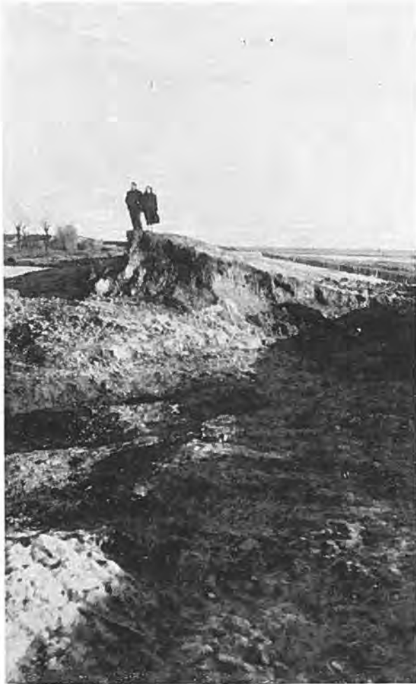
De vernielde zeedijk van de Zimmermanpolder te Rilland.

een moment aan een boompje vast te klampen, doch het water kwam met zo'n enorme kracht opzetten, dat zij weinige ogenblikken later door de woedende golven werden meegesleurd.