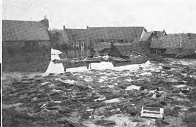
De ravage in Waarde.