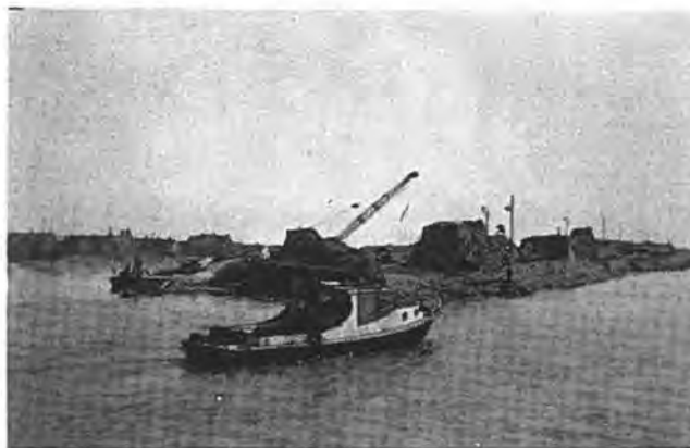
Werkzaamheden aan het gat in de dijk bij Bath.