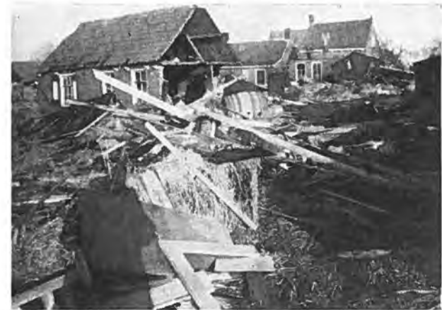
Nog steeds Oostdijk.

In de loop van de morgen en de voormiddag arriveerde de gevluchte bevolking van Waarde. Voor het vervoer