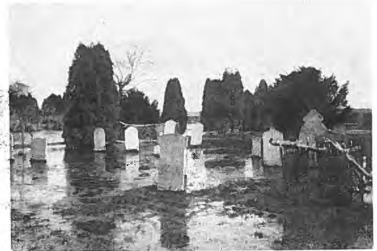
Wat overbleef van het kerkhof te Rilland.

In de laatste dagen van Maart was men met het dichtspuiten van het gat bij Bath zover gevorderd, dat plannen beraamd werden om bij het volgende dode tij op 8 of 9 April de afsluiting tot stand te brengen. Het water in het afgesloten deel van de polder was grotendeels verdwenen. Niet alleen de pompen hadden uitstekend werk verricht, doch ook hevelbuizen waren gemonteerd om het water af te voeren. Het dorp stond droog en vele mensen kwamen bijna dagelijks uit hun evacuatie-oord naar hier om hun huizen moddervrij te maken.