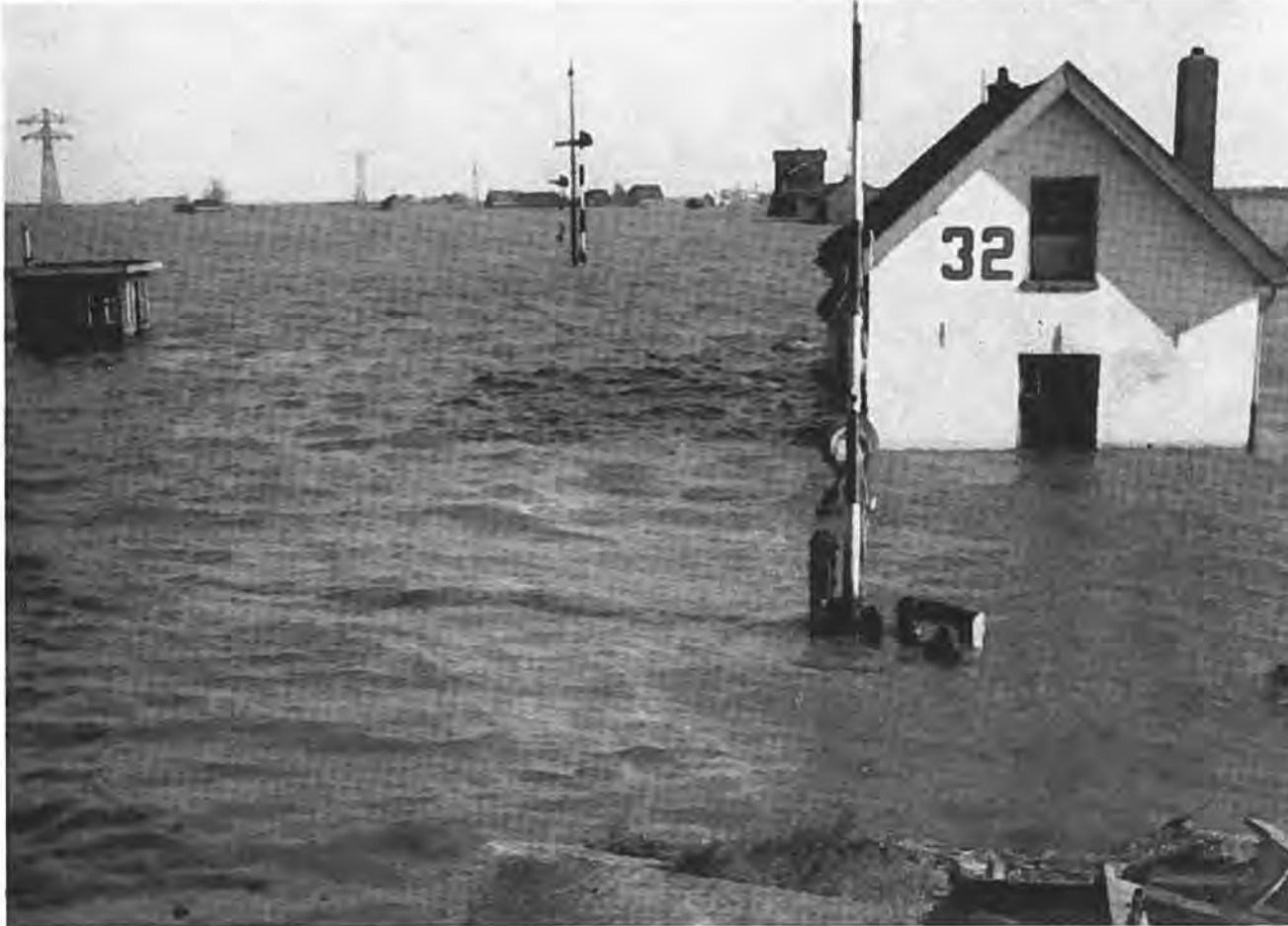
Wachtpost 32 te Kruieningen. Rechts op achtergrond het N.S.-station.