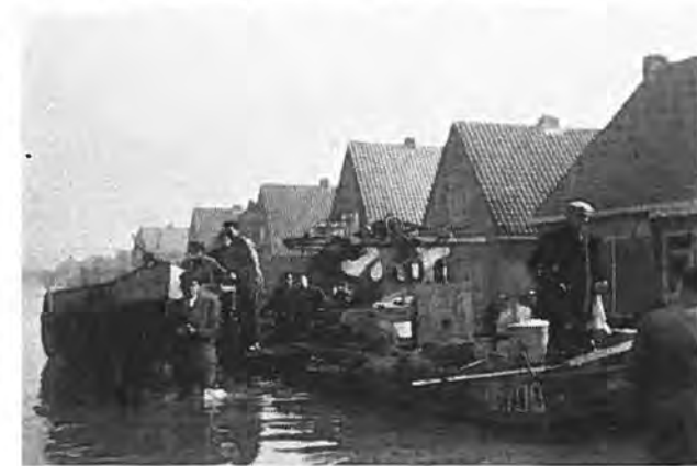
Landbouwmachines, huisraad, alles wordt in sloepen, afkomstig uit Yerseke, geladen.