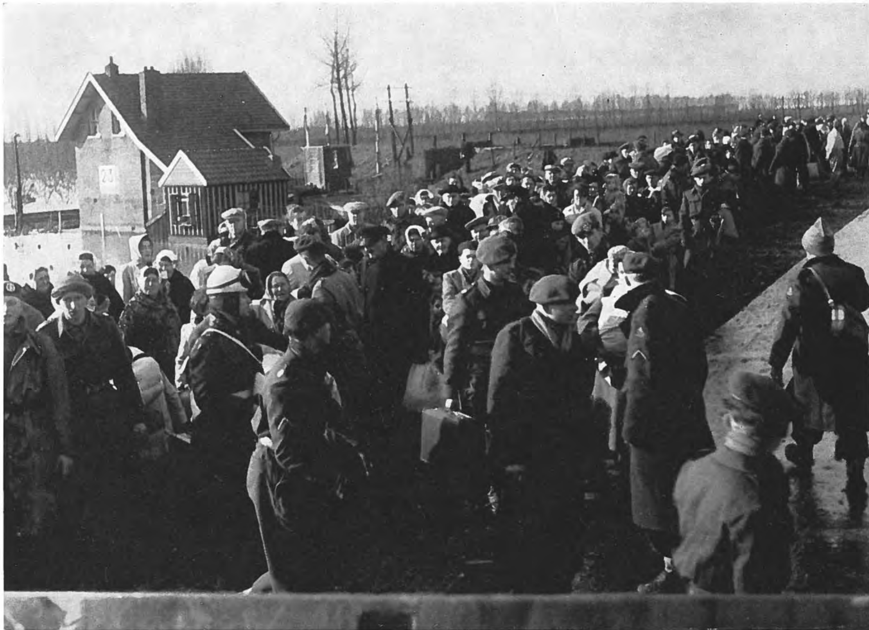
Evacués uit Krabbendijke bij de Langendijk in afwachting van de komst van vervoermiddelen voor verder transport.