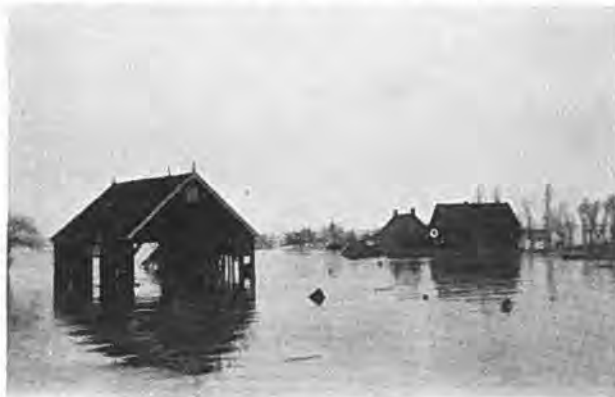
Verwoest en verlaten Oostdijk.