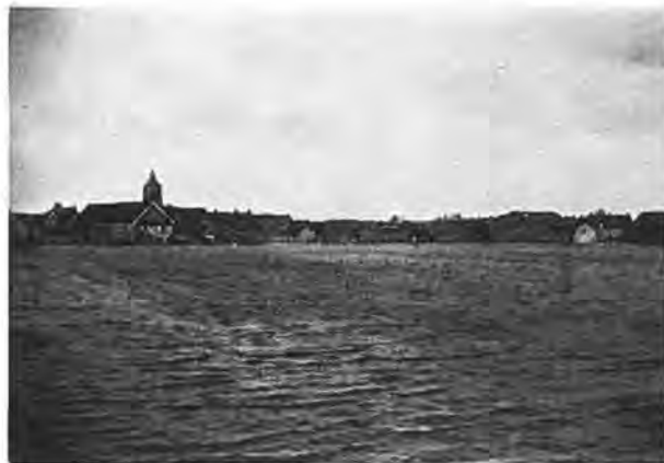
Waarde in de golven.