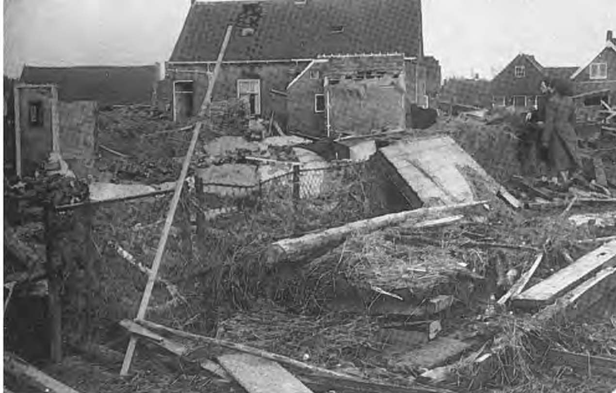
Nog een beeld van de ravage te Oostdijk.

Weliswaar bestond er reden tot grote dankbaarheid, dat ons dorp nog gespaard gebleven was, maar niet