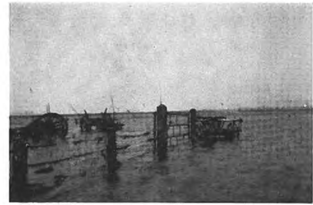
Zeeuwse boerenwagens in het water.

de opgelopen, want slechts drie woningen hebben geen waterschade gekregen. Daarbij komt nog de schade aan vee, want er verdronken o.a. 58 stuks rundvee en 4 paarden, d.i. respectievelijk circa 18 en 4 pct. Zo zijn we dan aan het slot van dit relaas gekomen.