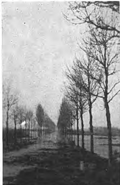
Gezicht op de Rijksweg naar Kruiningen.

herstelwerk en daarbij de meest spoedeisende zaken behandeld, tevens werd een voorlopig urgentie-program opgesteld voor de verder te verrichten werkzaamheden. Deze waren uiteraard vele en velerlei. Het ging niet aan om aan alles tegelijk te beginnen. Daarvoor zou men over een tienmaal groter potentieel de beschikking moeten hebben. Zo werd dan overeen gekomen om voorrang te geven aan het versterken van de Nieuwlandse-binnendijk, vervolgens hetzelfde te doen met de Gawegesedijk, om dan het zwaarste karwei onderhanden te nemen, nl. het voorlopig dichtten van het 40 m lange gat in de zeedijk van de Emmanuelpolder. Dit laatste object, hoewel zeker niet het minst belangrijke, kon niet eerder worden aangepakt, omdat hiervoor te veel mankracht en materiaal zou moeten worden ingezet, wat ten koste zou gaan van de andere noodzakelijke werken.