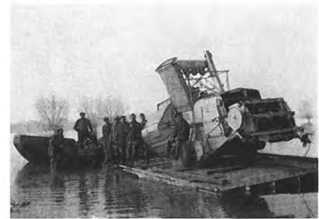
Een landbouwmachine op een vlot.