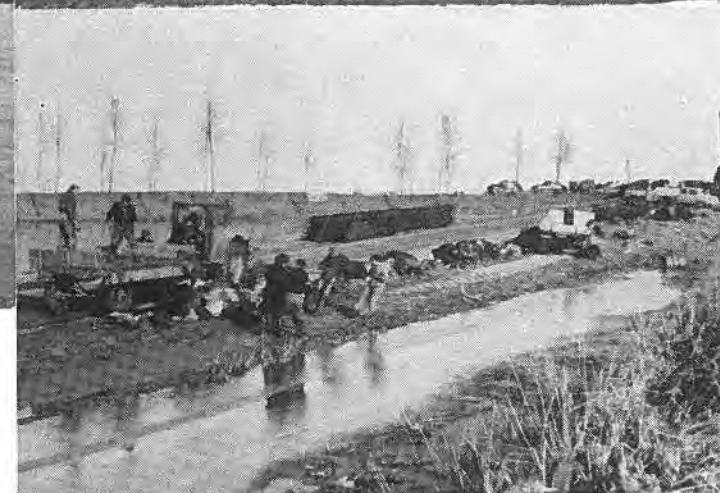
Het stroomgat door de (korte) Vierde Weg.