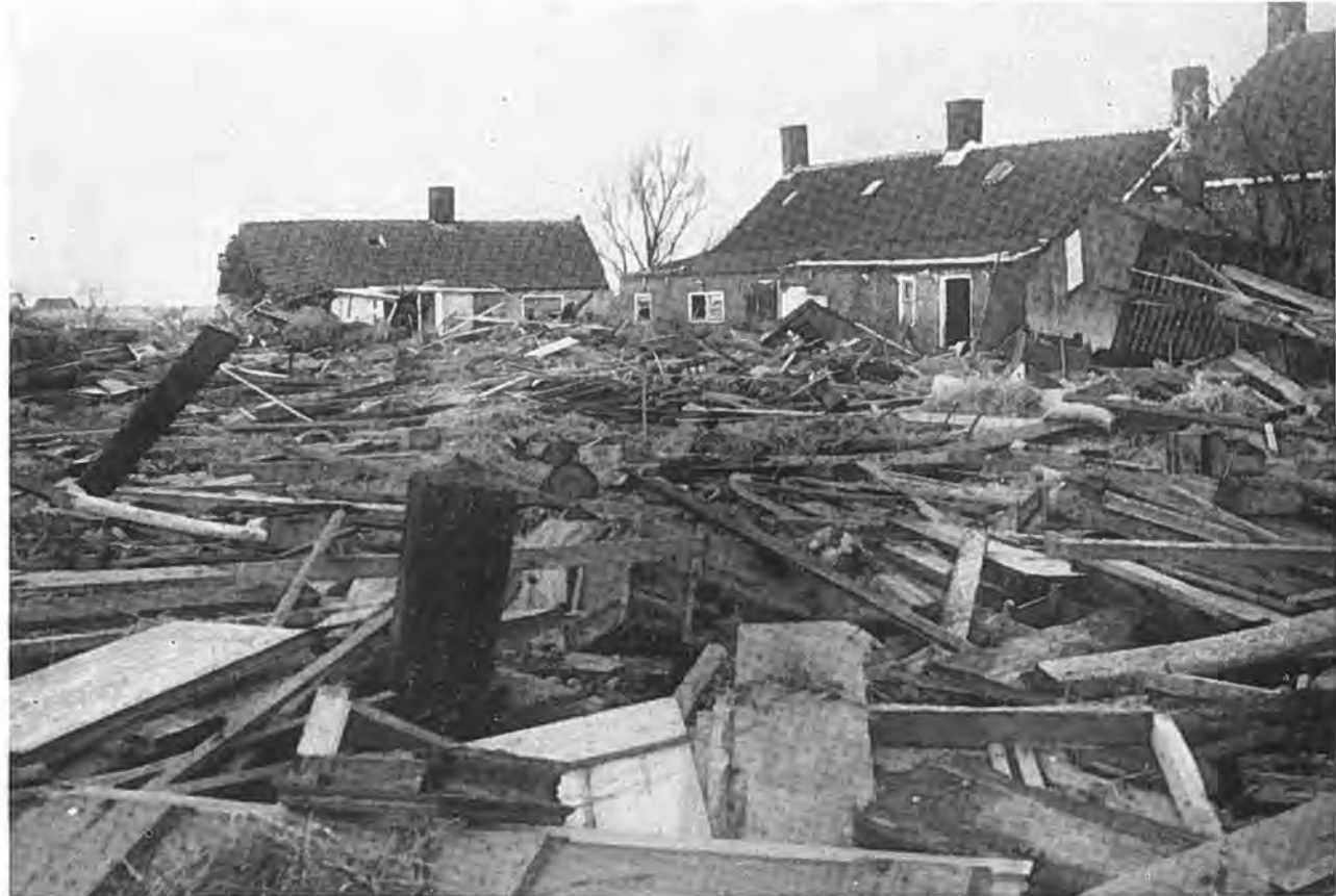
Droef gezicht op Oostdijk.

Intussen hadden echter de voor het leiding geven aangewezen personen, nl. de bestuurders van waterschappen en polders, ook niet stilgezeten. Nadat eerst de meest noodzakelijke maatregelen voor het aanvankelijk behoud van het eigen poldergebied waren getroffen, werd reeds tegen de middag in het gemeentehuis de eerste bijeenkomst gehouden van de dijkgraven der in en in de omgeving van de gemeente Krabbendijke gelegen polders. De meeste van hen bevonden zich in Krabbendijke. Welke de hierbij betrokken polders zijn, werd al eerder vermeld. Op deze bijeenkomst, die het begin was van een voortreffelijke samenwerking tussen de gecombineerde polderbesturen, werd de gehele situatie rond Krabbendijke aan de hand van de van ieder verkregen inlichtingen opgenomen en op een uitvoerige kaart aangegeven. Hierdoor werd een overzichtelijk beeld van het waterfront verkregen. Vervolgens werd besloten om als eerste maatregel voor de verdediging van dit front, alle daarin voorkomende