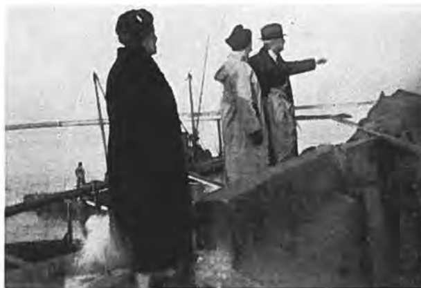
Op de dijk bij Bath.