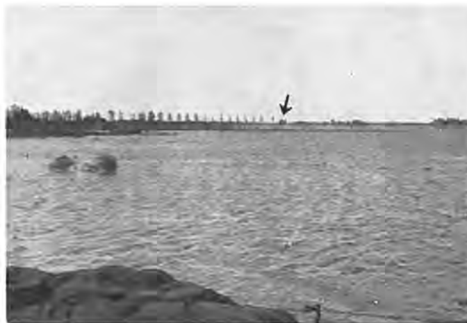
Gezicht op de Kruijningerpolder met (door pijl aangegeven) de drijvende veerboot „Willemsdorp”.

trouwen in deze dijken werd echter in niet geringe mate geschokt, toen begin April een lang aanhoudende stormwind uit Zuidelijke richting grote hoeveelheden wrakhout uit de Waardse polder naar deze dijken dreef. Vooral de Grote Dijk kreeg het daarbij zwaar te verduren. Grote stukken werden, over tientallen meters lengte, uit de voet van deze dijk geslagen en menig een sloeg de schrik om het hart bij het aanschouwen van de vernielingen aan deze enige verdedigingsschans van Krabbendijke. Het gevaar was nl. geheel niet denkbeeldig, dat door het afkalven van de dijkvoet de dijk ter plaatse zou instorten, met alle rampzalige gevolgen voor Krabbendijke van dien. Ook dit onheil werd echter afgewend.