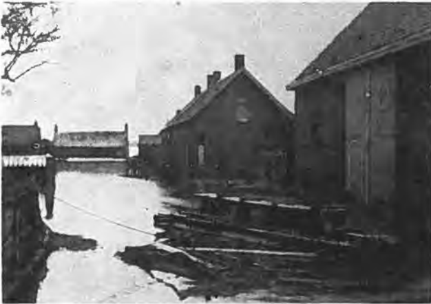
Havenstraat Waarde.

nog tussen 7 en 14 1) , zodat er voor deze oogst nog maar voornamelijk gerst gezaaid wordt.