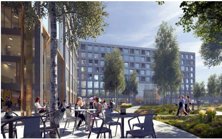
17 feb 2017 - Verkoop in Dialoog stimuleert kwaliteit