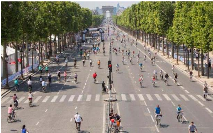
17 feb 2017 - Steeds Meer Steden Autovrij