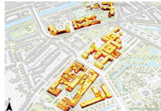
Figuur 3: Zonnepotentieel van Bouwkunde en omliggende gebouwen: de daken van Bouwkunde zijn bijzonder geschikt voor een hoge elektriciteitsopbrengst [Zhou et al. 2021]

Vermoedelijk is er op deze wijze voldoende opwekpotentieel voor de hele energievraag van Bouwkunde. PV-leien zijn nu nog relatief duur, maar gezien de razendsnelle ontwikkelingen op de PV-markt, is te verwachten dat in de tweede helft van de jaren '20 economische varianten op de markt zullen zijn. Aangezien Bouwkunde nu al tot de energetisch best presterende gebouwen van de TU Delft behoort, kan met een dergelijke investering ook nog enkele jaren worden gewacht, terwijl de slecht presterende gebouwen eerst worden aangepakt.