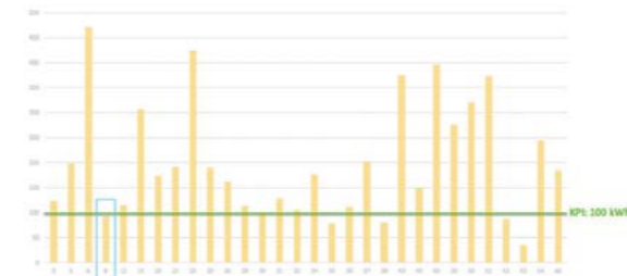
Figuur 1: Energiegebruik in kWh/m 2 van gebouwen op de TU-campus (exclusief datacenters en labs); Bouwkunde is gebouw 8, een van de vijf panden die voldoet aan KPI van maximaal 100 kWh/2 [Blom & Dobbelsteen 2019]