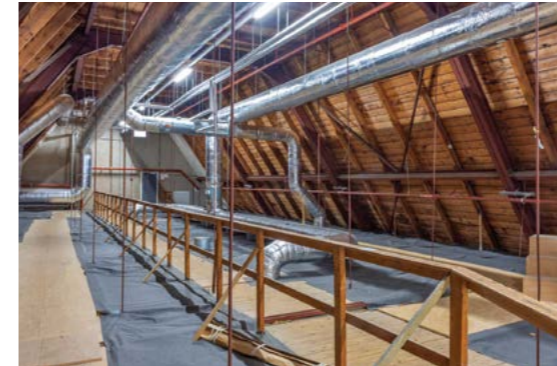
Figuur 2: Zolder van Bouwkunde, op dit moment, gebruikt voor ventilatiekanalen, met isolatie op de vloer en geïsoleerd dakbeschoot waarop leien liggen.

Een andere mogelijke energiebesparingsmaatregel op termijn betreft de zonneschermen. Die blijken wat betreft een aantal aspecten niet goed te werken: ze verduisteren vooral (waardoor meer kunstverlichting nodig is) en houden warmte vast tussen scherm en raam, waardoor bij het openzetten van het raam extra warmte binnenkomt. Bedienbare lamellen of louvers (in nieuwe versie wellicht met zonnecellen) zouden effectiever zijn.