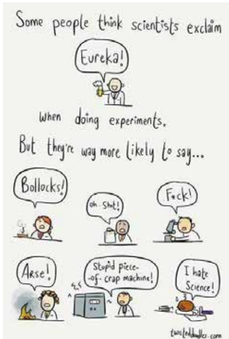
Figuur 3. Wetenschappers doen heel andere uitspraken bij een nieuwe ontdekking.