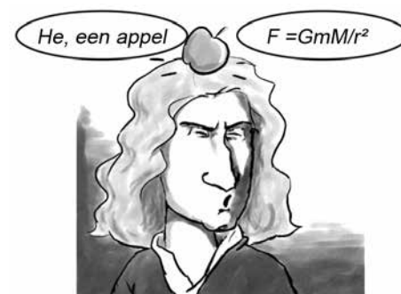
Figuur 2. Welk uitspraak van Newton is waarschijnlijker?

Onder wetenschappelijk geletterdheid valt onder andere begrip over hoe wetenschappelijke kennis tot stand komt.