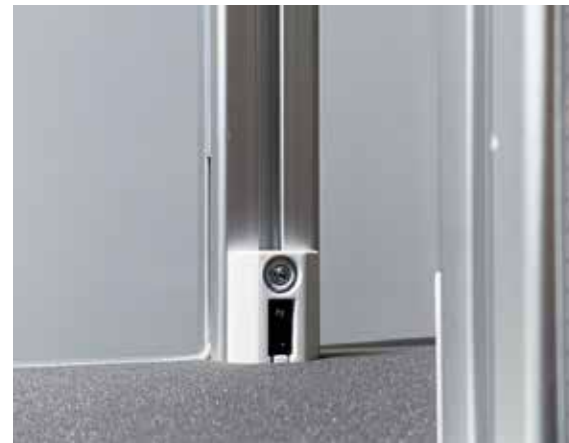
Figuur 6. De valtijd geregistreerd door breakbeam-sensoren, een combinatie van een IR-led en fotodiode.

In het eerstejaarspracticum op de TU Delft krijgen de studenten de opdracht om het vierde significante cijfer van g te bepalen, en dat binnen een foutmarge van 0.1% van de bekende waarde in Delft: 9.812 \text{ m/s}^2 . Het enige dat de studenten verder aan voorschrift krijgen is de basisformule: y = v_0 t + 1/2 g t^2