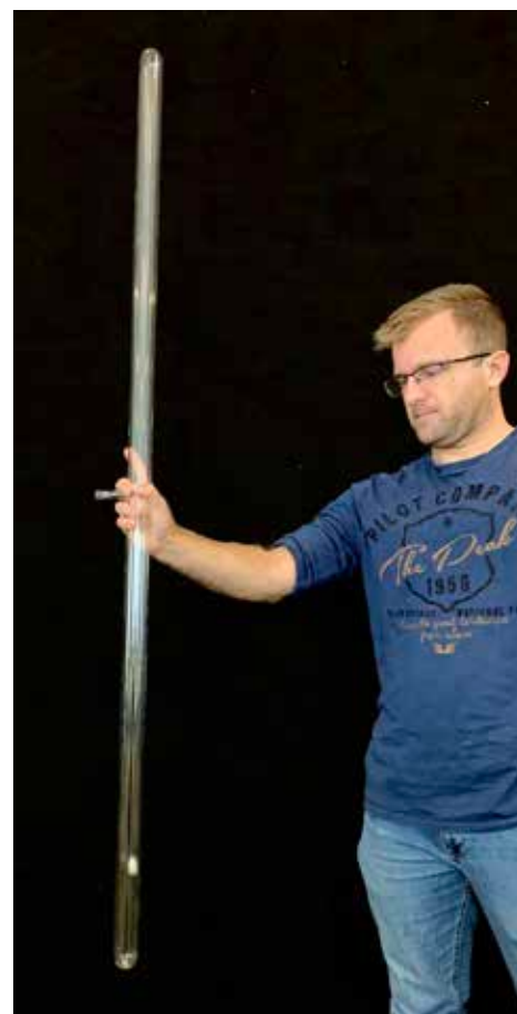
Figuur 1. In de onderbouw wordt een kwalitatieve demoproef gedaan.

Om uitspraken van leerlingen te ontlocken, kunnen conceptcartoons, zoals in figuur 2 ingezet worden (Berg, 2015). Leerlingen zullen inzien dat er nog een behoorlijk proces zit tussen het doen van een observatie en daaruit een algemene theorie afleiden, zie figuur 3. Dit ‘experiment’ staat dan in het teken van kennisonwikkeling van de aard van wetenschap (Nature of Science) en het bevorderen van wetenschappelijke geletterdheid, de algemene natuurwetenschappelijke kennis die het grote publiek nodig heeft (Osborne, 2000).