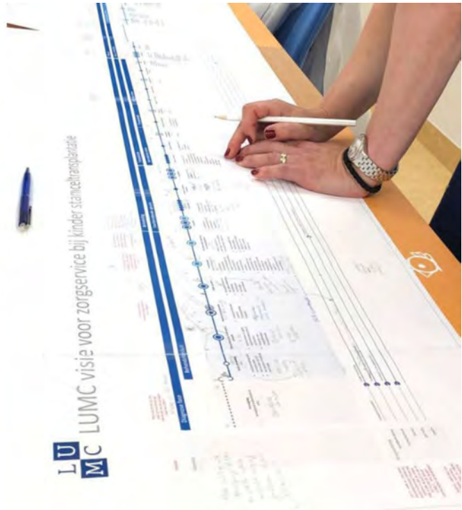
Afbeelding 2. Co-creatie van gedeelde besluitvorming met zorgprofessionals met behulp van de Metro Map.

Metro Mapping in andere zorgpaden onderzocht worden. In Nederland is de methode reeds toegepast voor het zorgpad bij COVID-19. Op internationaal niveau zal de implementatie van Metro Mapping ook onderzocht worden, onder andere in het '4D PICTURE'-project, gefinancierd door Horizon Europe. In dit project, waarbij verschillende Europese partners betrokken zijn, zal Metro Mapping uitgangspunt zijn voor de ontwikkeling en implementatie van datagedreven beslissingsondersteuning in de oncologie en daarmee ook zelf als service design-methode verder ontwikkeld worden.