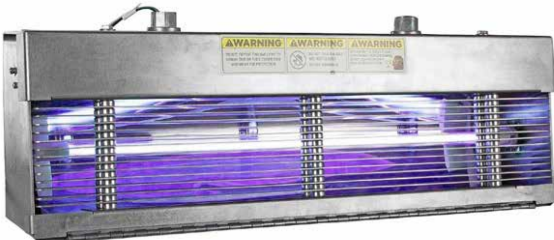
1. uv-c-wandarmatuur met lamellen die het uv-c-licht op het plafond richt (Larson Electronics).

Tekst: dr.ir. C.P.G. (Paul) Roelofsen, Well AP, Industrial design engineering, TU Delft