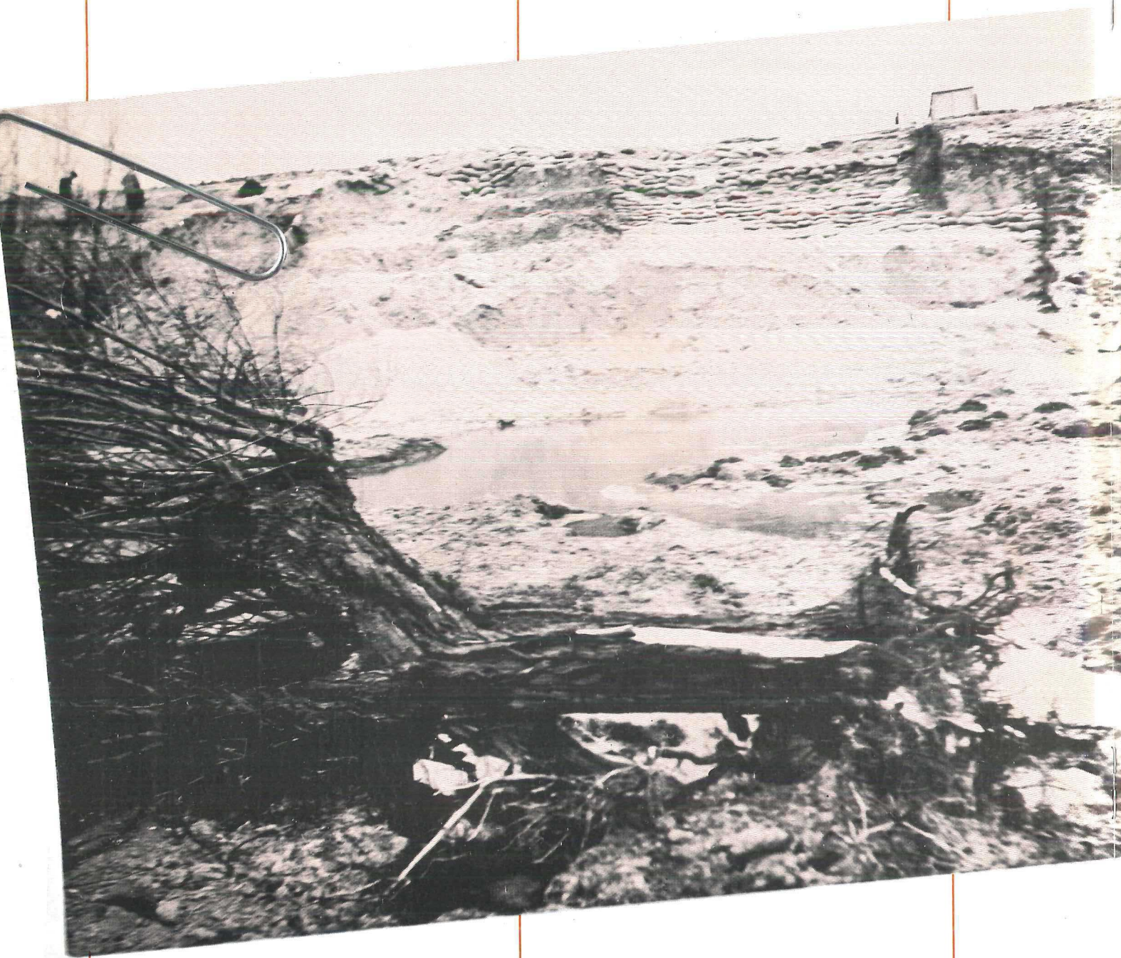
Plaats van de doorbraak vanuit de polder gezien.