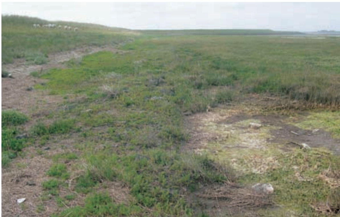
Foto 38 Proefstrook 30, Dortsman: een duidelijke strook met afwijkende begroeiing. Het is in het veld moeilijk te zeggen of de afwijking komt door de aanwezigheid van veek of dat het een effect is van de werkstrook (volgens luchtfoto's wel).