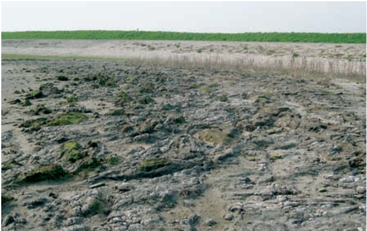
Foto 21 Proefstrook 13, Biezelingse Ham: vergraven schor is gevoeliger voor erosie. Door het vergraven is het verband weg en spoelen zandige delen makkelijker weg en blijven er hompen klei, afgerond door erosie, over.