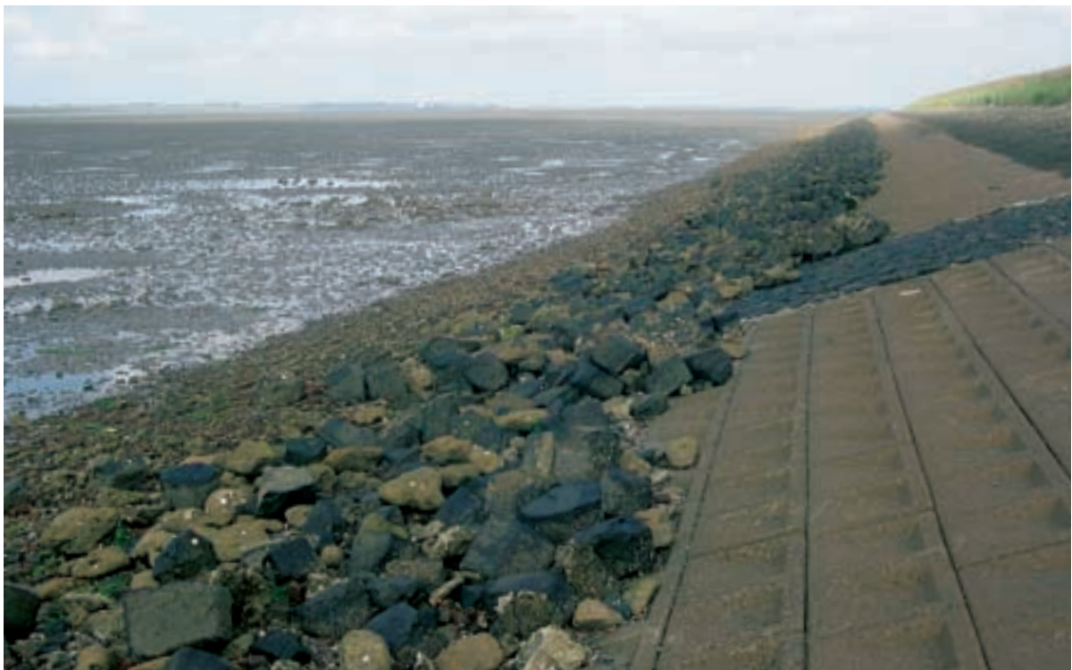
Foto 37 Proefstrook 36, Dortsman: het slik grenzend aan de dijk lijkt over een strook van 20 meter natter en er liggen hier en daar stenen op het slik. Kreukelberm netjes binnen properties.