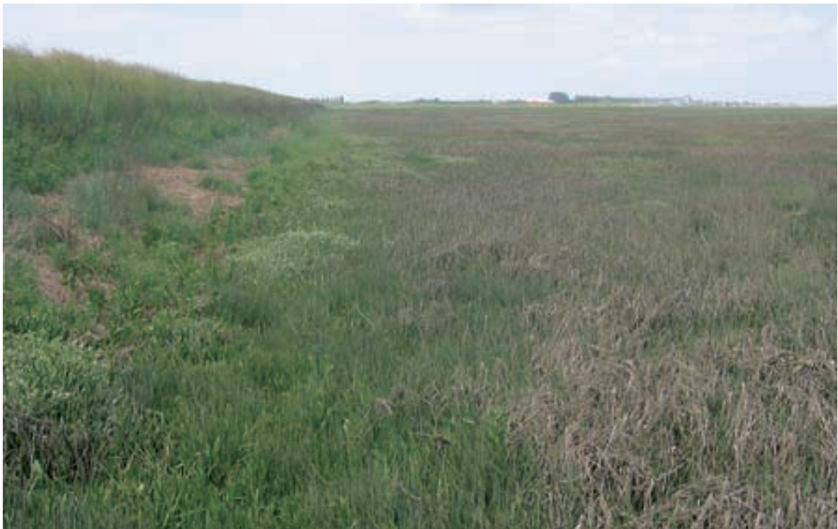
Foto 41 Proefstrook 32, St. Annaland: geen effect, schor loopt volledig door toe aan dijkvoet.