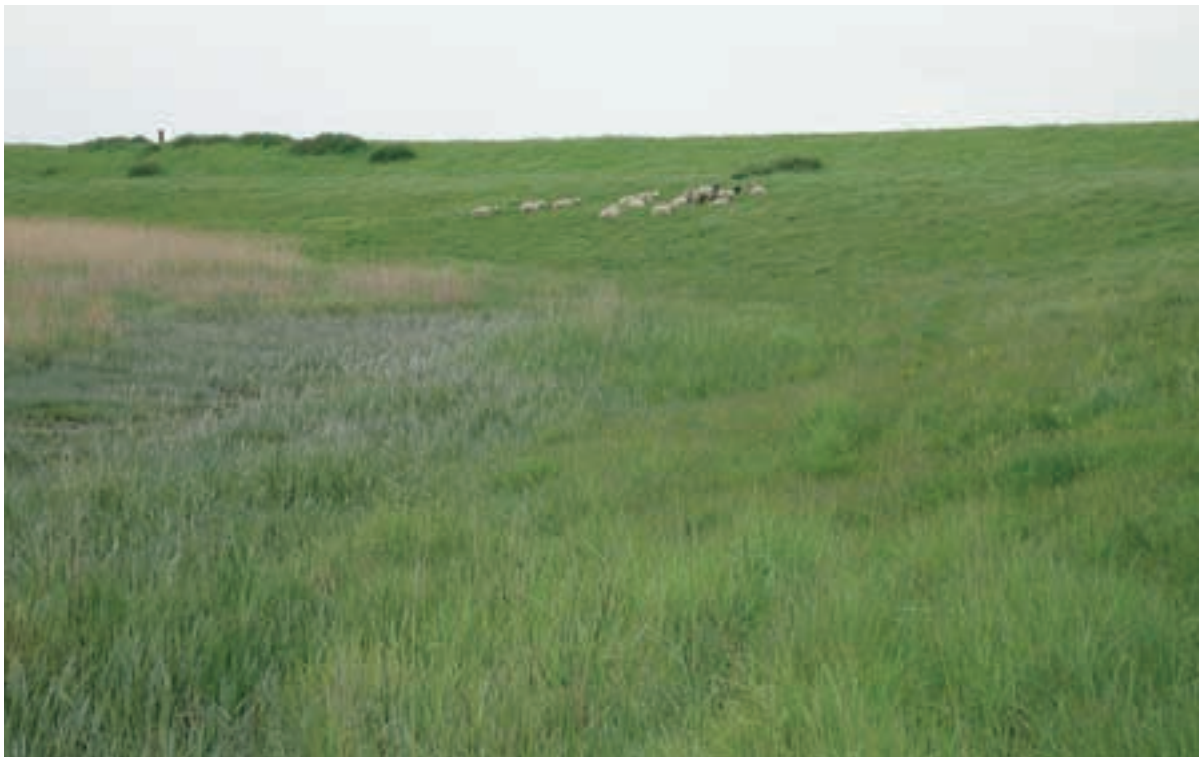
Foto 45 Proefstrook 35, Van Alsteinpolder: een vloeiende overgang van schor naar dijk; geen werkstrook zichtbaar.