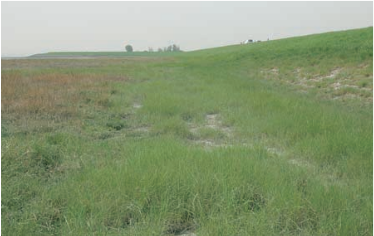
Foto 16 Proefstrook 8: Baarlandpolder; door hogere afwerking van werkstrook ontstaat een afwijkende vegetatie parallel aan de dijk, in dit geval gedomineerd door Strandkweek.