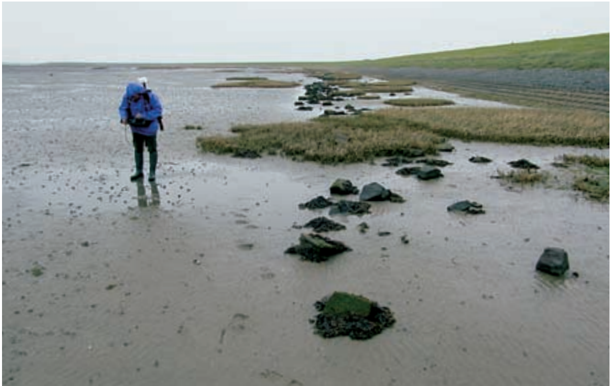
Foto 40 Proefstrook 31, Philipsland: Spartina-pollen lijken zich na de werkzaamheden ontwikkeld te hebben.