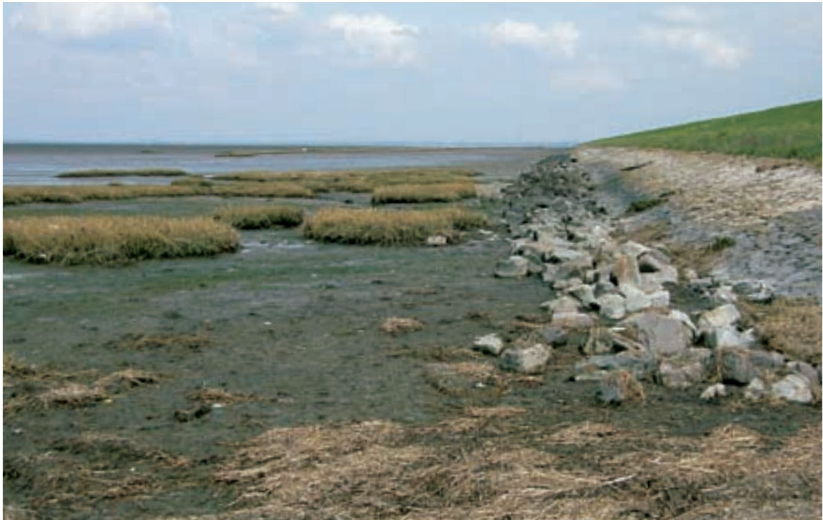
Foto 36 Proefstrook 27, Rattekaai: slik met een keurige smalle strakke kreukelberm en zonder stenen op het slik.