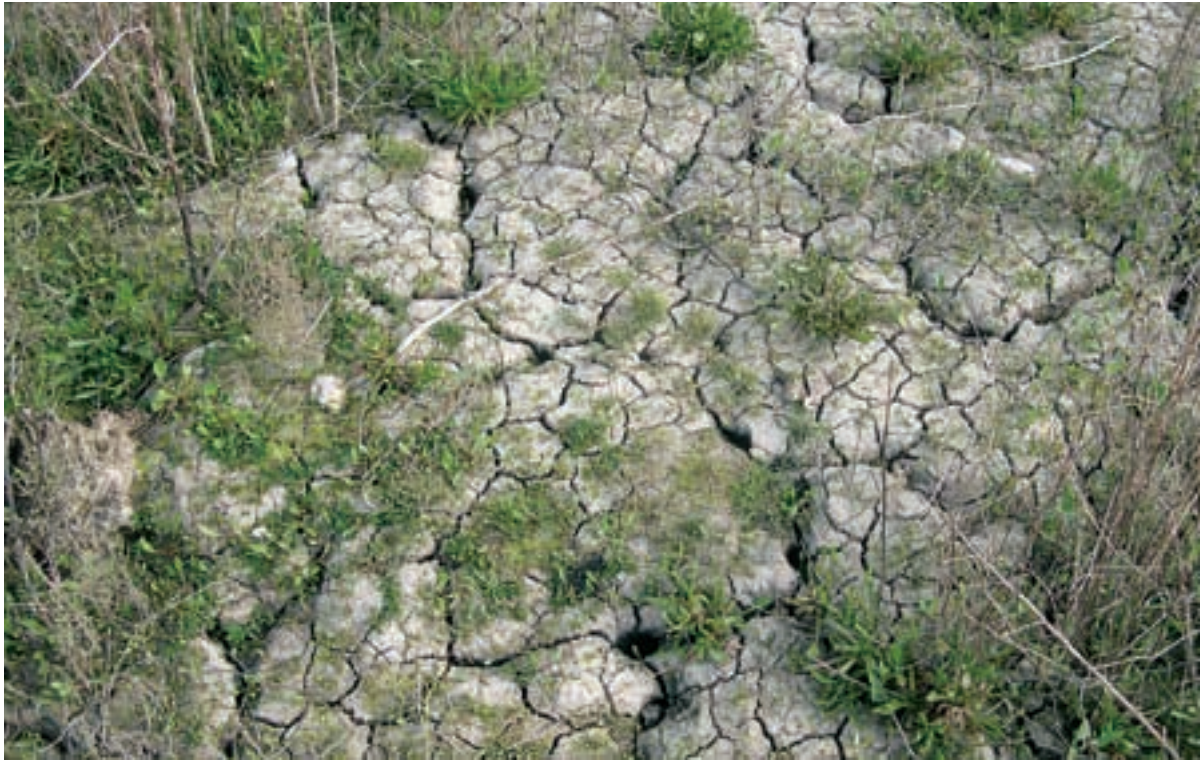
Foto 20 Proefstrook 13, Biezelingse Ham: krimpscheuren door verdroging van het schor, door het vergraven is de grond beter waterdoorlatend, waardoor sneller verdroging optreedt.