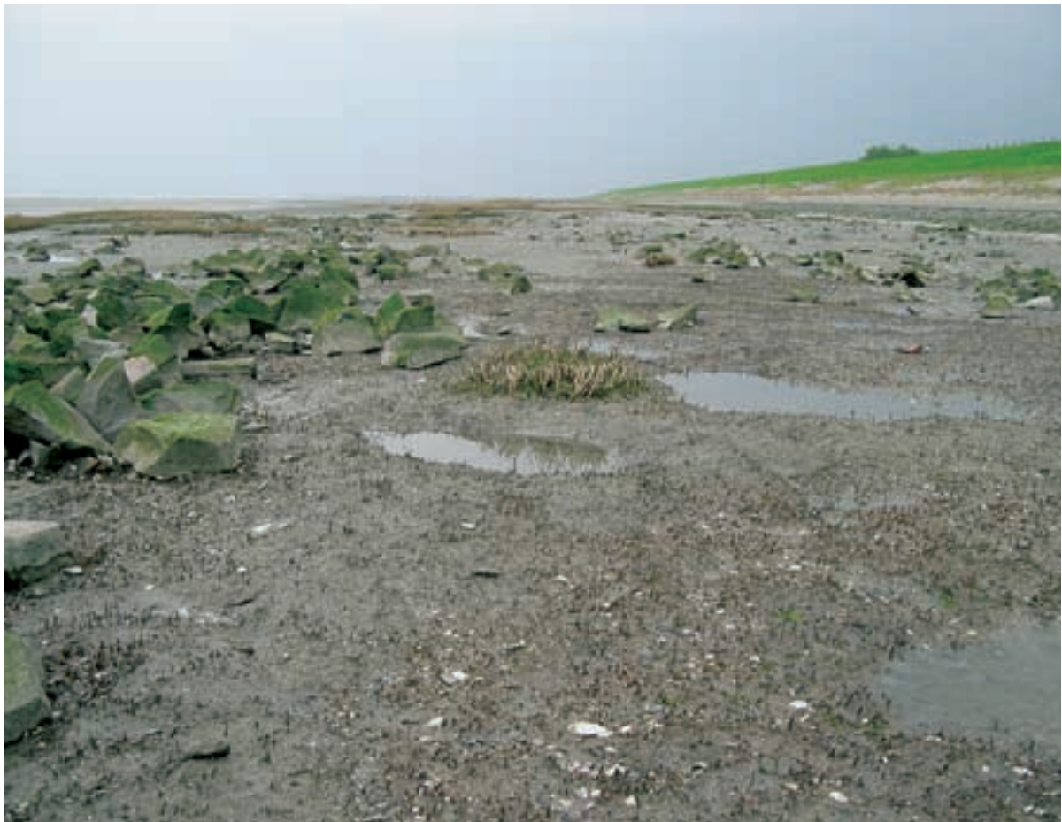
Foto 13 Proefstrook 6: Baalhoek; dode wortelrestanten van Spartina-begroeiing die bedolven is geweest onder klei en stenen.