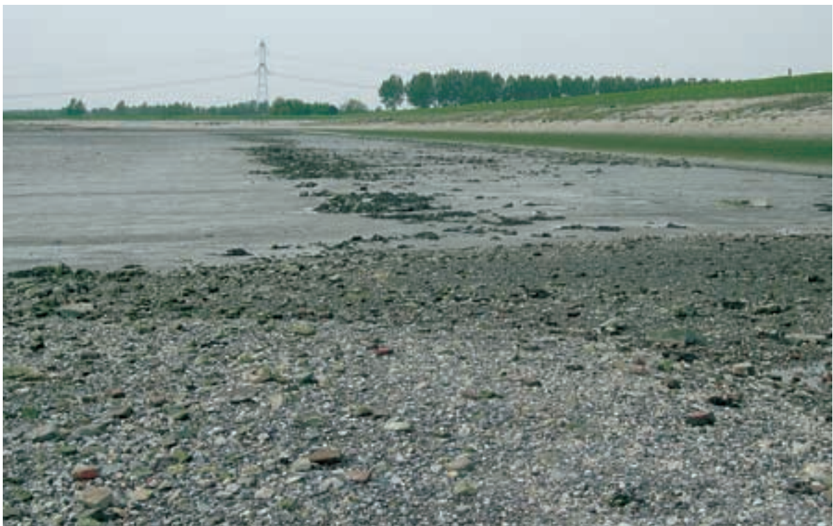
Foto 25 Proefstrook 15 met 16 op achtergrond, Biezelingse Ham: stenen op het slik (herkomst stenen onbekend).