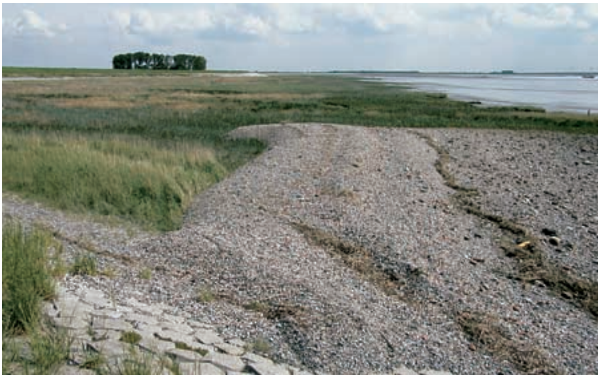
Foto 31 Proefstrook 24, Zimmermanpolder: steenslag waarmee de dijk is afgestrooid spoelt van de dijk en verzamelt zich hier op het schor als een soort van strandhaak.