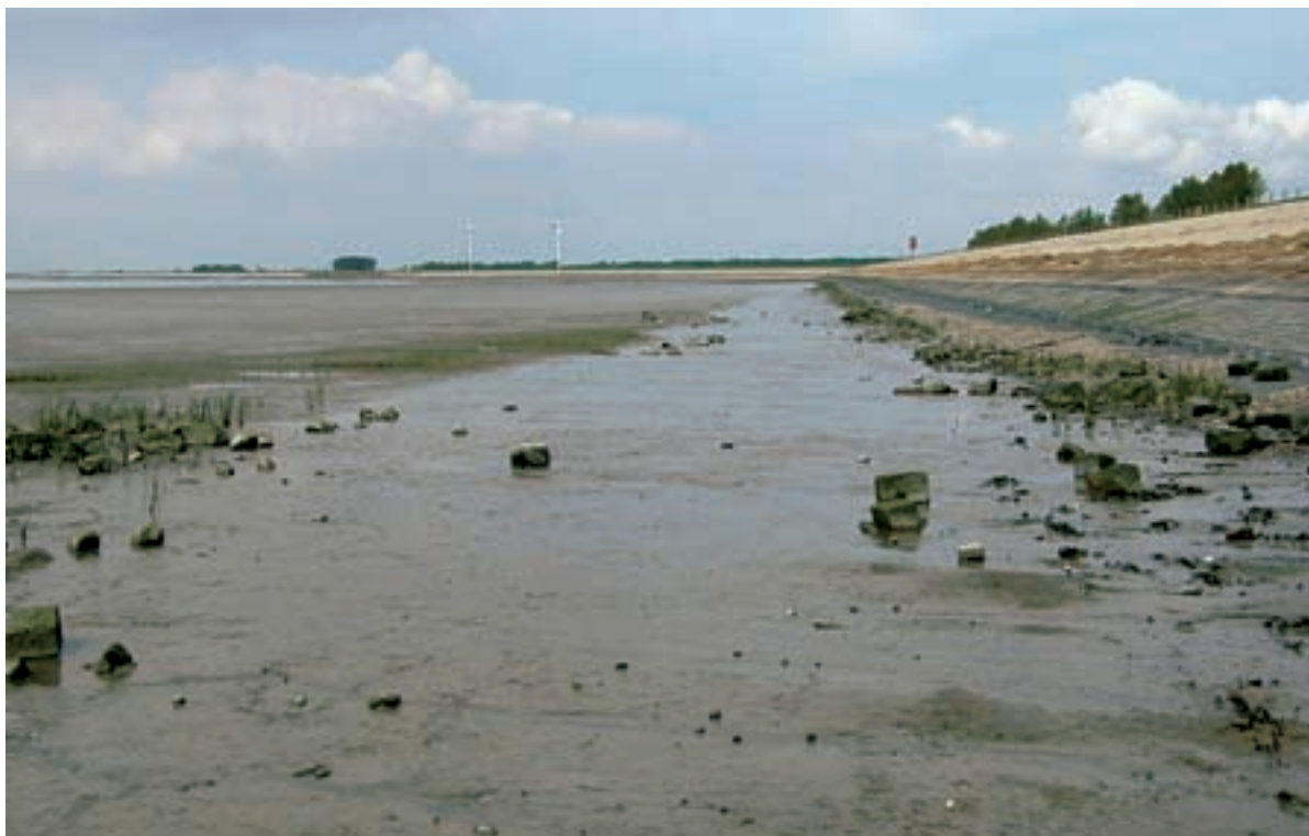
Foto 34 Proefstrook 26, Paviljoenpolder: een duidelijk nattere baan loopt parallel aan de dijk, dit lijkt een effect van de werkstrook te zijn maar wordt waarschijnlijk veroorzaakt door uittredend water aan de voet van de dijk.