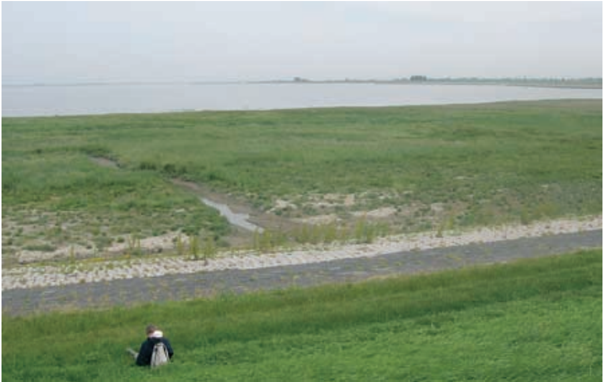
Foto 10 Overzicht proefstrook 3 (rechts) en 4 (links): Hellegatpolder; duidelijk is de brede werkstrook te herkennen in de vegetatie van het schor.