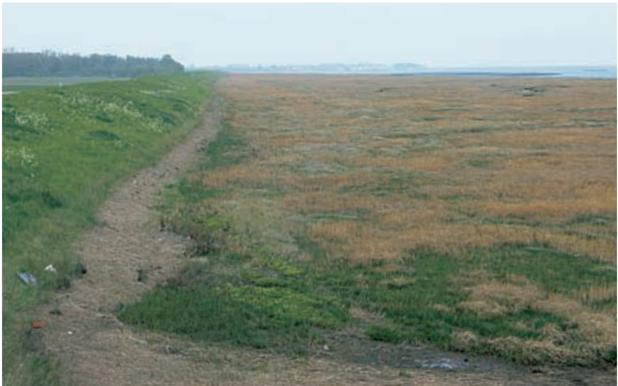
Foto 43 Proefstrook 33, Schor van Rumoirt: de fijnere structuur in de vegetatie langs de dijk is een mogelijk gevolg van de voormalige werkstrook.