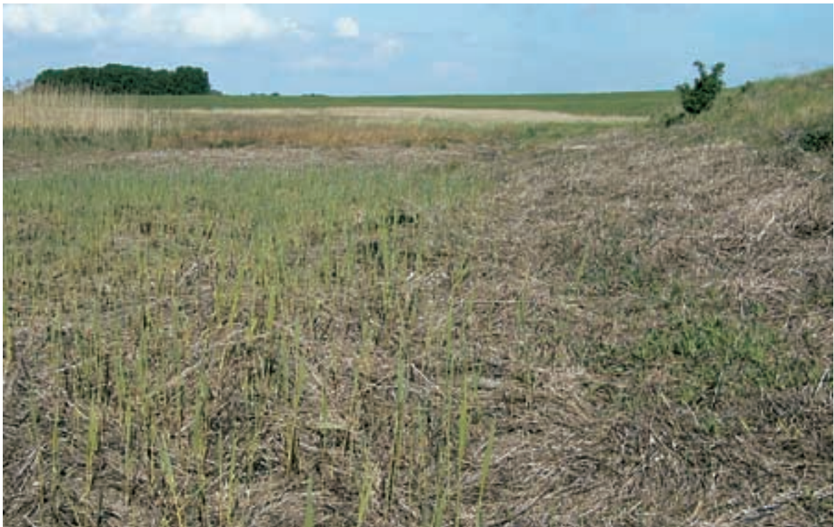
Foto 29 Proefstrook 21, Zimmermanpolder: de aanwezigheid van veek kan eventuele effecten bedekken.