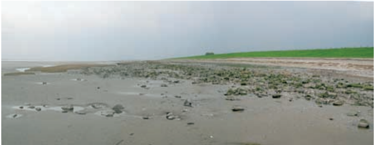
Foto 12 Proefstrook 6: Baalhoek: grote hoeveelheden stenen op voormalig primair schor tot wel 20 meter uit de dijkvoet.