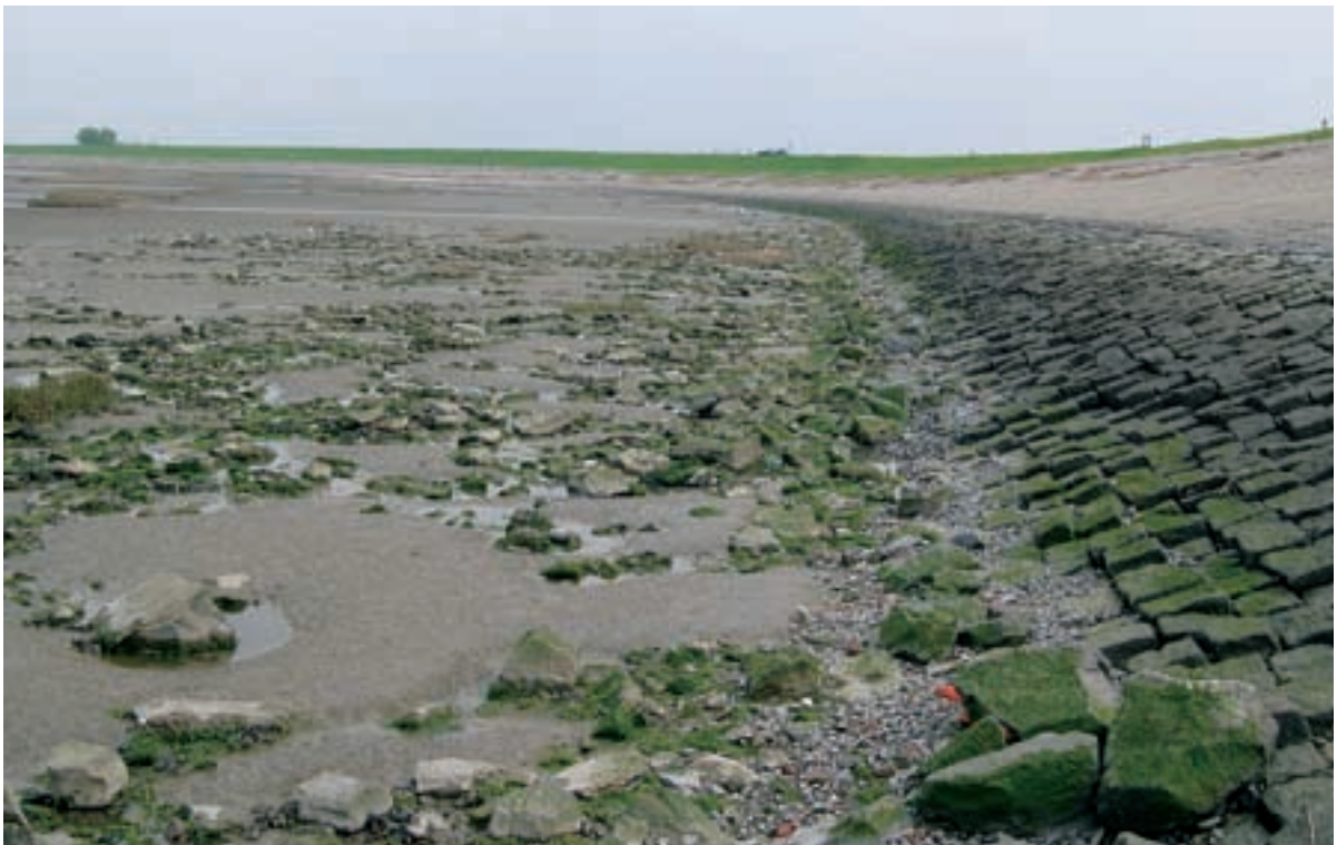
Foto 11 Proefstrook 5: Baalhoek; breed uitgewaaierde (15 meter) kreukelberm op het slik.