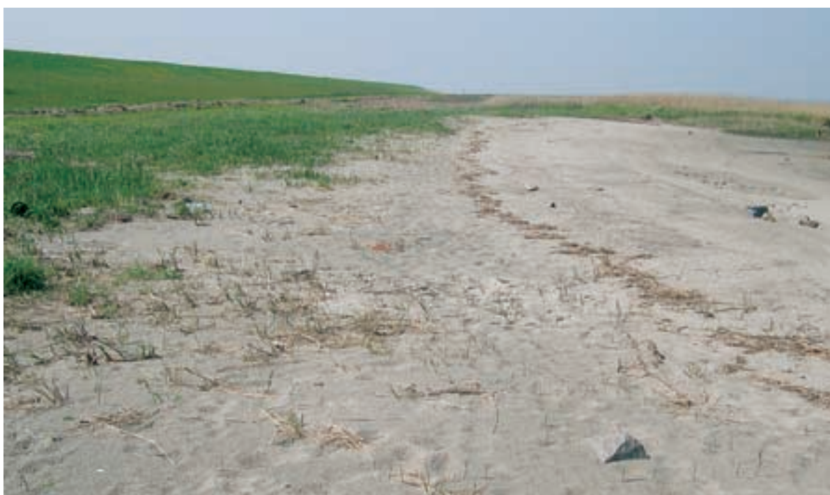
Foto 7 Proefstrook 2 Hellegatpolder; door smalle strook schor geen vergelijking mogelijk, de gecreëerde overgang oogt natuurlijk, mede door aanzanding.