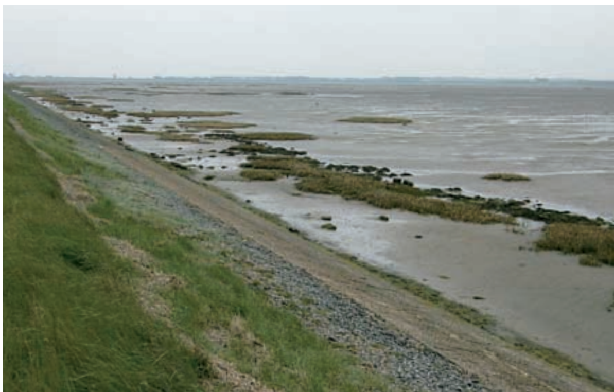
Foto 39 Proefstrook 31, Philipsland: op 8 meter uit de teen van de dijk een duidelijke strook met stenen.