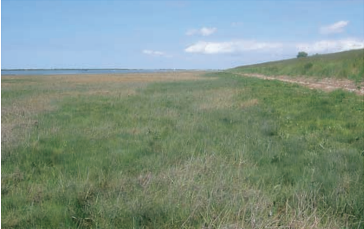
Foto 44 Proefstrook 34, schor van Rumoirt: langs de dijk heeft de vegetatie over een breedte van ongeveer 15 meter een andere samenstelling dan de rest van het schor.