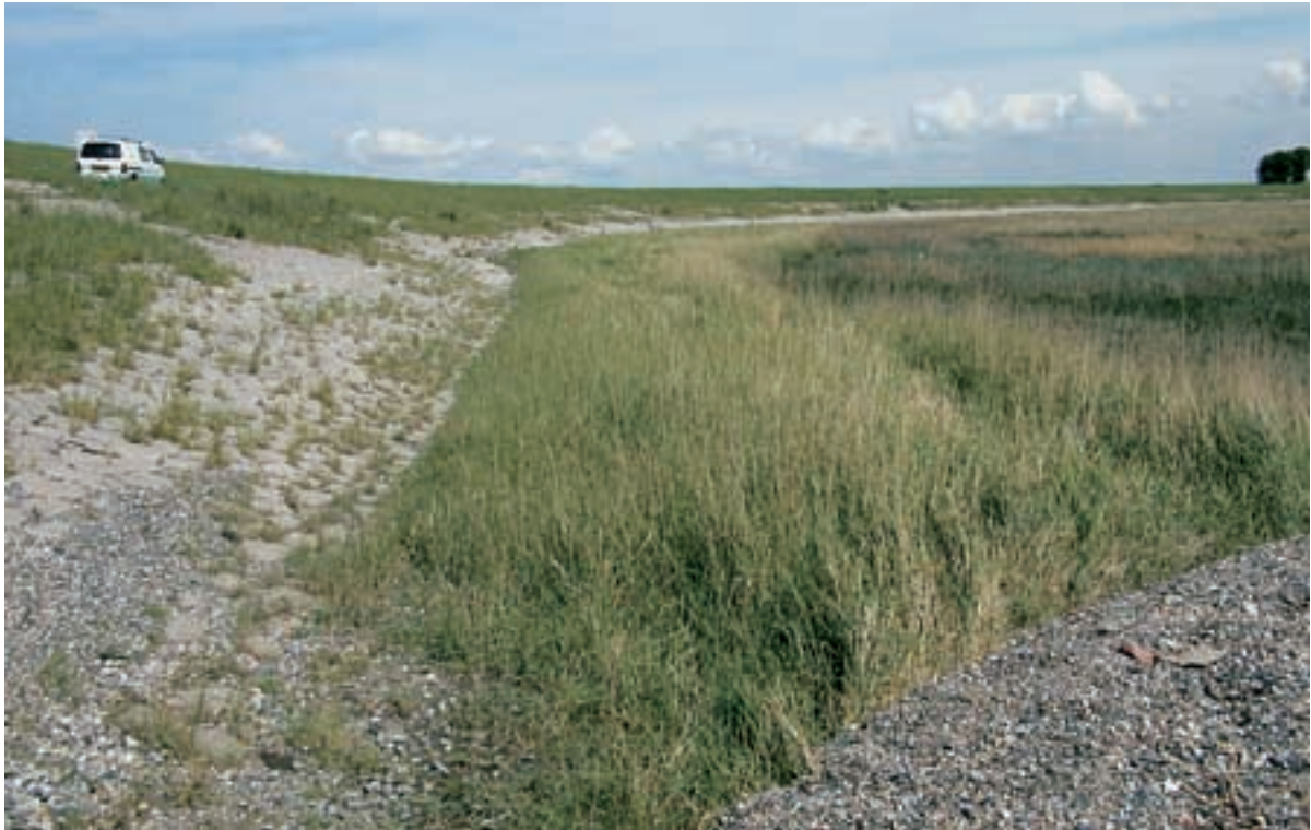
Foto 32 Proefstrook 24, Zimmermanpolder: duidelijke band van afwijkende vegetatie langs de dijk, dit is een gevolg van het hoger afwerken van de werkstrook; deze ligt zeker meer dan 15 cm hoger dan het originele schor.