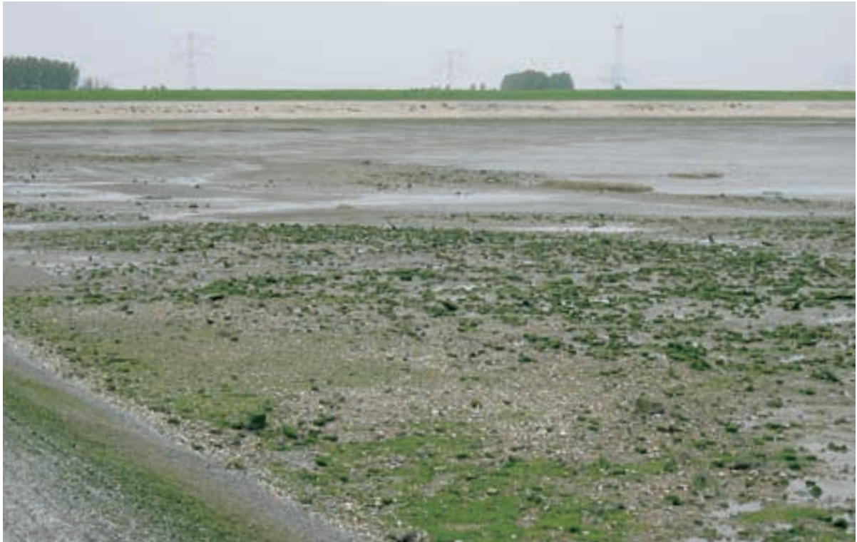
Foto 22 Proefstrook 14, Biezelingse Ham: op een paar kleine plekjes na is het primaire schor hier verdwenen en vervangen door een met stenen bezaaid slik.