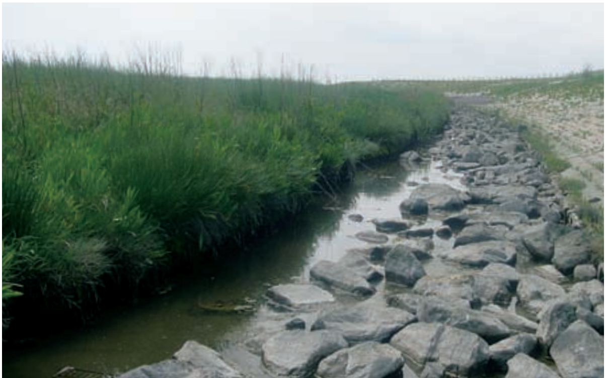
Foto 27 Proefstrook 19, Waarde-west: keurig smalle werkstrook van 2 meter waardoor een geul in het schor is gespaard: de werkstrook is niet weer afgedekt met de uitgegraven grond, onbekend is waar deze (verontreinigde) grond gebleven is.