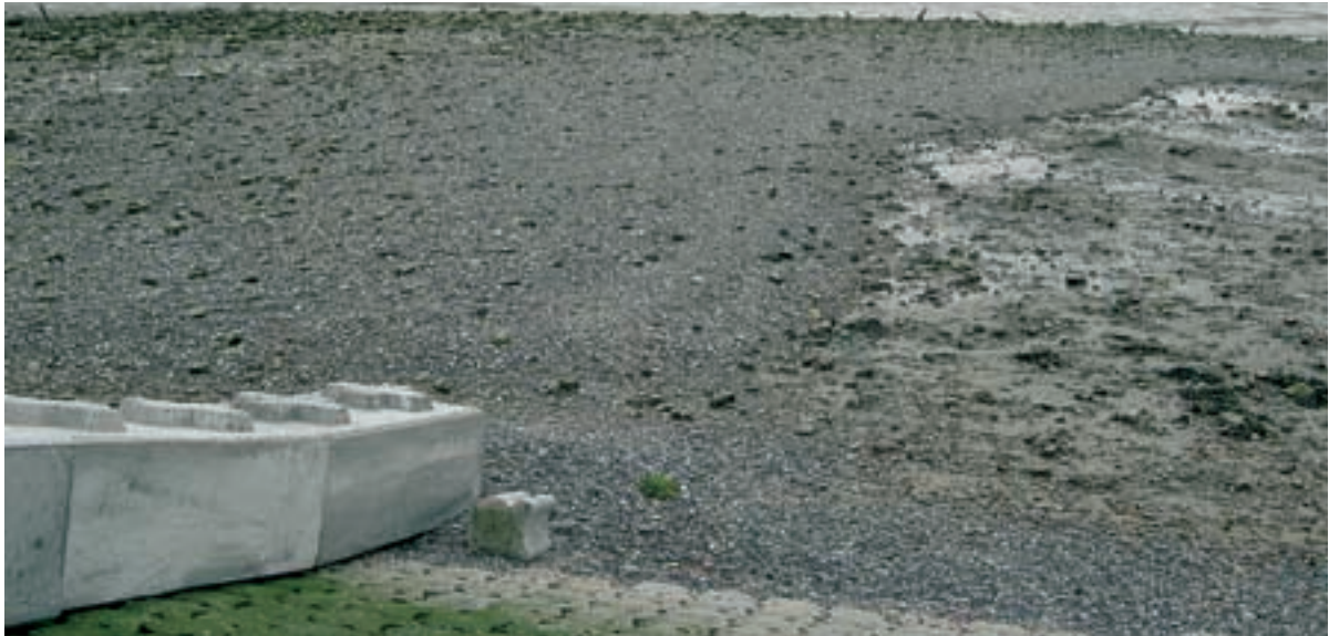
Foto 24 Proefstrook 15 (foto) en 17, Biezelingse Ham: Over een brede strook is het slik volledig bedekt met stenen (herkomst stenen onbekend).