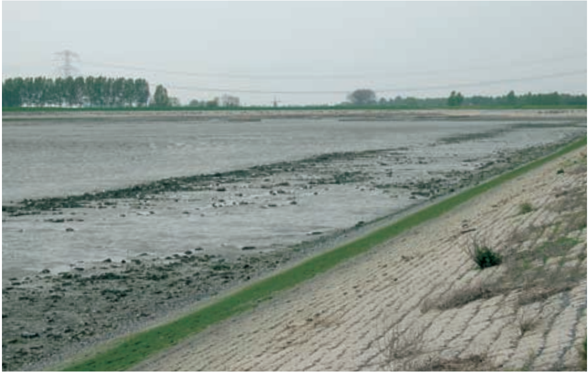
Foto 26 Proefstrook 16, Biezelingse Ham: een duidelijke band met stenen op het slik 25 meter uit de dijkvoet; waarschijnlijk heeft hier de uitgegraven grond gelegen waarin stenen van de kreukelberm hebben gezeten. Een deel van de stenen is na het terugzetten van de grond achtergebleven.