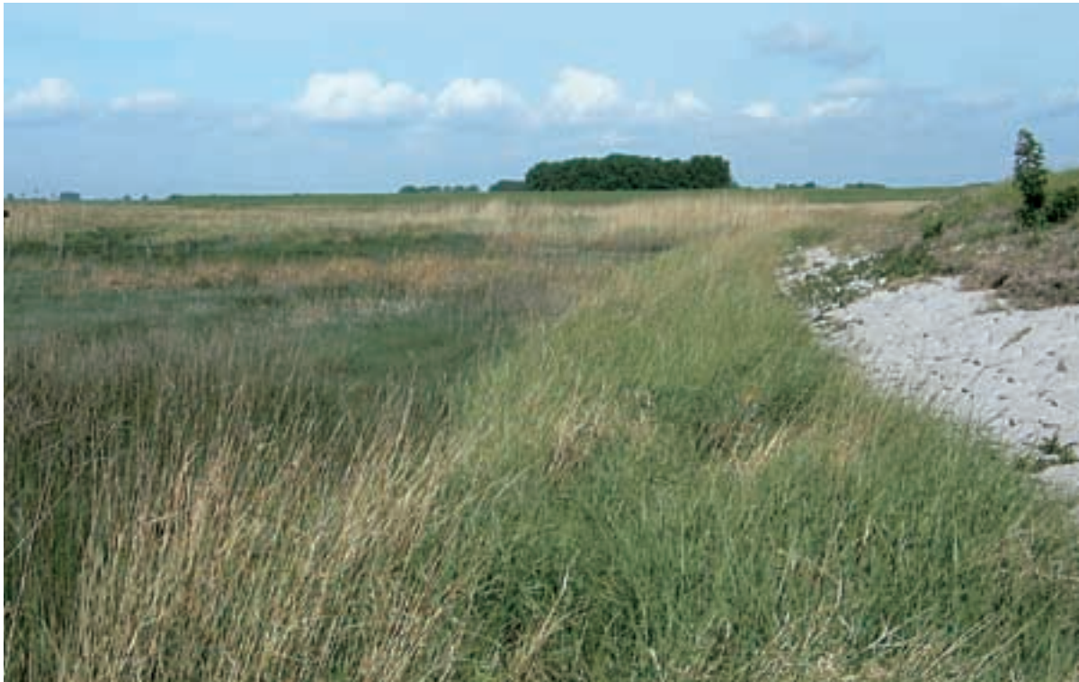
Foto 30 Proefstrook 22, Zimmermanpolder: geen zichtbare werkstrook, de strook strandkweek groeit al op de aanzet van de dijk.