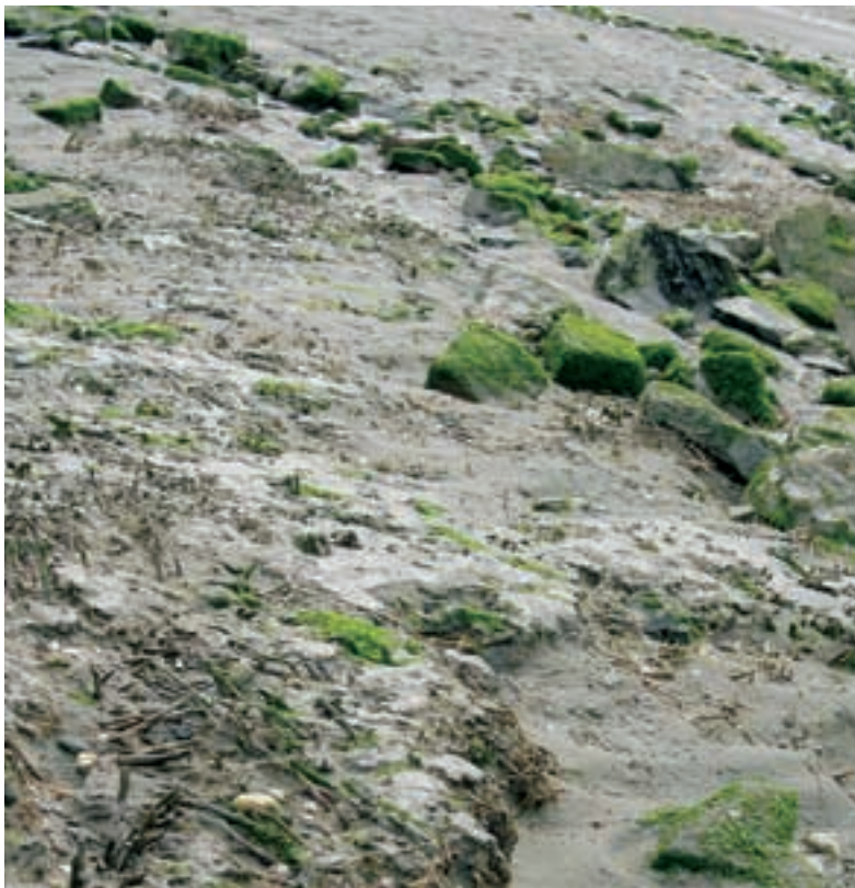
Foto 23 Proefstrook 14, Biezelingse Ham: wortelresten van Spartina geven aan dat er een primair schor geweest is.