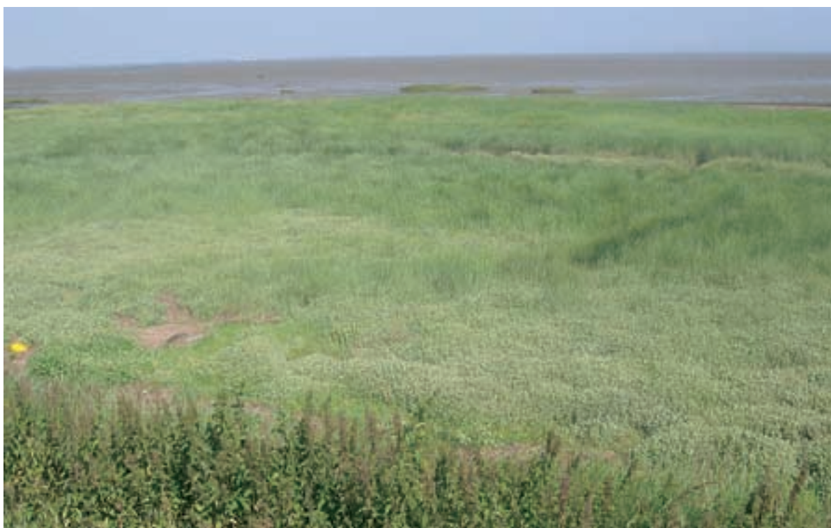
Foto 35 Proefstrook 28, Rattekaai: een afwijkende strook met veel Gewone zoutmelde volgt de dijk, onduidelijk wat hier de oorzaak van kan zijn.