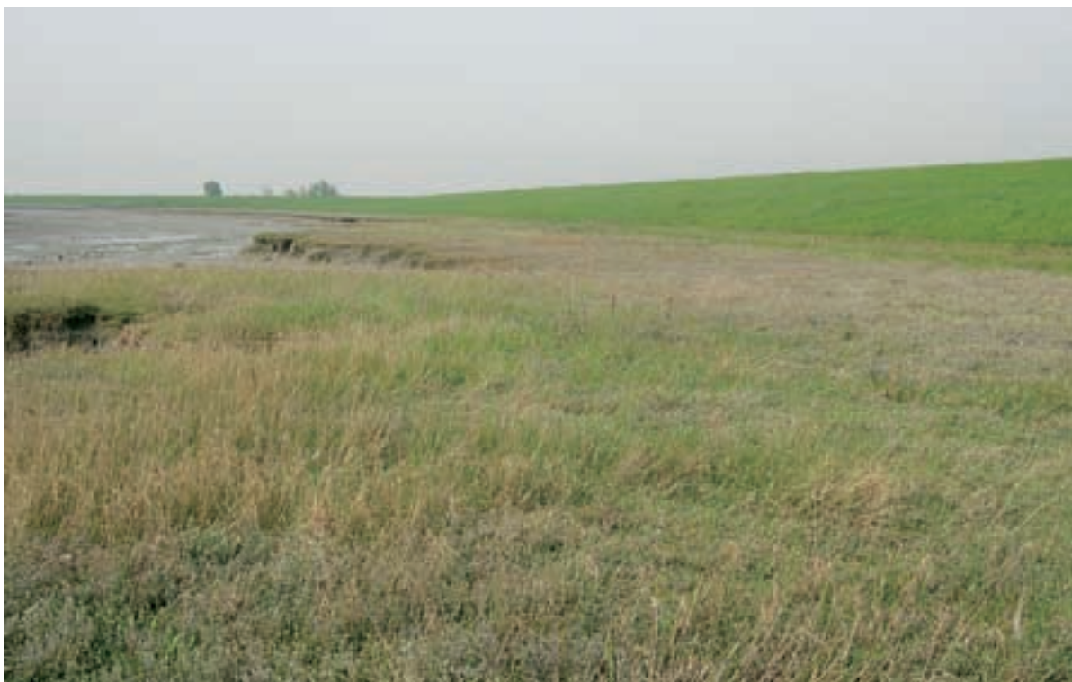
Foto 15 Proefstrook 7: Baarlandpolder; niet direct een werkstrook te zien, wel een opvallend vlak schor zonder geulen; ondanks het ontbreken van geulen ontwaterd het schor goed.