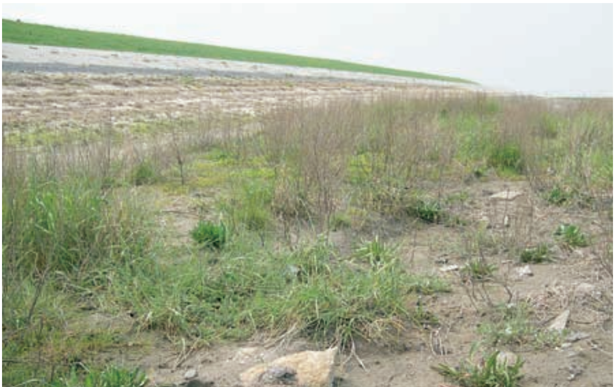
Foto 9 Proefstrook 4: Hellegatpolder: stenen aan de oppervlak in werkstrook. Werkstrook hobbelig afgewerkt.