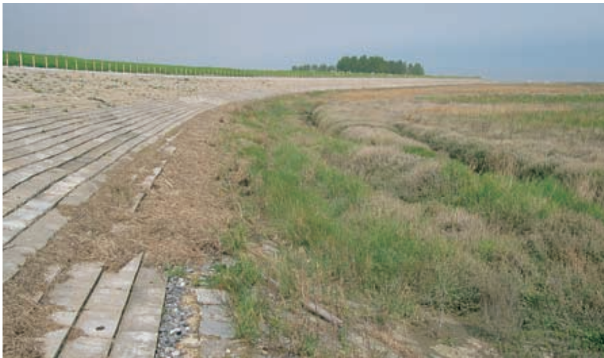
Foto 6 Proefstrook 1: Paulinapolder; de werkzaamheden zijn beperkt gebleven tot de boventafel, hierdoor is er geen werkstrook aanwezig op het schor.

Deze fotobijlage bevat een impressie van de verschillende proefstroken en de eventuele effecten die het gebruik van een werkstrook met zich meebracht. Het betreft een selectie van de vele foto's die genomen en bij RIKZ en MID Zeeland beschikbaar zijn.