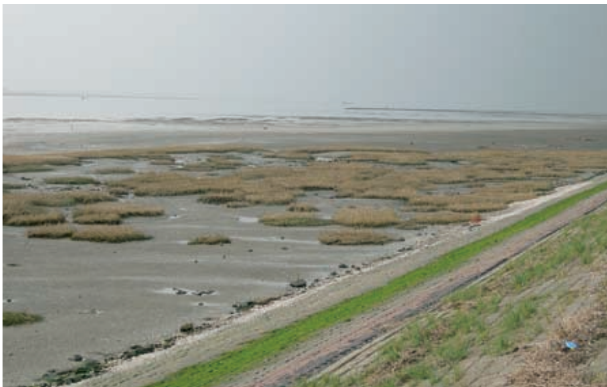
Foto 14 Proefstrook 6: Baalhoek; klein gedeelte duidelijk beter hersteld, waarschijnlijk beter afgewerkt; er zijn in ieder geval duidelijk minder stenen en de begroeiing heeft zich behoorlijk hersteld.