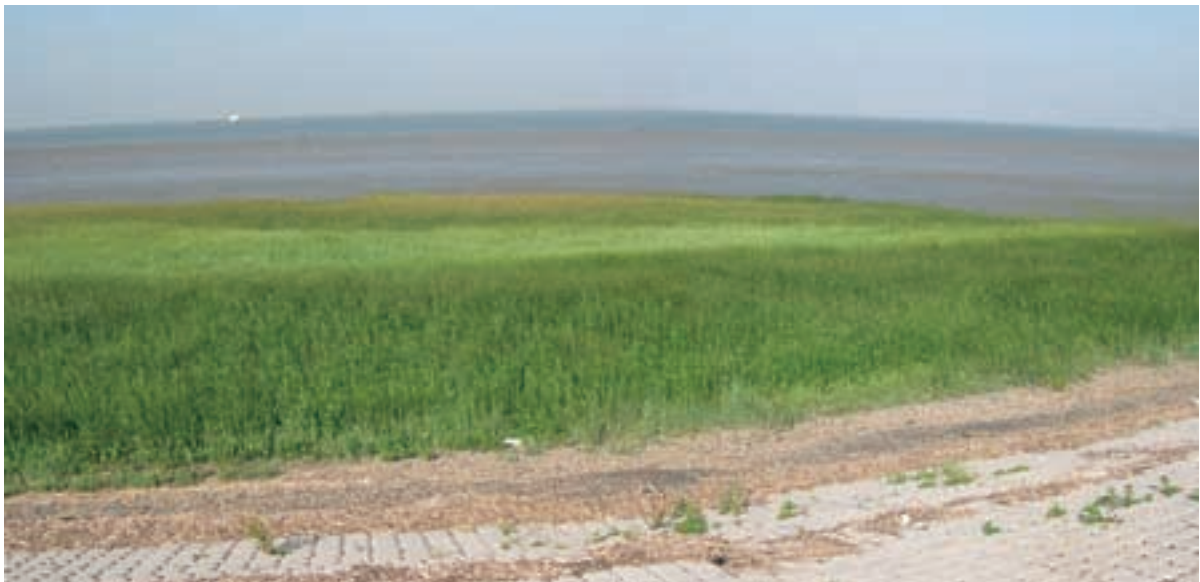
Foto 33 Proefstrook 25, Paviljoenpolder: duidelijke afwijking in de vegetatie op de plek van de voormalige werkstrook. Door de werkzaamheden is het schor weer teruggezet naar de pioniersfase.