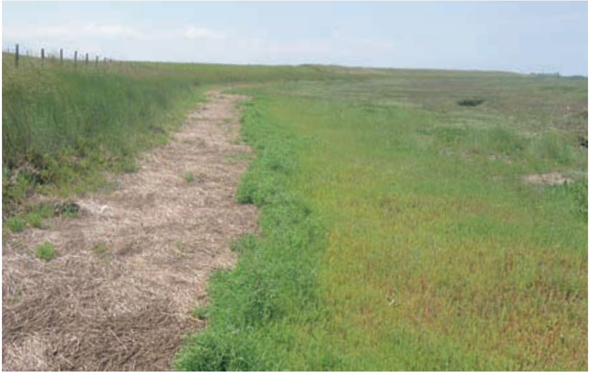
Foto 42 Proefstrook 32, St. Annaland: gedeelte met een veekrand langs de dijk; geen effect werkstrook.