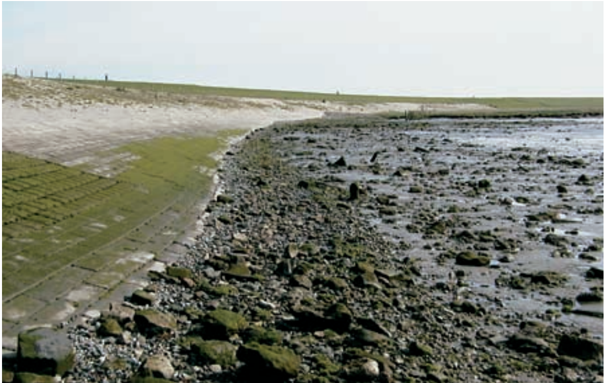
Foto 28 Proefstrook 20, Waarde –west: vrij veel stenen verspreid over het slik tot 8 meter breed.