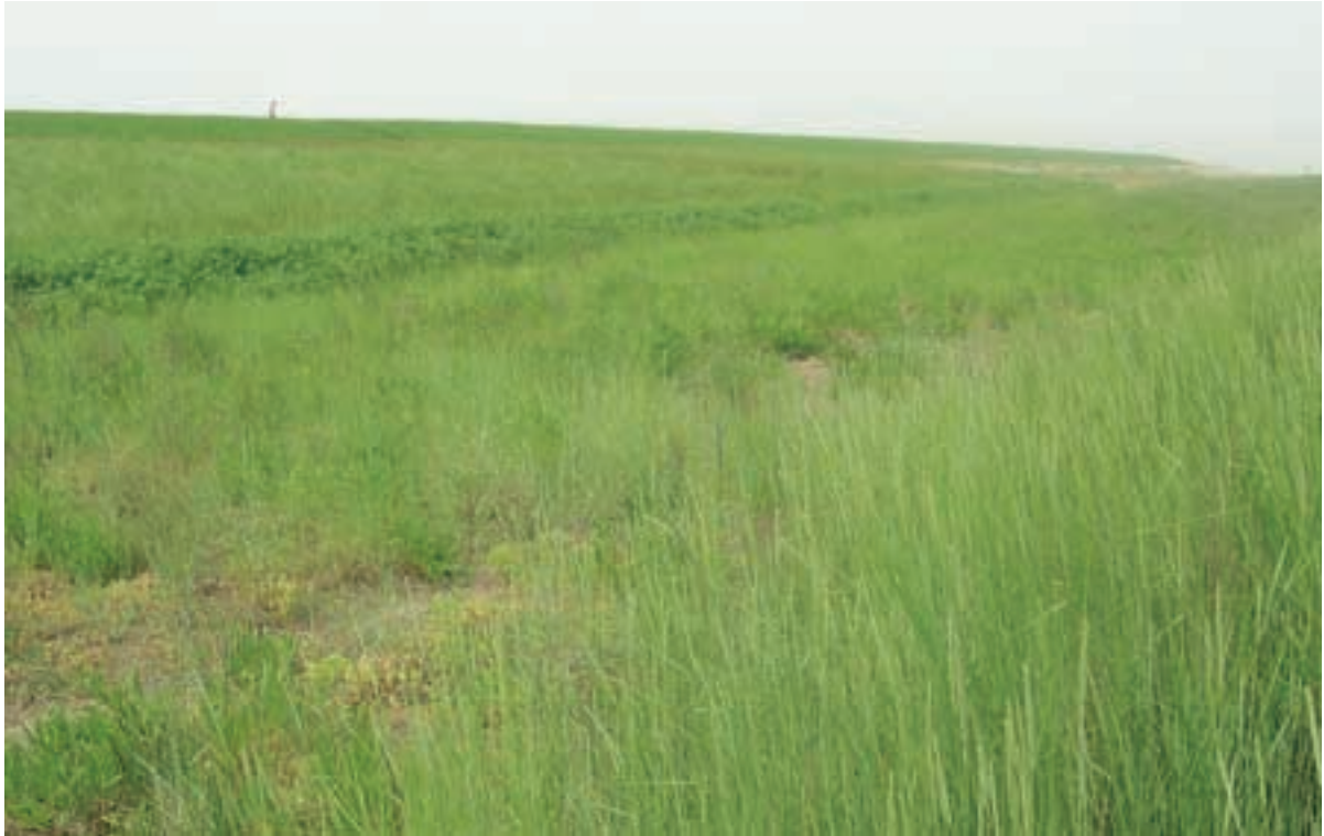
Foto 8 Proefstrook 3: Hellegatpolder; grens werkstrook te herkennen in vegetatie, de hoge vegetatie rechtsonder is niet verstoord geweest, de lagere strook parallel aan de dijk wel.