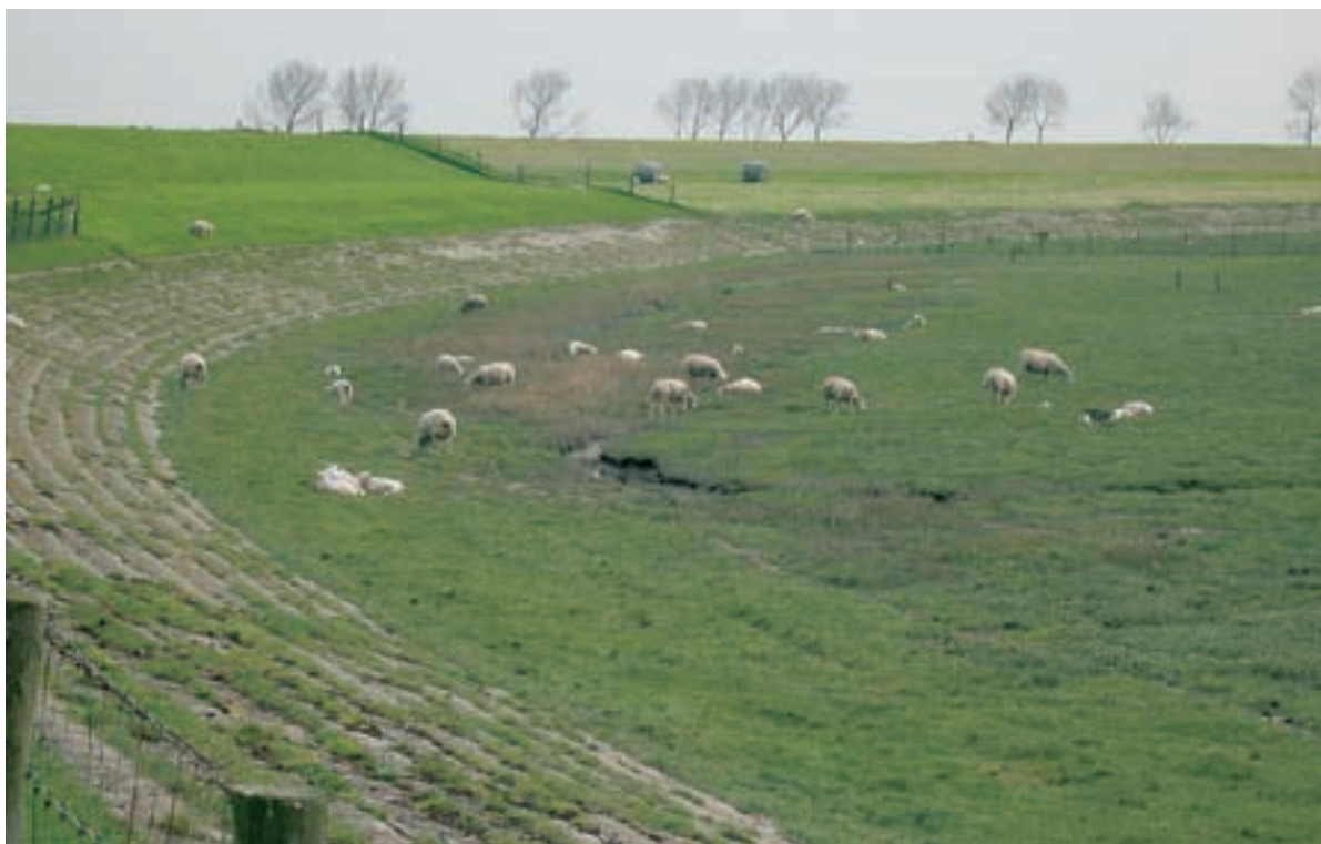
Foto 18 Proefstrook 9: Baarlandpolder: geen effect te zien, een eventueel effect in de vegetatie wordt tenietgedaan door de begrazing, die zorgt voor een korte egale vegetatie.