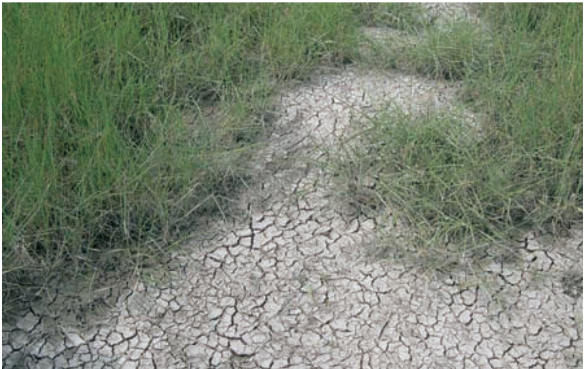
Foto 17 Proefstrook 8: Baarlandpolder: op de hoger afgewerkte werkstrook ontstaan krimp scheuren door verdroging.