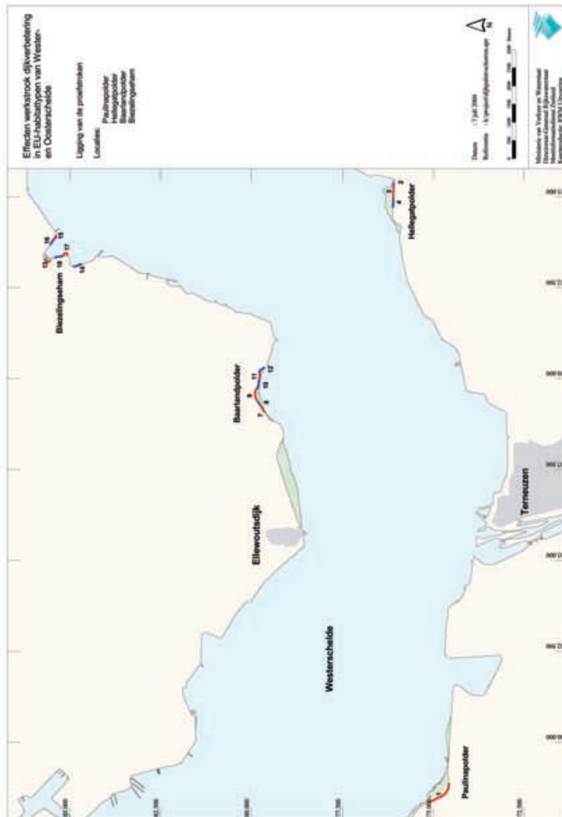
Kaart 1: Situering van de onderzochte proefstroken in de westelijke helft van de Westerschelde. De proefstroken zijn ter onderscheid met een rode of blauwe streep aangegeven. De nummers corresponderen met de (unieke) nummers van iedere proefstrook zoals die in het rapport gebruikt worden.

Kaarten met ligging van de onderzochte proefstroken in de Westerschelde en Oosterschelde