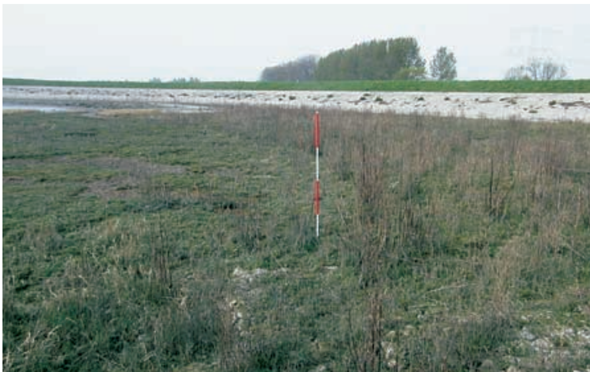
Foto 19 Proefstrook 13, Biezelingse Ham: duidelijk grens tussen ongestoord schor en verstoord schor, op verstoord deel is de vegetatie een stuk ruiger door het vrijkomen van voedingsstoffen door de verstoring en verdroging van de grond.