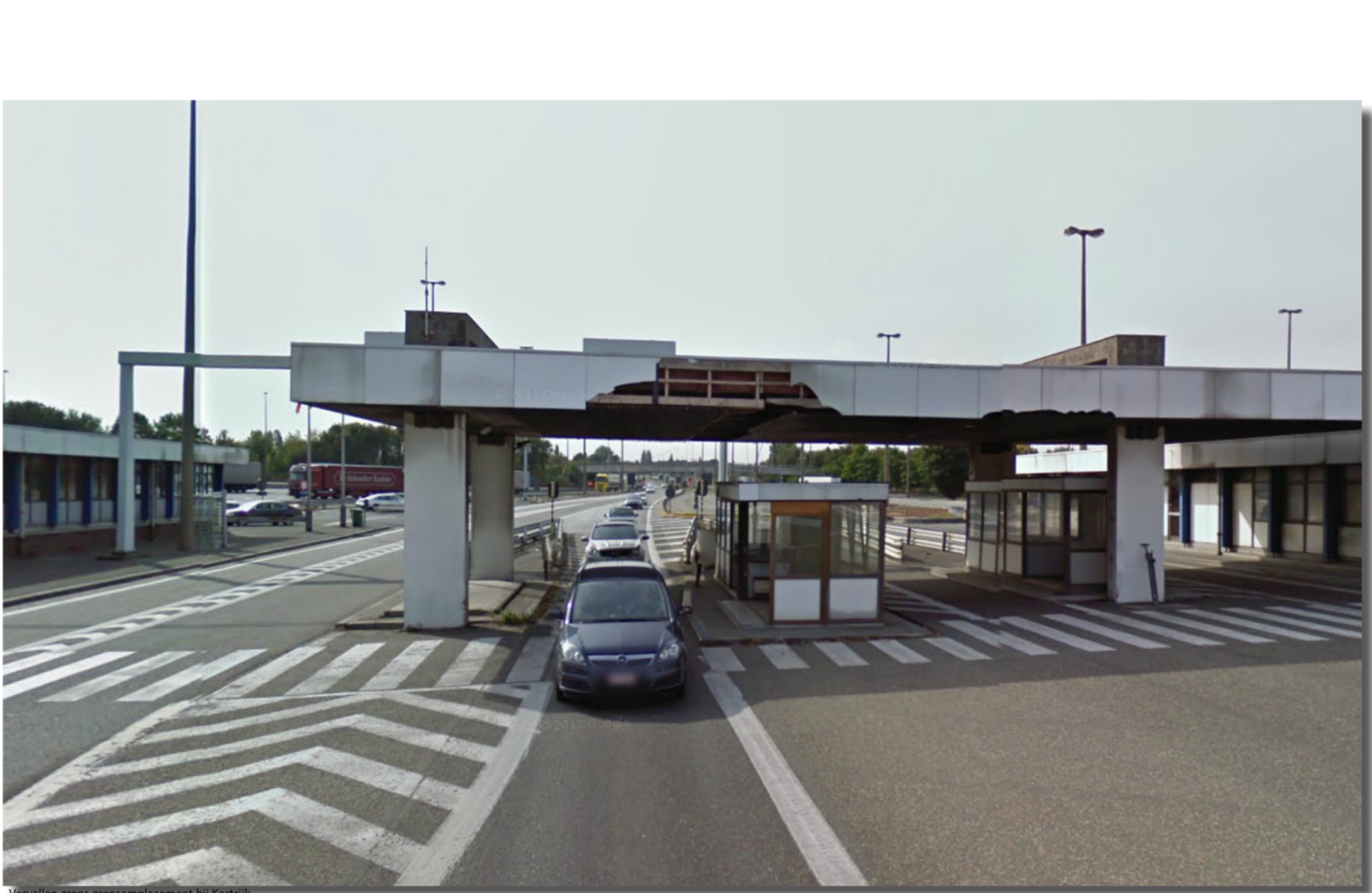
Vervallen grens grensgebied bij Koryk