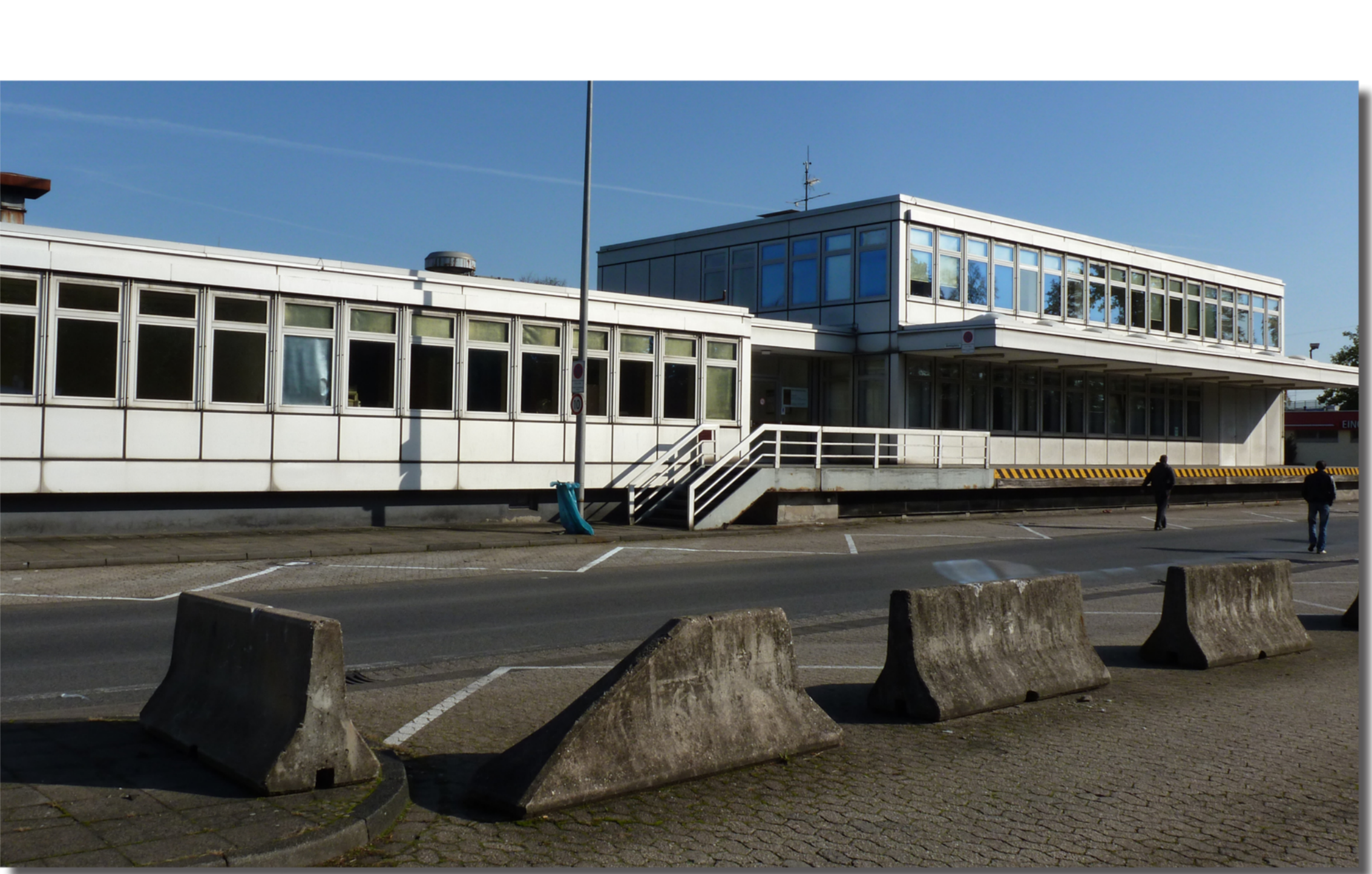
Vervallen douane gebouw Duits grensgebied bij Venlo