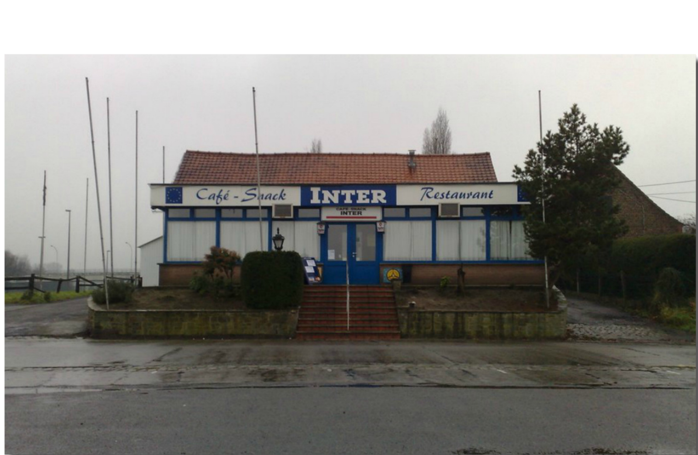
Wijkwinkels restaurant grensgebied bij Koryk