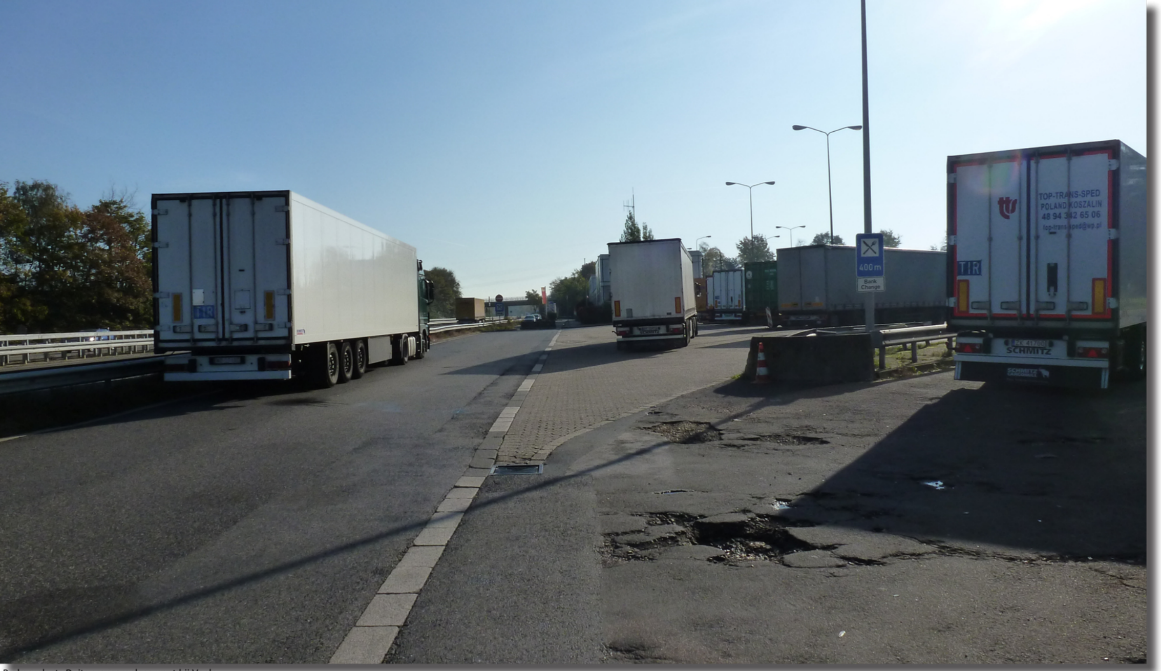
Foto's van Duits grensgebied bij Venlo