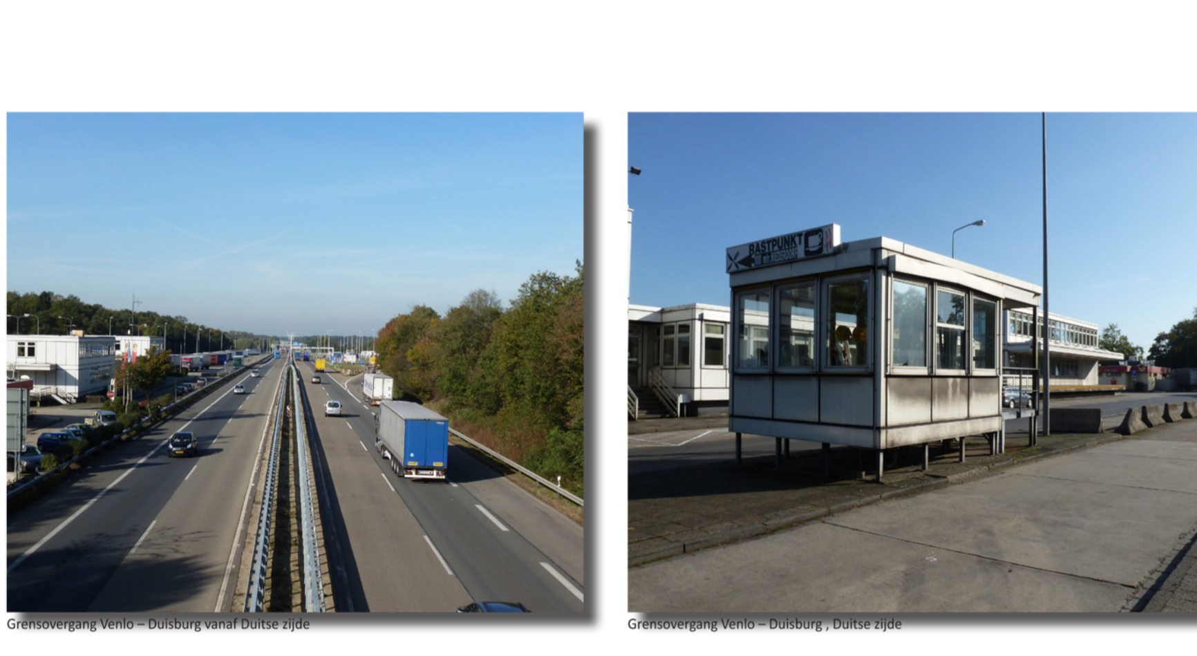
Grensovergang Venlo - Borsbong, Nederland

Daarnaast is er onderzoek gedaan naar de geschiedenis van grenzen en de rol van de huidige en toekomstige grensovergang eruit zint. Uitgeverij worden de verschillende functies en faciliteiten van grensovergangen door de jaren heen beschreven. Ook de invloed van de grenzen op economisch, sociaal, cultureel en emotioneel vlak komt aan bod.