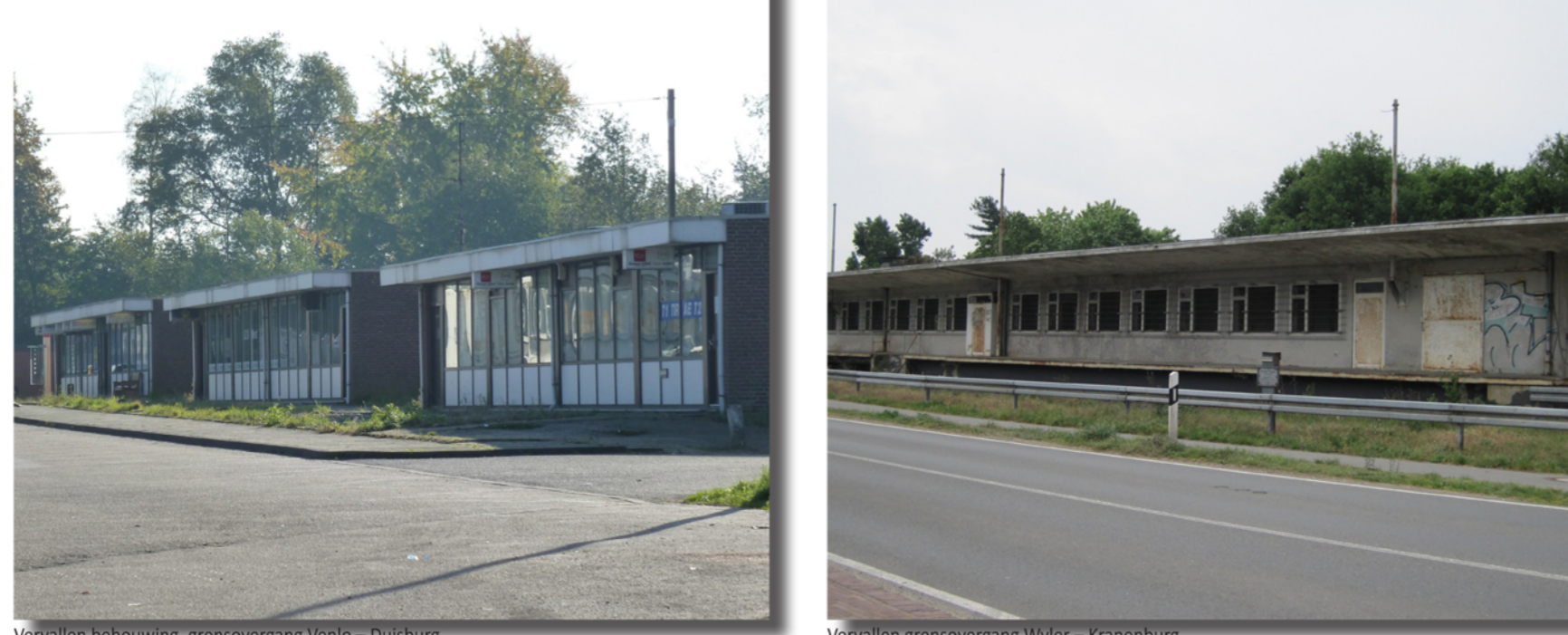
Wijkwinkels bebouwing grensovergang Venlo - Borsbong