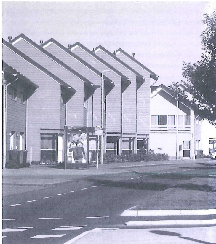
Vinex in voormalige groeikern Purmerend.

spreiding op een hoog schaalniveau voorgestaan. De bedrijvigheid en de werkgelegenheid dreigden zich te zeer in de Randstad te concentreren. Dat was aanleiding om een overheveling van bedrijven en arbeidsplaatsen te bepleiten van de Randstad naar de meer perifere regio's, met name Groningen en Limburg. De Rijksoverheid gaf het voorbeeld door uitplaatsing van de grote overheidsorganisaties voor telecom KPN, statistische analyse CBS en ambtenarenpensioenen ABP vanuit de Randstad naar elders. Maar het bedrijfsleven volgde niet: het ruimtelijk spreidingsbeleid zakte als een pudding in elkaar en is later nimmer herrezen.