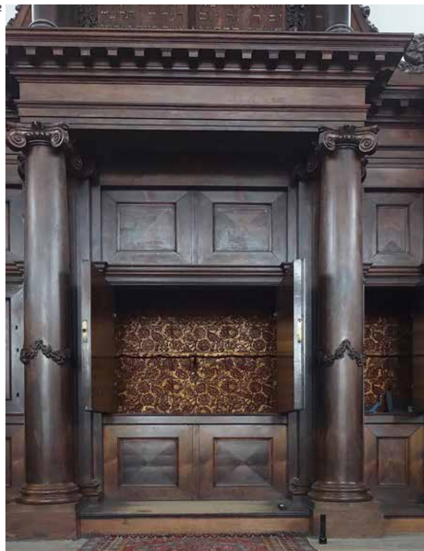
2 Toraschrein der Portugiesischen Synagoge in Amsterdam. Die Innenseite ist mit Goldleder ausgestattet, geschmückt mit Blumenmuster (1675, Südniederlande)

Die Lederschicht stammt von verschiedenen Tierarten, zum Beispiel Kalb, Ziege oder Schaf, meist in Abhängigkeit von der Region, in welcher es produziert wurde. Tierhäute bestehen aus Kollagenmolekülen, welche sich wiederum aus Polypeptidketten zusammensetzen. Die mechanischen und ästhetischen Eigenschaften des Leders variieren je nach Tierart und Gerbungsqualität. Die Tierhaut wird in einem chemischen Prozess bearbeitet, der die Zusammensetzung und Struktur stark verändert und Haltbarkeit und Widerstandsfähigkeit gegenüber Wasser und biologischem Abbau verbessert. Vor dem 19. Jahrhundert wurden Pflanzentannine aus Eichenrinde, Kastanien, Sumach und Kirschkpflaumen verwendet, die das Leder durch Hydrolyse veränderten.