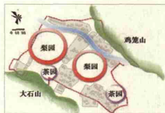
图5 虎巢里资源分布图

产业复合是乡村活力得以持续的重要途径也是体现乡村体验度的主要指标之一。规划设计中依据产业的区位分布情况、发展前景等因素来激发产业类型、体验方式的更新转换。这是现代化乡村发展的重要模式之一，