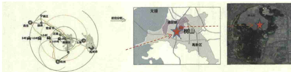
图1 树山村区位分析图