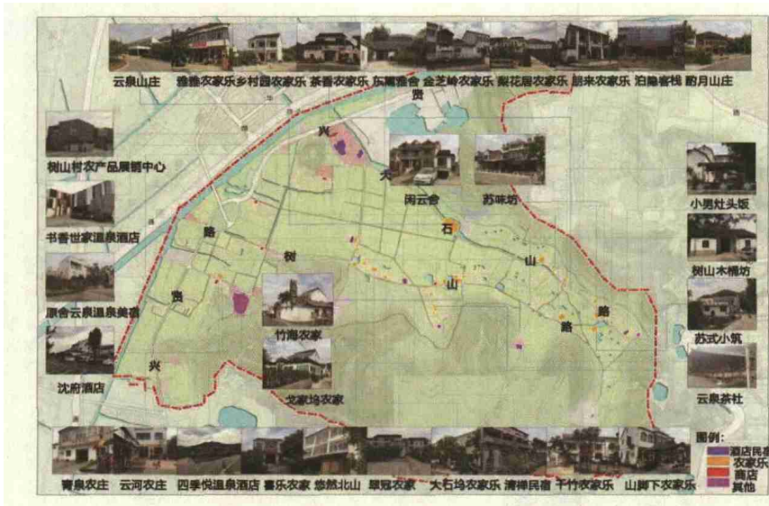
图3 树山村第三产业现状图