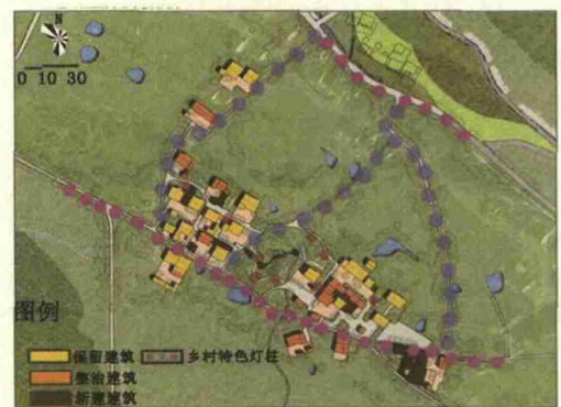
图7 虎巢里主要景观道路分析图