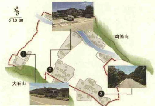
图8 虎巢里入口池塘、中部聚落、茶林片区空间分布图