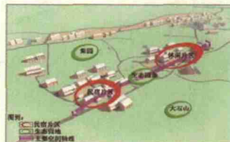
图6 虎巢里空间构成分布图