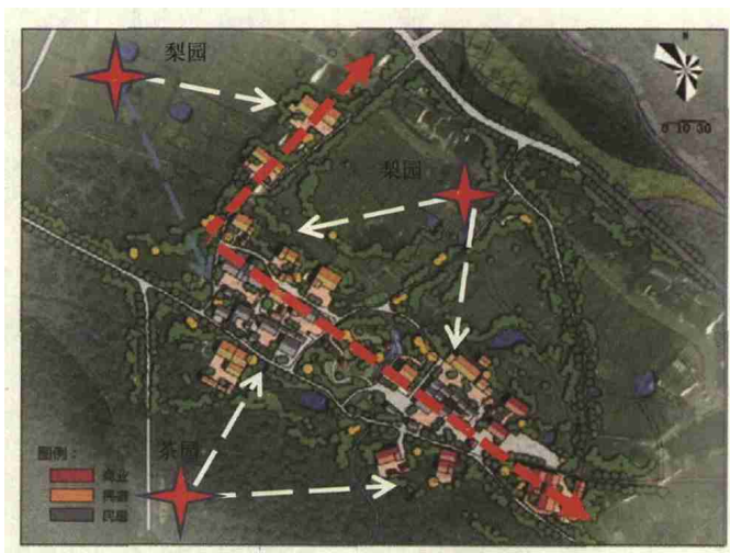
图9 虎巢里平面效果图

其二是田园景观的体验升级:特色田园乡村的“田园”即其镇域内发展的“源动力”,借助乡村的源动力实现乡村功能的改造升级。此外,农业生产模式与居民活动类型关系紧密,农业转型的同时也伴随着乡村建筑的转型,故乡村农业向景观化农业、居民房向精品民宿的转变是乡村功能置换的重要研究内容。引入品牌民宿,打造虎巢里精品民宿区,并在片区内配套生态园地、书院、咖啡吧、农事体验馆等休闲娱乐设施,将绿色与休闲双重概念引入村庄内部,进而优化乡村产业链的整体