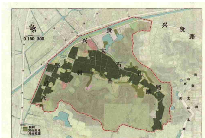
图4 树山村第一产业分布图

研究分析虎巢里资源分布情况，重新规整资源、划分空间结构。引导梨田产业向第三产业多维度衍生发展，保证农产品的产量、质量同时带动旅游业、服务业发展。借助特色田园乡村模式来规划虎巢里农业资源，紧密联系梨田景观与周围聚落及其负形景观空间之间的整体规划和关联度。（图5）虎巢里内部主要交通路线的相邻空间类型较简单，两边散落着大小不一、质量不均的民房。依据虎巢里现状调研，寻找空间类型发展的可能性并实行“一轴两片多点”的发展策略，针对民宿片区、休闲片区、生态园地建构综合性景观结构。设计的目的