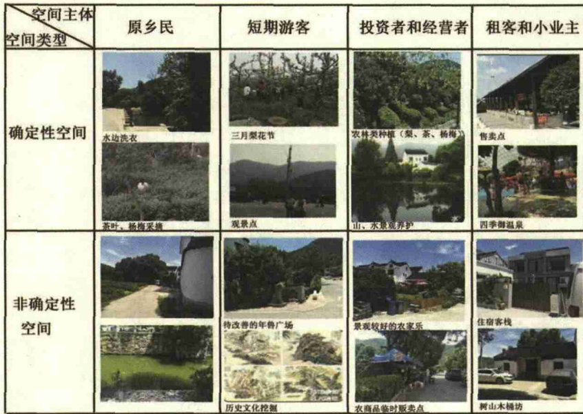
表 1 体验式空间分析表

梨花节、果树采摘季及健身登山等活动作为吸引力，更深层次“无形”历史文化意涵的挖掘是维系乡村持续活力的重要源泉；投资者和经营商植入新型的产业模式刺激乡村发展，为当地商业发展起到模范作用；租客和小业主两者关系密切，空间参与类型涉及商店类、民宿类、居住类等，是未来形成乡村结构优化的基础。