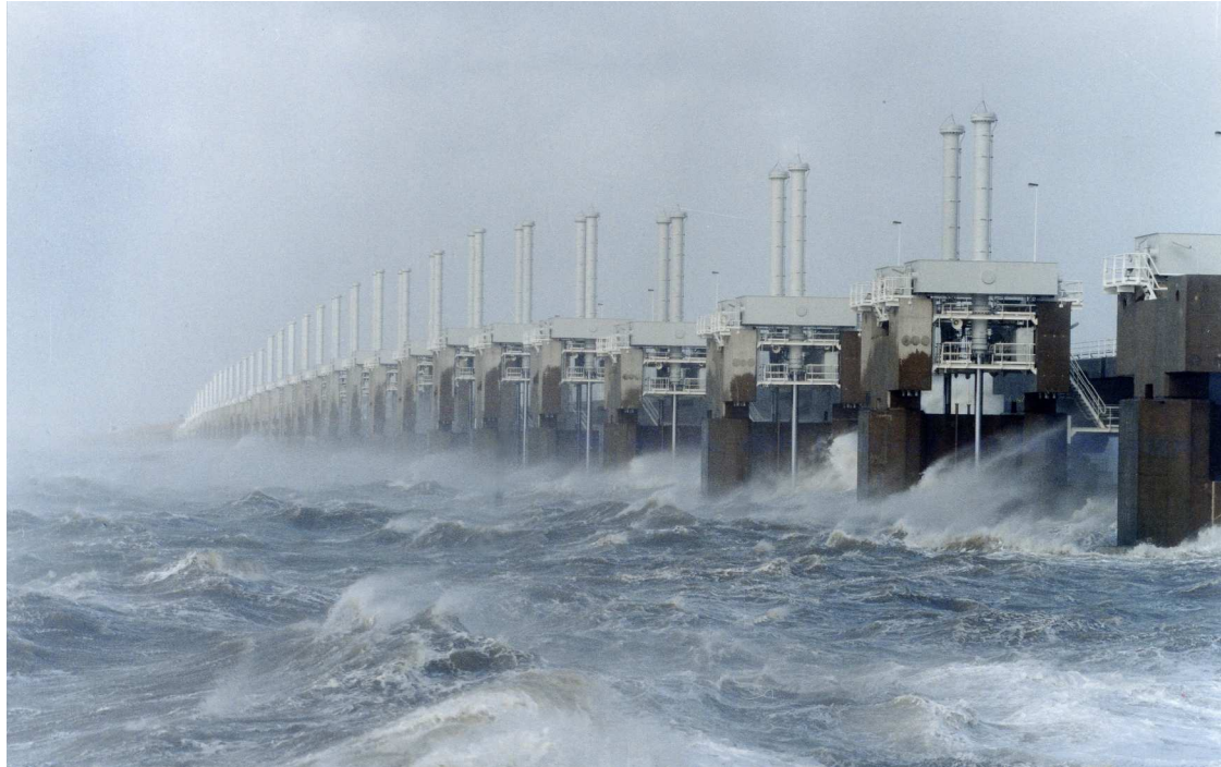
Figuur 4: Oosterscheldekering

De toegestane mate van overlast is vastgelegd in normen. De trend in watermanagement is om van een normbenadering naar een risicobenadering te gaan, waarbij de schade per jaar wordt bepaald en afgewogen tegen investeringen om deze schade te voorkomen. Andere ontwikkelingen zijn er in informatiemanagement, real-time sensoren, real-time control en integraal beheer. Nu is het nog veel feedback regelen, maar feedforward is in opkomst.