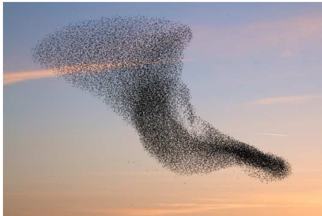
Figuur 1: Startrek met vogels

verschillen. Filevorming treedt bijvoorbeeld bij bewegingen van groepen dieren niet vaak op, omdat er meer ruimte is (tussen dieren en daarnaast 3D); bovendien bewegen ze zich voort met ongeveer dezelfde snelheid en ze kunnen sneller reageren, dan automobilisten die specifieke handelingen moeten uitvoeren.