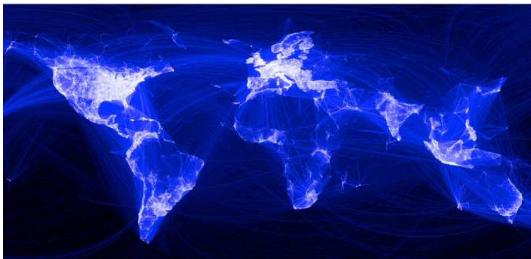
Figuur 3: Beschikbaarheid van internet

Verkeerstromen van verschillende diensten (telefonie, data) worden over dezelfde netwerken afgewikkeld. Hierdoor kan netwerkcapaciteit efficiënter worden benut. Digitale informatie die van A naar B moet worden verzonden wordt in kleinere pakketjes opgedeeld en in pakketten verpakt, deze worden vervolgens over het netwerk verstuurd, waarna ze bij bestemming B worden uitgepakt en op volgorde worden gezet. Verschillende diensten stellen verschillende eisen aan het netwerk. Binnen communicatienetwerken is het niet bezwaarlijk dat pakketjes af en toe worden weggegooid als dat voor de afwikkeling zo uitkomt. Problemen die in communicatienetwerken ontstaan bij de afwikkeling van verkeer worden vooral veroorzaakt door het onvoorspelbare, random, karakter van het verkeer. Bij problemen in het netwerk wordt in toenemende mate een beroep gedaan op zelforganisatie. Aan de hand van een viertal maatregelen die binnen communicatienetwerken worden ingezet wordt hieronder uitgewerkt hoe toepassing van deze maatregelen in het personenverkeer eruit zou kunnen zien.