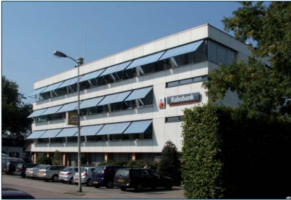
Een van de onderzochte bankgebouwen.

INKOS toegepast. Tabel 2 geeft de uitkomsten van de analyses voor het afgebeelde pand. Voor dit pand blijkt hergebruik in financieel opzicht het meest lucratief, gevolgd door herbestemming naar maisonnettes, met behoud van de gevel, een winkel in de plint en één laag optoppen.