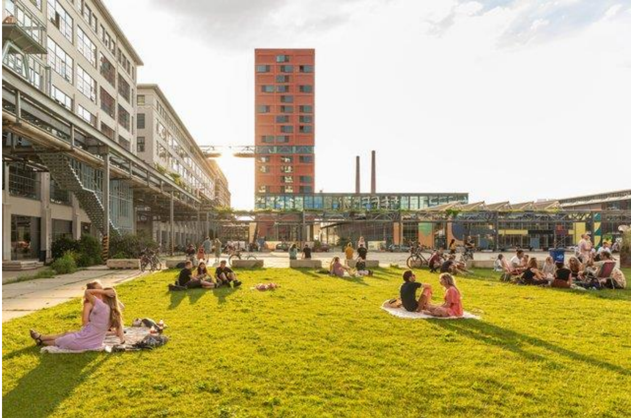
‘Strijp S, Eindhoven’ door Lea Rae (bron: Shutterstock )

Momenteel vertaalt de zoektocht naar een nieuw nationaal ruimtelijk perspectief voor Nederland zich in een overdaad aan nationale programma’s, sectorale ambities, deadlines en de bijbehorende stortvloed aan overleg en papier (of Pdf’s). De klacht van velen is dat de systeemwereld en de beleefde wereld steeds meer uit elkaar gaan lopen.