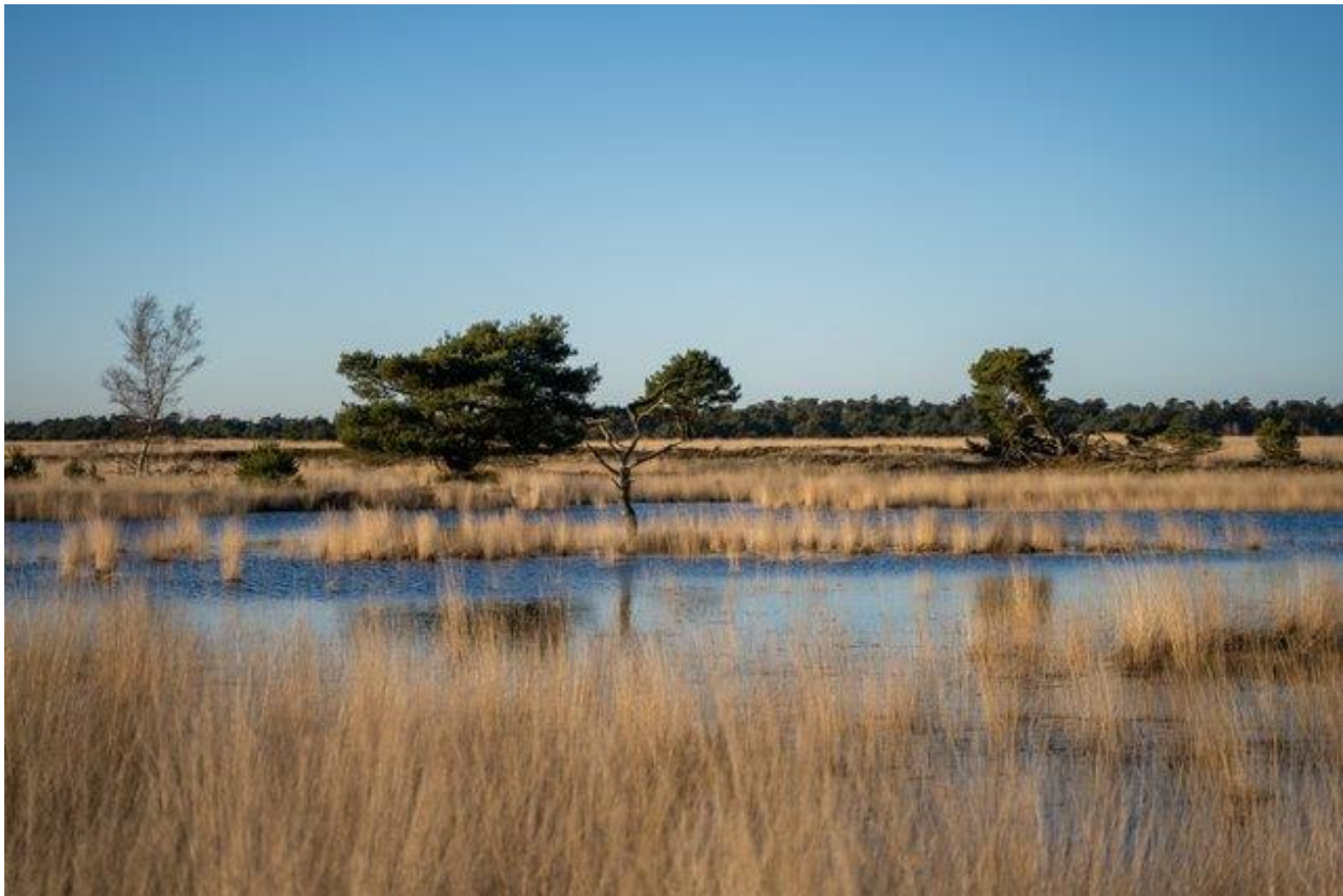
‘Prachtige heide in de avondzon bij Nationaal Park De Hoge Veluwe’

Na een paar decennia veronachtzaming van het nationale beleid zijn we ingehaald door een aantal majeure opgaven die maatschappelijk wisselend gepercipieerd worden en niet passen in de ruimte die ons ter beschikking staat. Hoezeer velen dat ook betreuren, is het niet meer dan logisch dat we nu staan waar we staan als het gaat om de ruimtelijke toekomst van Nederland. We hebben ons huiswerk laten sloffen en moeten dus aan de bak. Vooralsnog vertaalt die inhaalslag zich in een reeks van sectorale Rijksambities rondom energie, klimaat, wonen, verduurzaming, bereikbaarheid, et cetera die als het ware over de publieke, private en maatschappelijke partners uitgestort worden. Deze stortvloed maakt dat velen het overzicht kwijt zijn, leidt tot veel overleg en maakt dat er een mismatch wordt ervaren tussen de beleidsmatige ambities (systeemwereld) en de ‘echte wereld’.