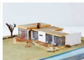
1957 Woonhuis Gorissen, Lelidshendam