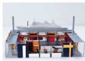
1959 Tentoonstelling Nederlands Fabrikat HAI-RDH