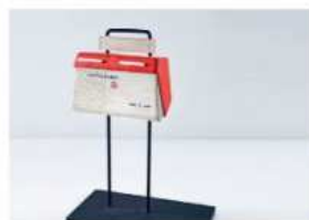
1957 Brievenbus PTT (Parry-Truijen)