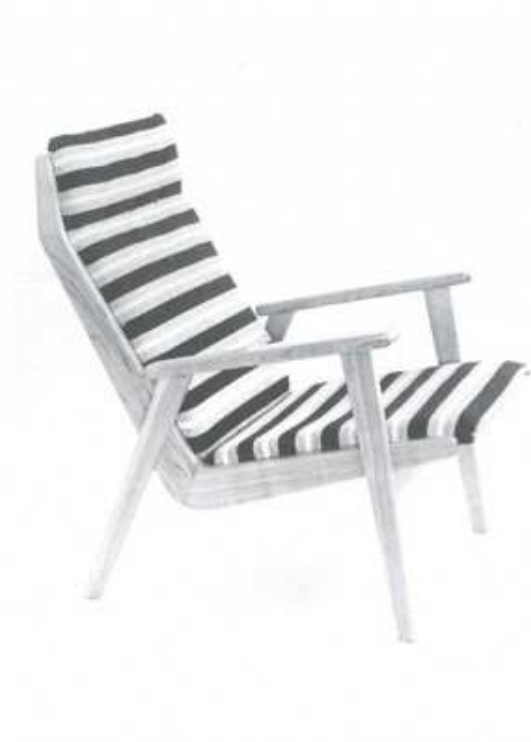
l. stoel met beweegbare rug (1950), r. stoel 1611 (1952)