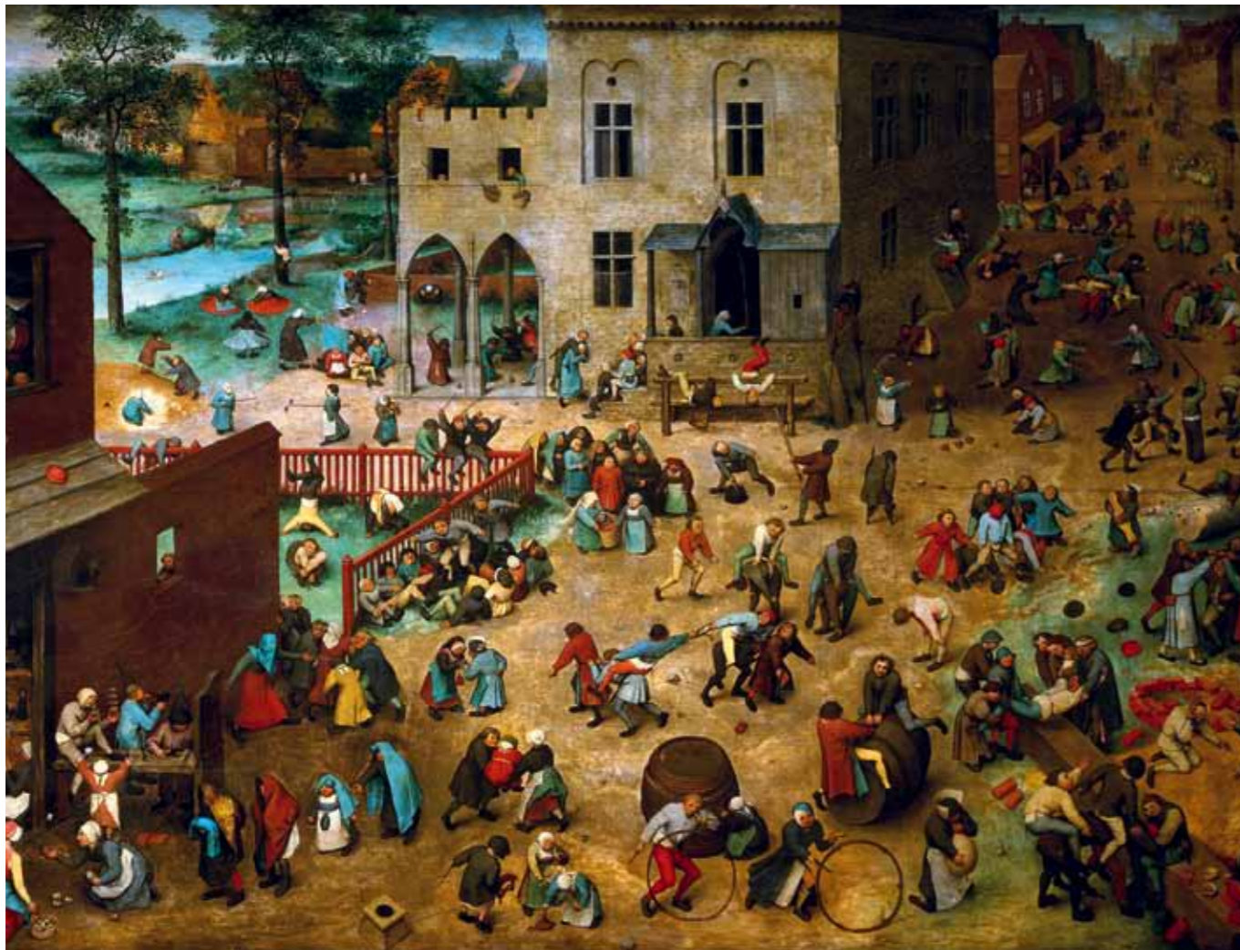
'Kinderspelen' heet het schilderij van de Vlaamse schilder Pieter Bruegel de Oude uit 1560. Er staan tachtig verschillende kinderspelletjes op die in de Lage Landen populair waren.

Waren speeltuinen voor de oorlog nog gericht op de schoolgaande jeugd, na de