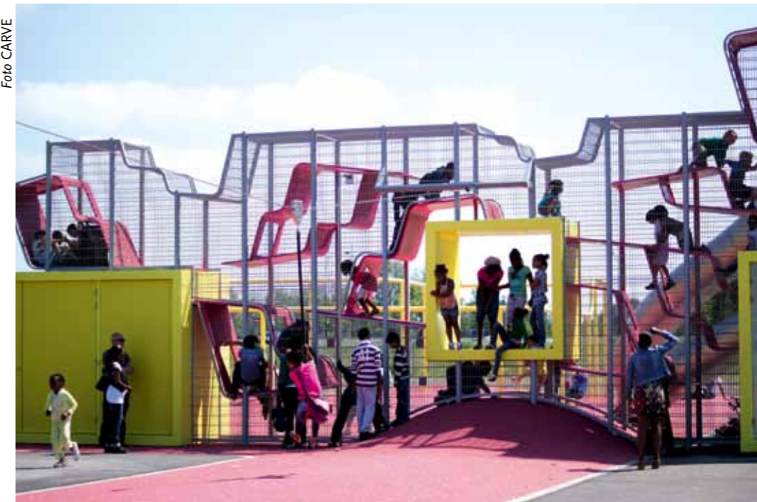
Een iconisch speelobject, zorgvuldig ingebed in het Bijlmerpark.

Landschapsarchitect Marie-Laure Hoedemakers realiseerde in 2010 samen met CARVE midden in het park een omvangrijke speeltuin. Evenwijdig aan de hoofdroute voor langzaam verkeer ligt een langgerekte strook met een balspeelveld, kabelbaan, skatepark en waterspeelplaats, voorzien van unieke toestellen. De zogenoemde 'king crawler' is een kooi van verschillende verdiepingen, waarin diverse speeltoestellen zijn geïntegreerd. Dankzij de zorgvuldig gekozen plaats, bijzondere vorm en opvallende kleur is het geen geïsoleerd object, maar een integraal onderdeel van het Bijlmerpark in de wijk.