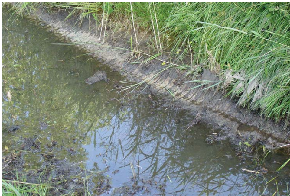
Afb. Te veel bodem meegepakt bij maaiakorf.

Veel auteurs beargumenteren dat natuurONvriendelijk schoonbeheer de groei van woekeraars, die de doorstroming beperken, eerder stimuleren dan verminderen. Maaien in het voorjaar kan leiden tot explosie van snelle groeiers (Griffioen en