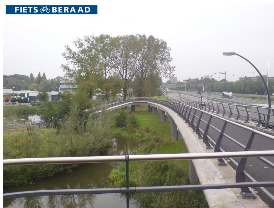
Fietsbrug Amstelveen.

De tweede poging was meer succesvol. Ook hier was het meest heikele punt de kostenverdeling. De kleinere gemeenten tussen Arnhem en Nijmegen hadden minder financiële armslag, terwijl een groot deel van de infrastructuur op hun grondgebied zou worden gerealiseerd. De twee kleinere gemeenten kregen daarom tot 90% financiering door de toenmalige Stadsregio Arnhem Nijmegen. De Rijksbijdrage vanuit Fietsfilevrij was daarnaast ook behulpzaam, maar niet doorslaggevend. De Stadsregio legde vervolgens een visie neer voor een uitgebreid snelfietsnetwerk rondom Arnhem en Nijmegen. Dit plan vormt nog steeds de basis waarop wordt verder gebouwd. Belangrijk uitgangspunt in de projecten was dat een probleem bij gemeente A als een gezamenlijk uitdaging werd gezien door alle betrokken gemeenten. Daarom is realiseren van een snelfietsroute ook een proces van de lange adem, waar het belang van de regionale fietser soms uit het oog wordt verloren. Na opheffing van de Stadsregio werd het stokje overgedragen aan de provincie, die op iets meer afstand staat van de gemeenten. Als reactie hebben de gemeenten hun samenwerking versterkt door de opzet van een nieuw regionaal overlegorgaan. Continue afstemming blijkt van groot belang.