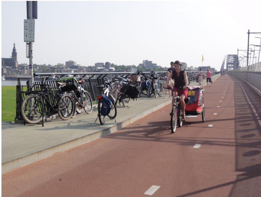
Fietsbrug Nijmegen - Lent

De elektrische fiets was in het begin met name bij ouderen populair, maar is inmiddels ook gemeengoed onder scholieren en forensen. Desondanks zijn de verschillen tussen een normale fietser en een elektrische fietser betrekkelijk klein. Gemiddeld respectievelijk 3,6 kilometer tegenover 5,2 kilometer per rit. Wat verklaart het onderbenutte potentieel van de elektrische fiets?