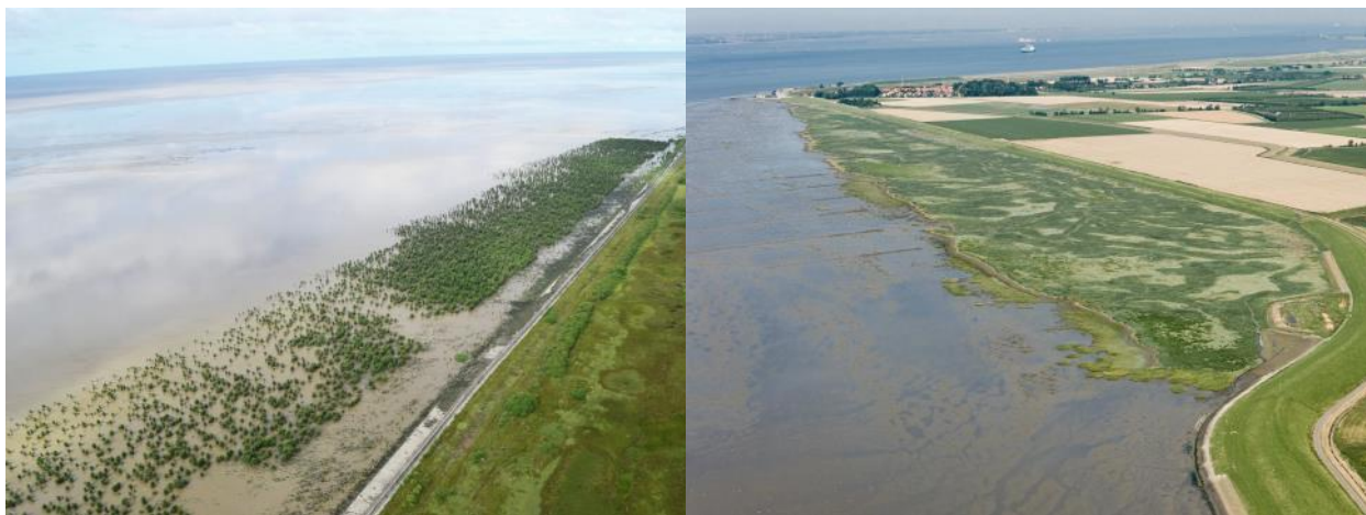
Afbeelding 2. Begroeide voorlanden: mangroves in Guyana (links) en schorren in de Westerschelde (rechts)

Tot slot kunnen de in dit project ontwikkelde methoden ook internationaal bijdragen aan het ontwikkelen van innovatieve natuurlijke strategieën. Op veel plekken in de wereld spelen (of speelden) ecosystemen als wetlands en mangroves (Afbeelding 2) een belangrijke rol bij de kustverdediging.